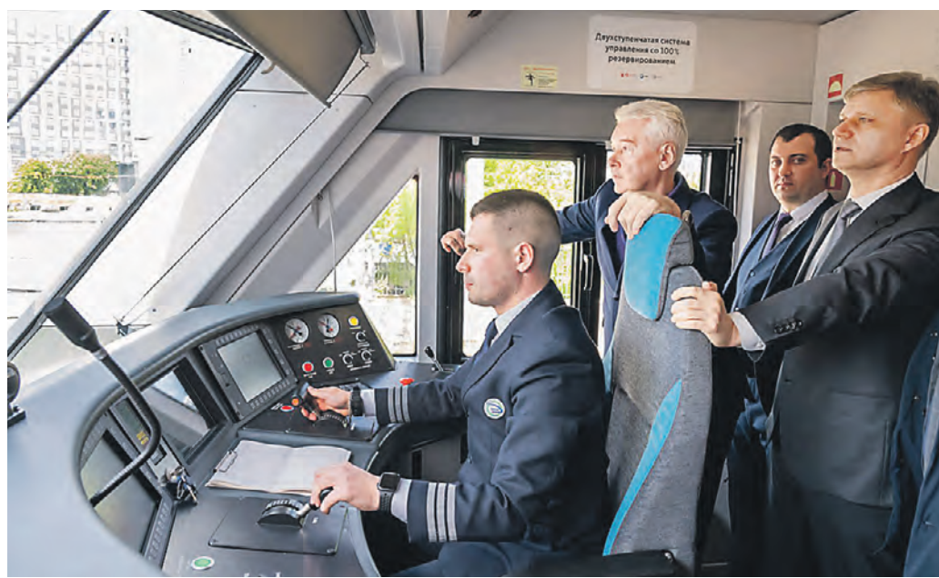
2 мая. Мэр Москвы Сергей Собянин (в центре) и гендиректор РЖД Олег Белозеров (справа) оценили плавность хода «Иволги 4.0», которой управляет машинист Александр Малков

нии запуска поезда «Иволга 4.0». — Сегодня на МЦД-1, МЦД-2 полностью обновлен подвижной состав. На МЦД-3 обновление будет закончено в этом году. В следующем году — на МЦД-4. Таким образом, 100 процентов подвижного состава на диаметрах будет новым. Глава города отметил, что поезд «Иволга» специально создавался для МЦД. — И сегодня запускается уже четвертая модель этого поезда. Она максимально приближена к самым лучшим мировым стандартам, — подчеркнул он. Также мэр заявил, что в планах — обновление пригородного сообщения всего Центрального транспортного узла, и напомнил, что проект МЦД получил поддержку президента России Владимира Путина, который участвовал в его запуске в 2019 году. По словам мэра, несколько лет тому назад сложно было представить, как этот проект создаст новый толчок для разви-