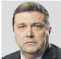
ВЛАДИМИР СОЛОВЬЕВ ПРЕДСЕДАТЕЛЬ СОЮЗА ЖУРНАЛИСТОВ РОССИИ

Раньше, когда мы учились в 1990-е годы, то ориентировались на образцы западной журналистики и считали их недостижимыми. Ведь они были для нас эталоном творчества и мастерства. Но постепенно стало понятно, что многое поменялось, и говорить о какой-то свободе слова в тех странах, которые сейчас воюют против России, уже бессмысленно. Попробуйте сейчас увидеть российские телеканалы в Лондоне, Париже, Нью-Йорке или в других городах: если раньше в любой гостинице, включив телевизор, можно было найти сразу несколько на выбор, то сейчас это невозможно сделать ни через интернет, ни через спутниковую тарелку. Другое дело в России: в нашей стране в интернете можно увидеть практически все. В том числе и материалы тех наших коллег, которые бежали на Запад и открывали работу против России. Я думаю, что это истинное проявление свободы печати.