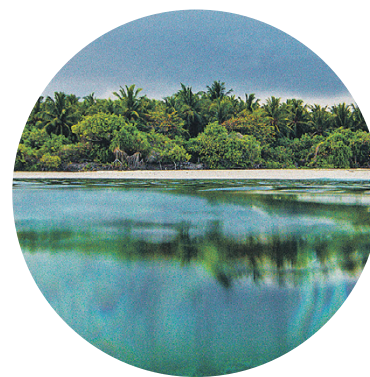
Остров на Мальдивах площадью 12 га, арендованный для проекта The Ostrov

Тем временем Юрченко увлекся очередным мегапроектом.