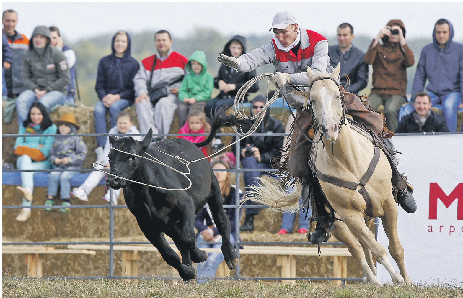
«Мираторг» стремится к глубокой переработке всех частей животных, выращиваемых на предприятиях холдинга. На фото: корпоративное мероприятие компании «Мираторг» «Русское родео-2015»