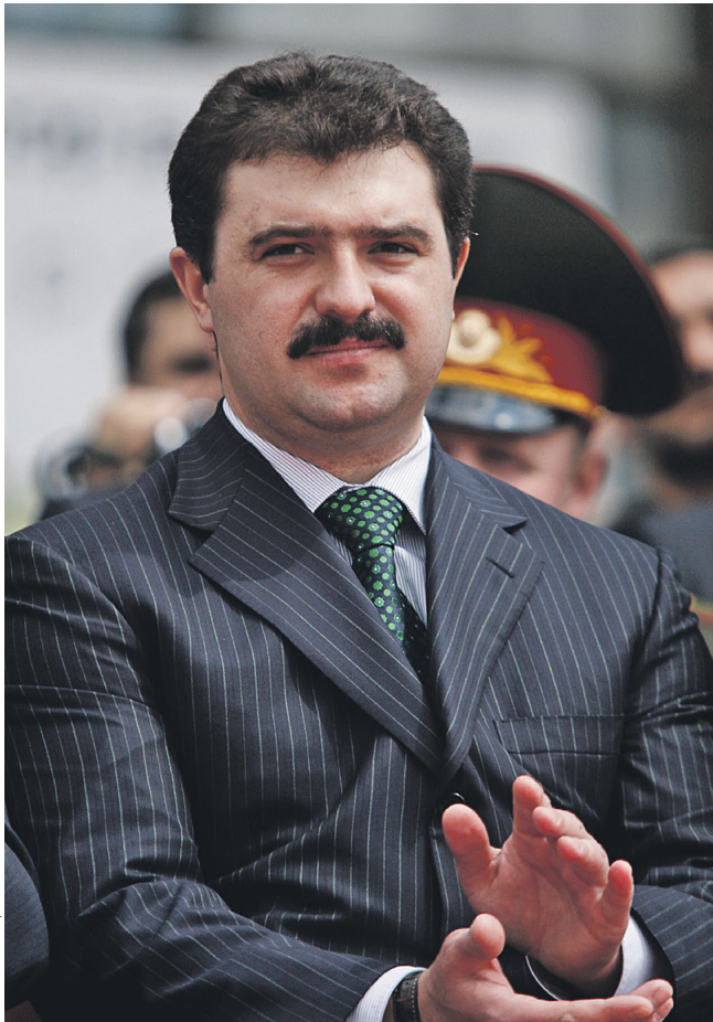
↑ Виктор Лукашенко — 41-летний сын президента Белоруссии Александра Лукашенко. Помощник президента Белоруссии по национальной безопасности, член Совета безопасности Белоруссии. После выпуска из университета два года работал в Министерстве иностранных дел Белоруссии

→ Росарио Мурильо — 65-летняя супруга президента Никарагуа Даниэля Ортеги. Стала вице-президентом страны в январе 2017 года. До этого десять лет работала пресс-секретарем своего мужа. В 1970-е была активистом Сандинистского фронта национального освобождения, где и познакомилась с Ортегой