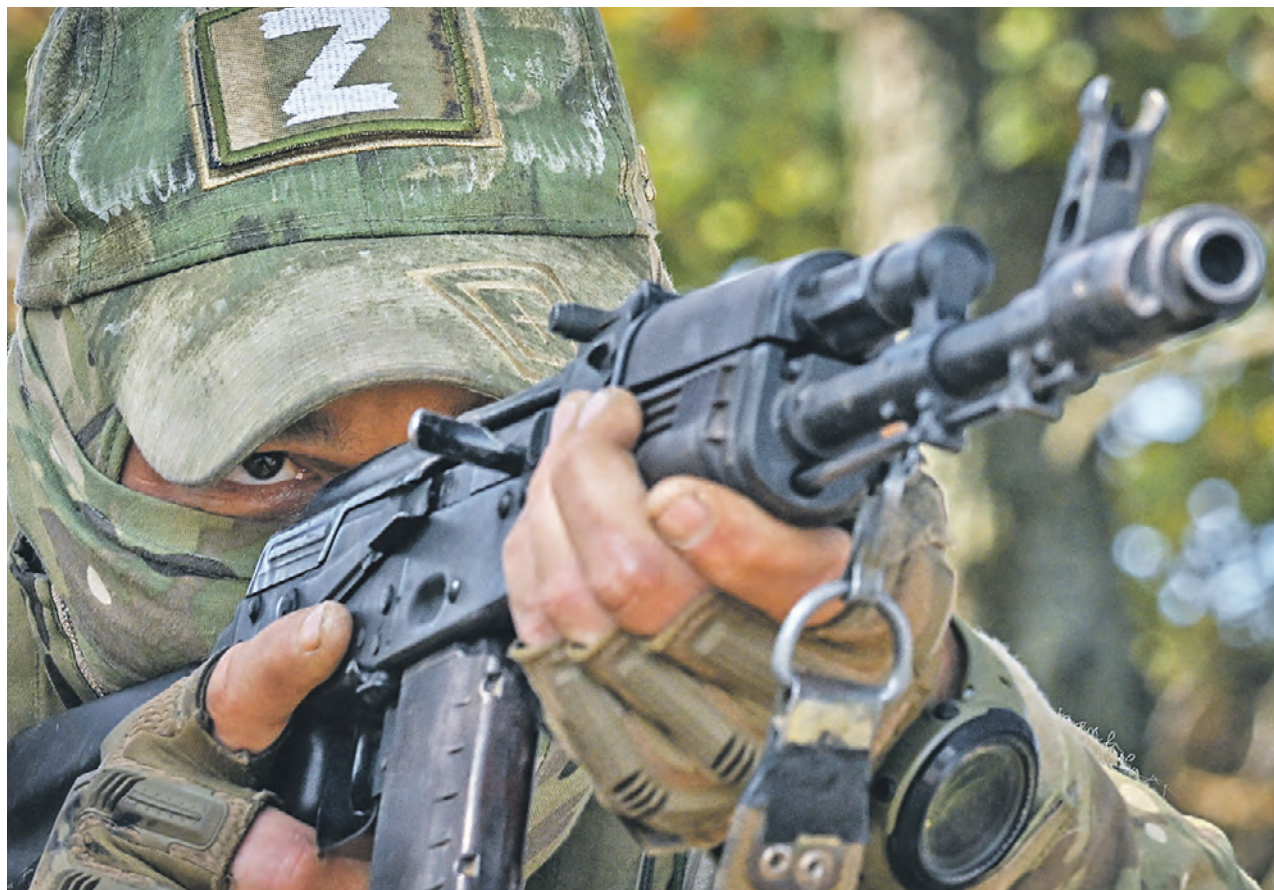
29 сентября. Боец разведывательного батальона «Волки» на бахмутском направлении СВО