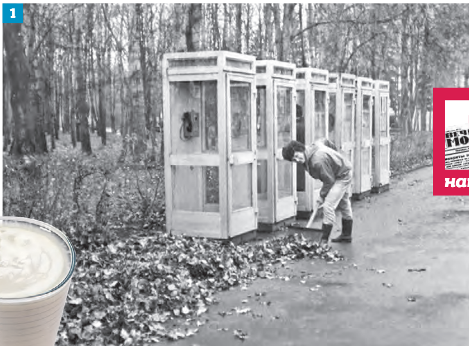
1986 год. Октябрьский субботник по уборке листьев в «Лужниках» (1). 2. Стакан с кефиром, который раньше по стандартам мог храниться в течение 36 часов с момента окончания технологического процесса (2)

данные в тот год предоставило Российское республиканское промышленное объединение молочной промышленности.