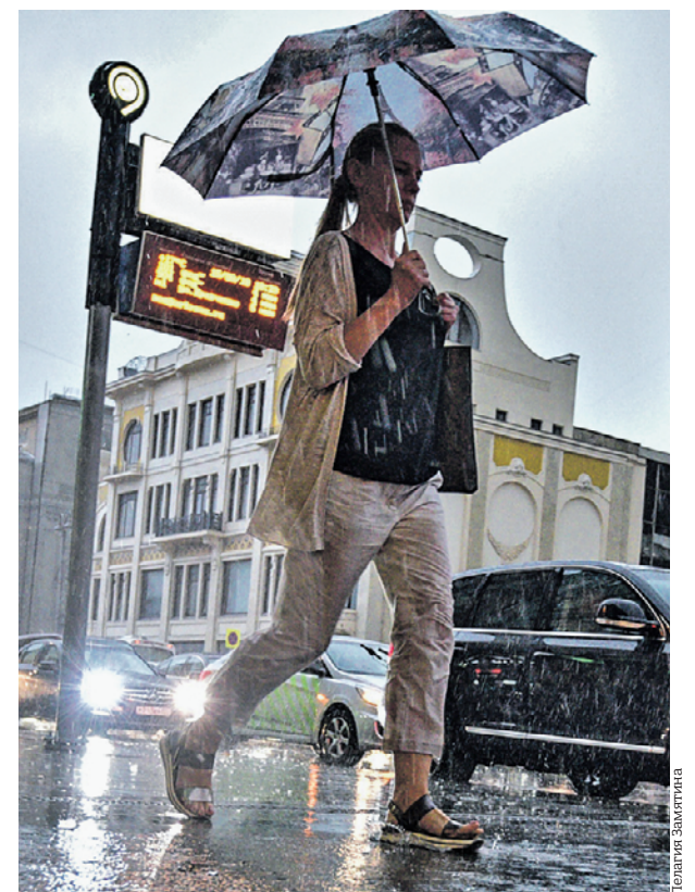
15 августа 2018 года. Дождь застал москвичку на Пушкинской площади

Кирилл Николаев Полина Гребенникова vecher@vm.ru