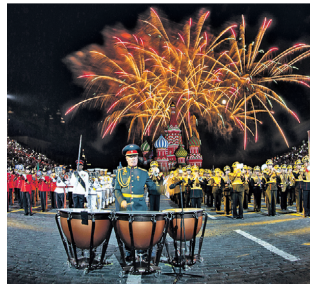
Выступление сводного оркестра на фестивале «Спаская башня 2018»

Летний кубок Центрального административного округа по мини-футболу стартовал 1 июня. Матчи проходят на открытых спортивных площадках. Участвуют 8 команд: «Пресня», «Смоленка», «Мещанка», «Камни», «Рабочий поселок», «Шеллепиха», Влас Eagles и UzBoys. Турнир завершится 24 августа. Все победители получают кубки и медали. Кроме того, организаторы награждают игроков, особо проявивших себя во время этого сезона.