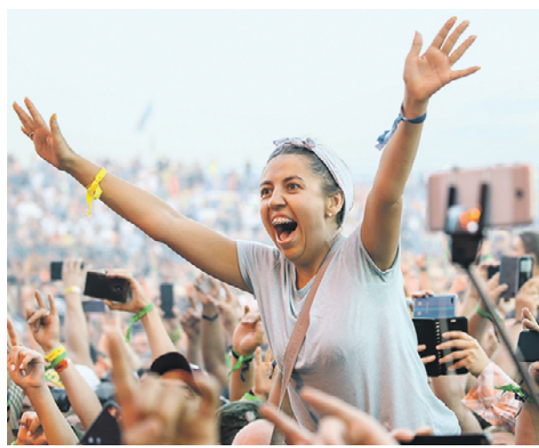
3 августа 2018 года. Зрители на всероссийском фестивале под открытым небом «Нашествие — 2018»