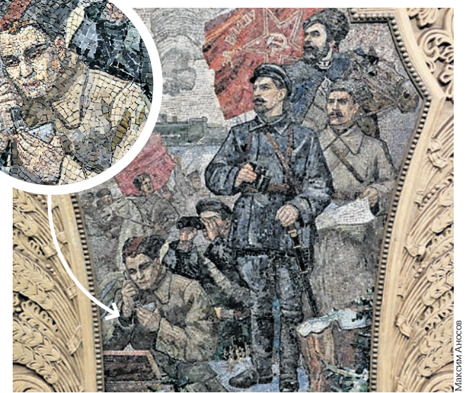
1 февраля 2019 года. Фрагмент мозаики на станции «Киевская» с изображением красноармейца