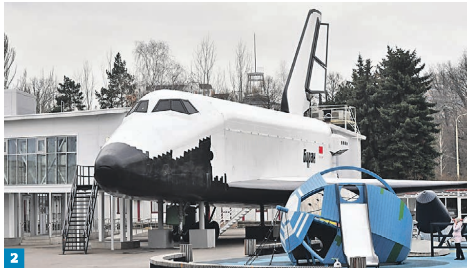
Александр Кудельно/РИА Новости