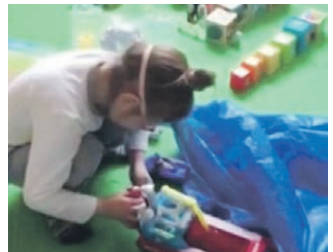
Органы опеки и попечительства подадут иск об ограничении родительских прав родителей девочки