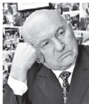
Юрий Лужков скончался в возрасте 83 лет

■ Сегодня в столице в последний путь проводили Юрия Лужкова. Его похоронили на Новодевичьем кладбище. Юрий Лужков умер 10 декабря в одной из клиник Мюнхена из-за осложнений, возникших при операции на сердце. Причиной смерти стала сильная аллергическая реакция во время плановой операции. Соболезнования близким Юрия Лужкова выразили президент России Владимир Путин, премьер-министр РФ Дмитрий Медведев, министр обороны Сергей Шойгу, председатель Совета Федерации Валенти-