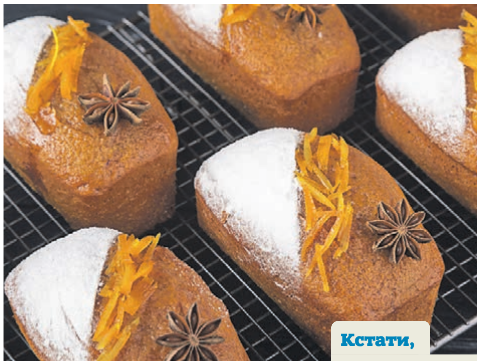
Медовые кексы получаются пышными и сладкими