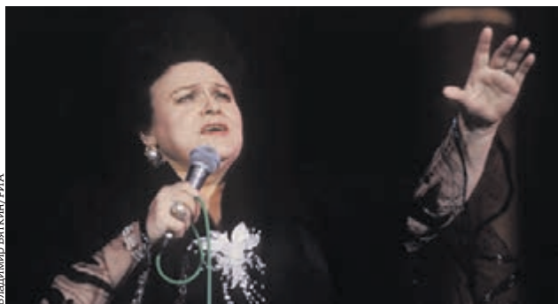
Великая Людмила Зыкина на одном из концертов

Наследство известного человека всегда притягательно для аферистов. Ну как не попробовать оттянуть себе кусочек от лакомого, вожделенного пирога! Когда начинается гонка за наследством, исчезает все