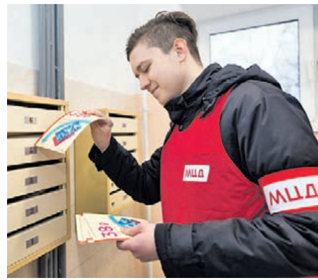
Листовки с «Тройками» распространили по почтовым ящикам домов, находящихся вблизи станций МЦД