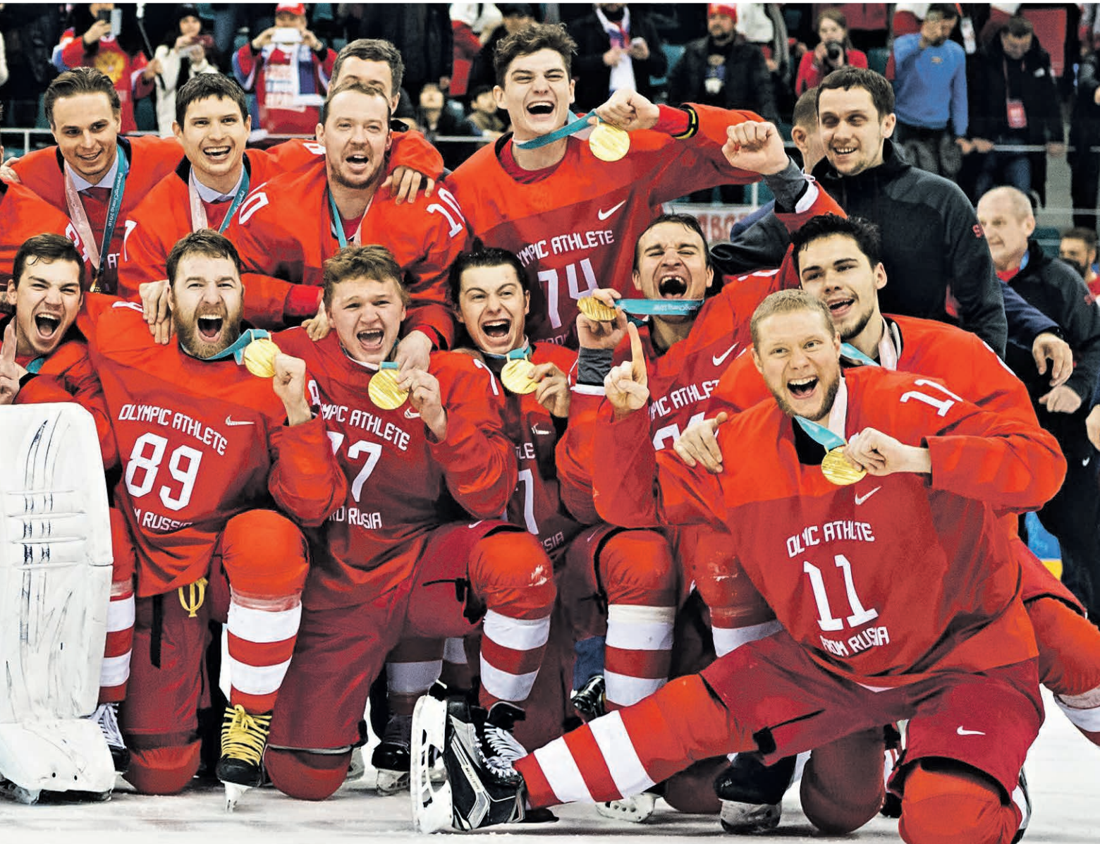
2018 года. ийской команды ризов