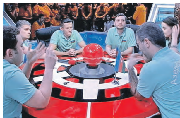
Сборная Азербайджана по «Брейн-рингу»

в него продолжали играть, причем массово. Параллельно с этим эфирные версии интеллектуальной игры вышли в Белоруссии, Азербайджане, Казахстане и на Украине. И скоро он вернется к нам! — Мы уверены, что возрождение проекта «Брейн-ринг» станет знаковым событием для всех поклонников данного формата, — говорит генпродюсер НТВ Тимур Вайнштейн. Правила состязаний останутся неизменными, а кроме этого, в паузах зрители смогут насладиться му-