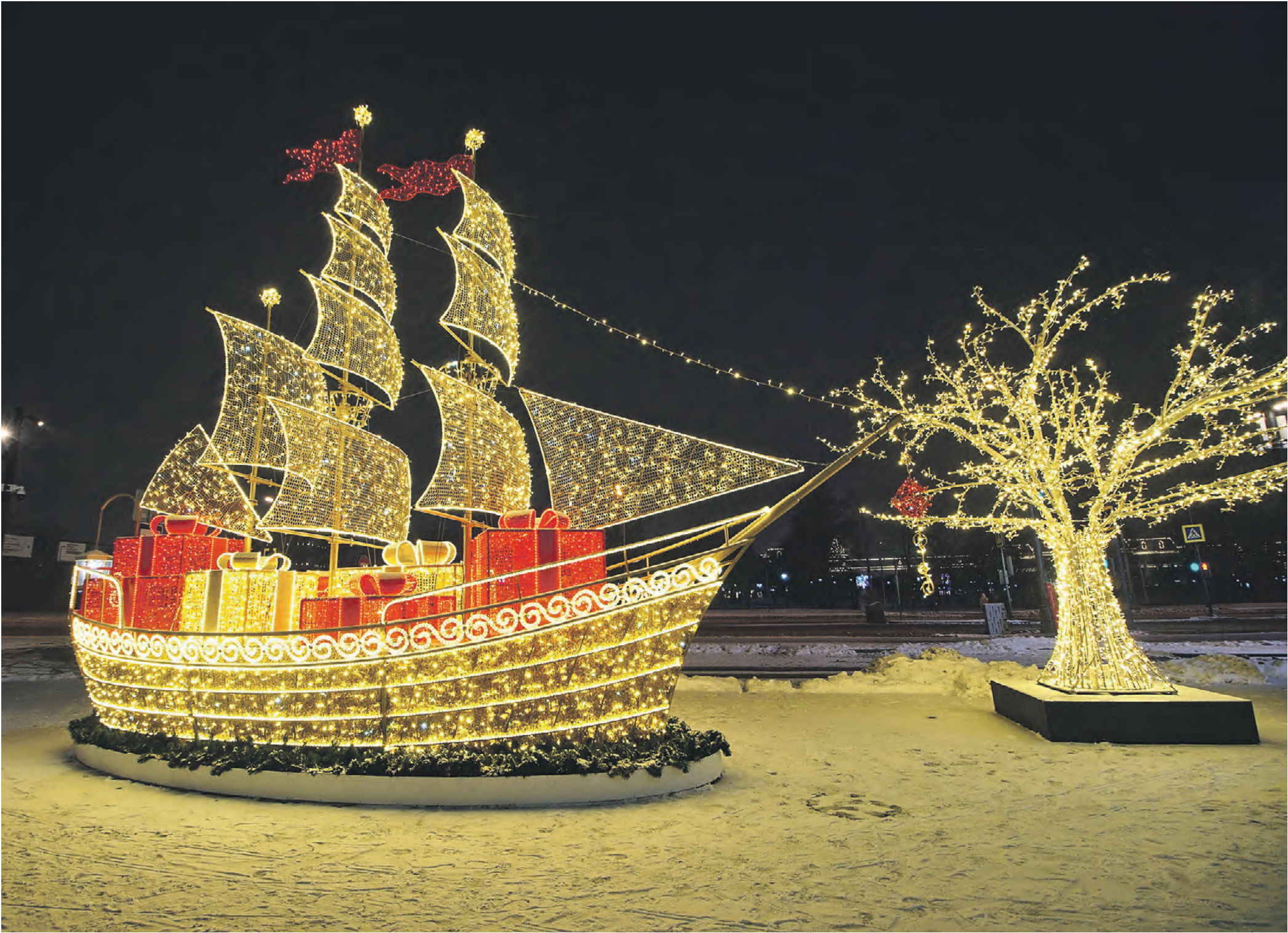
Праздничная инсталляция в виде парусного корабля, наполненного новогодними подарками, встречает посетителей Южного речного вокзала яркими золотистыми и красными огнями. Всего на территории речных вокзалов столицы установили около 20 тематических инсталляций, а стоящие рядом деревья и фасады зданий украсили россыпью гирлянд.