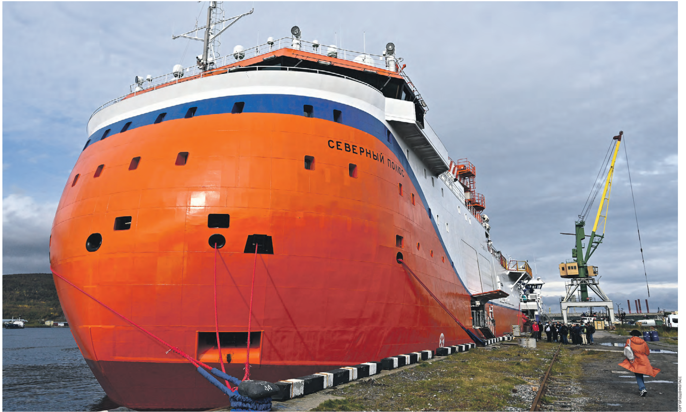
15 сентября 2022 года. Ледостойкая самодвижущаяся платформа «Северный полюс» в Мурманске. Она предназначена для проведения исследований в течение круглого года в высоких широтах Северного Ледовитого океана

Ученый подчеркивает, что причин для образования нового института в то время было предостаточно. — Если не брать во внимание такие политически важные вещи, как престиж страны и демонстрация научного превосходства, то прикладным значением экспедиции были исследования для обеспечения беспосадочных перелетов в Северном Ледовитом океане, — рассказывает директор Арктического и антарктического научно-исследовательского института. — А это существенное достижение с точки зрения обо-