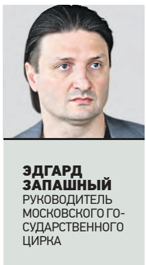
ЗДГАРД ЗАПАШНЫЙ руководитель Московского государственного цирка

Давайте отделим мух от котлет. В юриспруденции нет понятия «лить грязь на Россию». Поэтому, я думаю, конфисковывать имущество нужно только у тех, кто уже признан виновным по уголовным делам о дискредитации Вооруженных сил РФ, экстремизме или, скажем, реабилитации нацизма. Если приговор по делу — имущество конфискуется. Но только, разумеется, по решению суда. Закон и еще раз закон, потому что мы цивилизованные люди. При этом, на мой взгляд, нужно создать и другой, куда более важный, юридический механизм — лишения наград. Вот, например, Борис Гребенщиков награжден орденом «За заслуги перед Отечеством». Но судя по его действиям, Отечество у него уже другое — нацистское государство Украина. Вот пусть оно Гребенщикова и награждает, а российского ордена его нужно лишить. Или взять Максима Галкина. Его в свое время наградили орденом Дружбы. И он да, сейчас успешно дружит с врагами нашей страны и крайне негативно о ней высказывается. Так не пора ли его ордена лишить? Или вот есть еще Макаревич*. Народный, между прочим, артист. Вот что он сказал о россиянах: «Этот народ уже не спа-