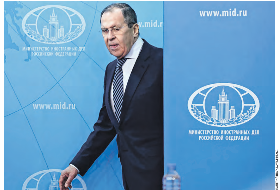
18 января 11:09 Министр иностранных дел России Сергей Лавров на пресс-конференции, посвященной итогам 2022 года

Вчера министр иностранных дел России Сергей Лавров заявил, что Запад ведет против России войну не гибридную, а уже почти настоящую.