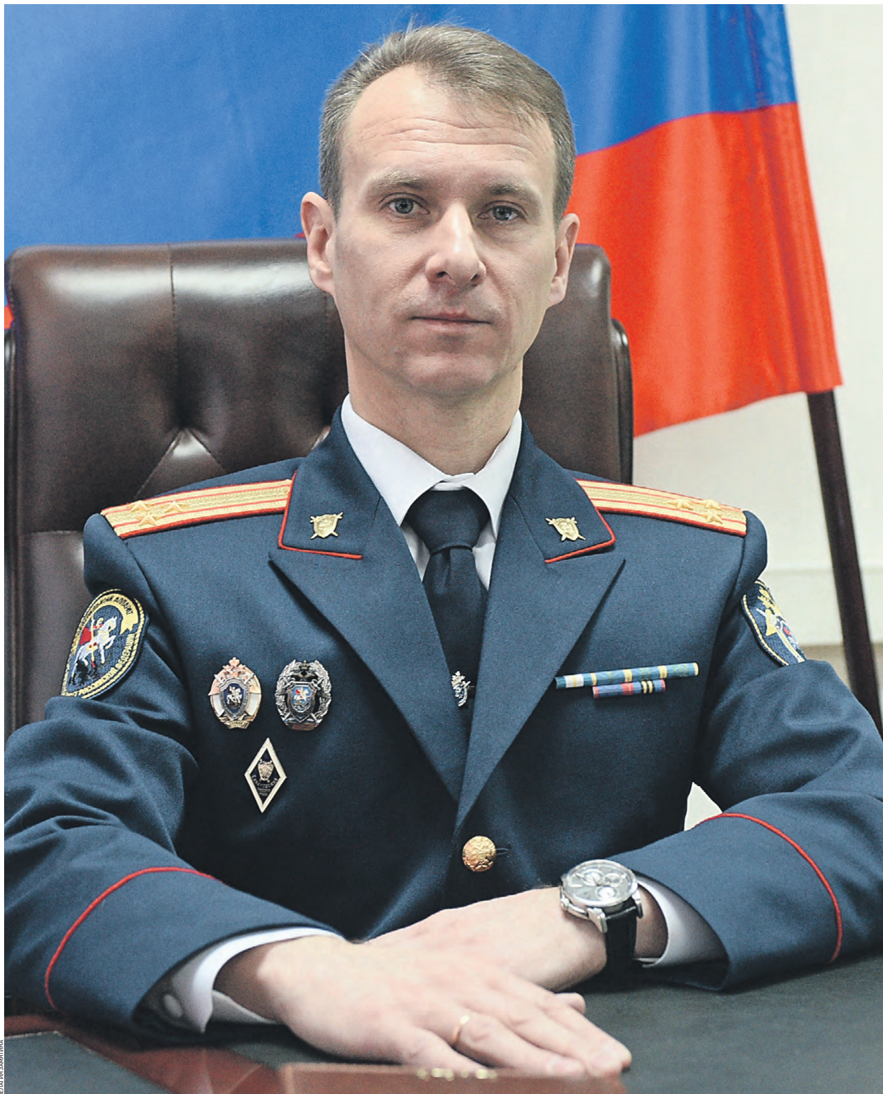
12 января 2023 года. Ректор Московской академии Следственного комитета России Алексей Бессонов в своем кабинете

Современное поколение следователей — это, с одной стороны, — сплав мудрости и опыта, а с другой — неудержимой энергии и максимализма, стремления к новым достижениям. Во многом это связано с изменениями, которые в нашу жизнь внесли современные технологии и цифровизация. Сегодня иногда очень сложно разделить, где заканчивается реальный мир и начинается виртуальный. Свойственные новому поколению молодежи стремление к самообразованию, самостоятельность в выборе и достижении жизненных ориентиров, оперирование большими объемами информации при помощи современных технических средств, новых технологий и программных продуктов находят применение и в следственной работе. Но хочу подчеркнуть, что одним из основополагающих принципов нашей работы