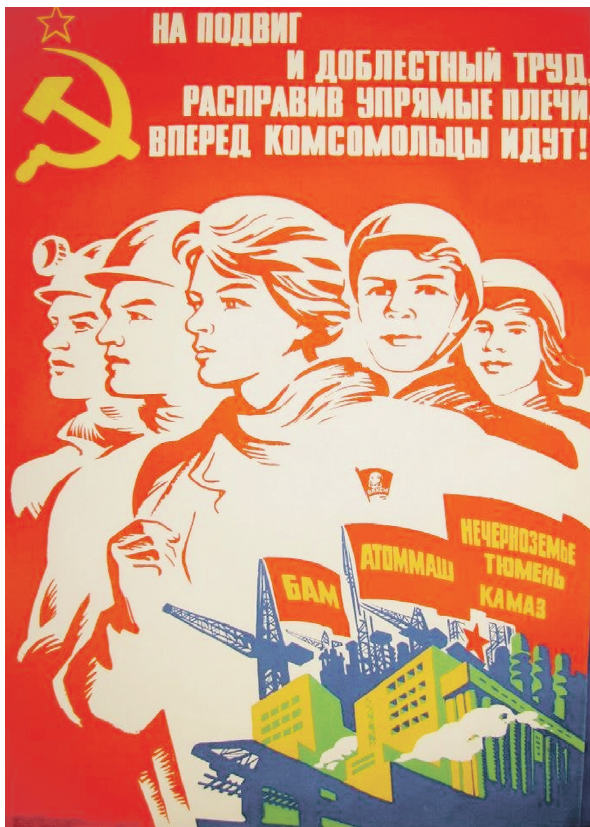
Советский «воспитательный» плакат 1978 года работы художника Георгия Гаусмана. Этический кодекс нации в советское время заменяли собой социалистические «заповеди», утратившие после распада СССР свою актуальность

Обогащение — нормальное свойство человека работающего, а не бездельника и тунеядца.