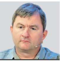
АЛЕКСАНДР НИКОНОВ ОБОЗРЕВАТЕЛЬ

Это я слышал от депутата одного. Про воспитание: мол, раньше-то государство детьми занималось и оттого путеводная звезда красной морали вовсю сияла и манила... И вот тут он соврал! Меня всегда поражала слепая вера людей в галстуках в то, что бюрократический аппарат хоть как-то может поучаствовать в воспитании подрастающего поколения с помощью канцелярских потоков — идущих снизу отчетов и спущенных сверху указов. Нет в принципе он может, конечно, повлиять, но только в сторону, противоположную от задуманной — вызвать стойкое отторжение ко всякого рода смотрам строя и песни. Я из того поколения, у которого в результате мощной прививки госпропаганды возник стойкий иммунитет к идущей сверху аппаратной казенщине. Сейчас эта казенщина отчасти возрождается. Но поскольку нет обязательной идеологии, дело воспитания отдают в частные руки родителей — как это было на протяжении десятиков тысяч лет. Как это есть у животных.