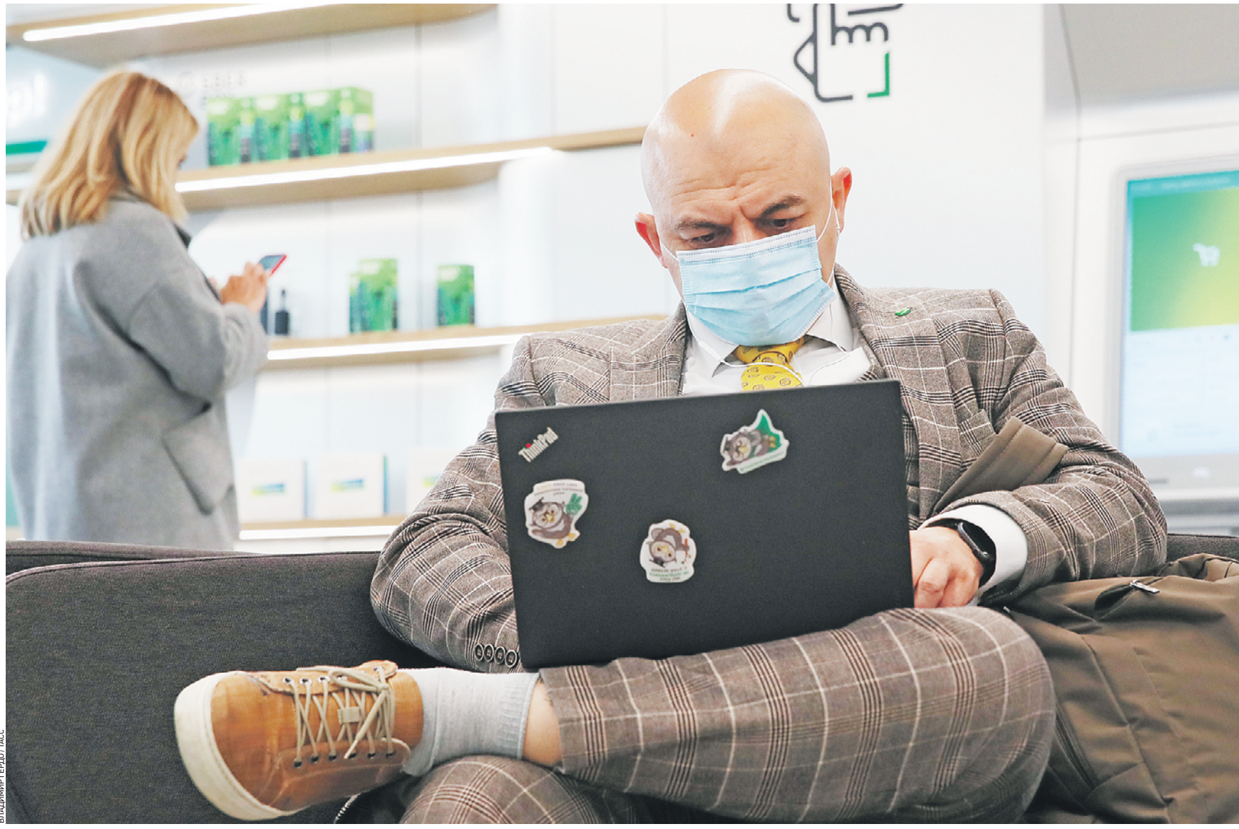
28 сентября 2020 года. Открытие в Москве, на Цветном бульваре, отделения банка нового формата. Здесь можно открыть и индивидуальный инвестиционный счет