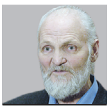
ВЛАДИМИР КРУПИН ЛАУРЕАТ ПАТРИАРШЕЙ ПРЕМИИ ПО ЛИТЕРАТУРЕ

Когда заходит разговор о воспитании гражданина, первым делом приходит на ум времена советской власти. То, чем руководствовались в эпоху Брежнев, фактически не содержало уже никакой политизации. Ранние большевики еще держались на марксистской риторике, а поздние коммунисты от нее начали отходить. В основе идеала поведения советского человека были те же истины, что и в христианском учении: не убивай, не кради, не лги. Гражданин призывали любить Родину. В СССР были все-таки были хорошие начинания, от которых нам не стоило бы отказываться. Например, детская пионерская организация. Я в юности не раз был вожатым в лагерь и помню, что мы все время были заняты каким-то делом, а не как нынешняя молодежь, которая часто не понимает, куда себя деть. «Нам работа помогает отдыхать» — такой у нас был лозунг. Но так было не только у пионеров. Когда я сегодня встречаюсь с детьми, школьниками, то я привожу им в пример семью последнего императора — царя-статотерпа Николая II. «Хотите увидеть ангелов, — говорю я им, — посмотрите на фото детей Александры Федоровны». Она с дочерьми работала в госпи-