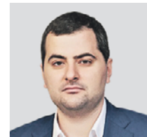
ВЛАДИСЛАВ ОВЧИНСКИЙ НАЧАЛЬНИК ГОСИНСПЕКЦИИ ПО НЕДВИЖИМОСТИ ЗА ИСПОЛЬЗОВАНИЕм ОБЪЕКТОВ НЕДВИЖИМОСТИ МОСКВЫ

В результате въезд на стоянку для местных жителей снова оказался свободным. Вот так этот проект работает на практике.