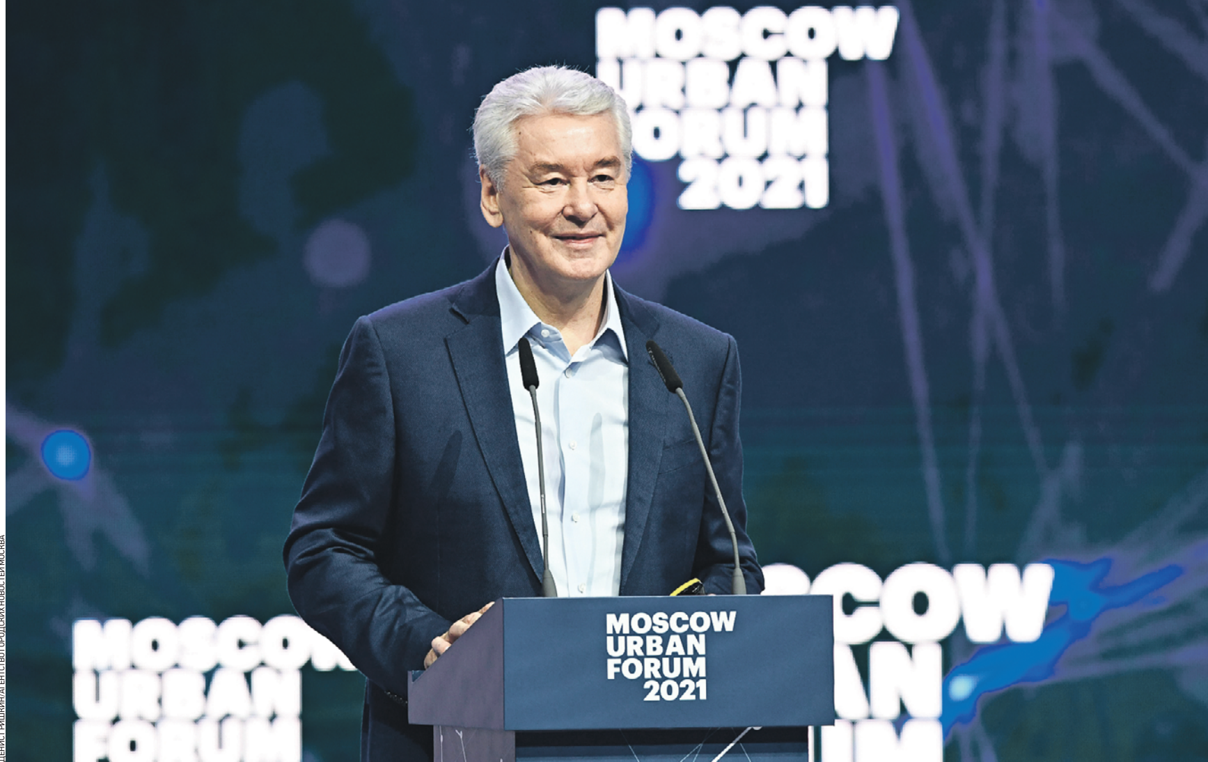
1 июля 10:36 Мэр Москвы Сергей Собянин во время выступления на открытии Московского урбанистического форума, который в этом году проходил в Концертном зале «Зарядье». Участниками этого масштабного мероприятия стали сотни экспертов со всего мира

Важнейшей частью форума стал международный конгресс Urban Health, в рамках которого было организовано 16 мероприятий — на них выступили 78 спикеров из 18 стран. Участники конгресса обсуждали эффективные решения по борьбе с распространением COVID-19. Кроме того, на выставке были представлены ключевые проекты развития Москвы. На стендах проходили деловые встречи, подписание соглашений и другие мероприятия, которые в том числе транслировались онлайн. В частности, правительство Москвы заключило с ПАО «КАМАЗ» и компанией «РОСНАНО» о-