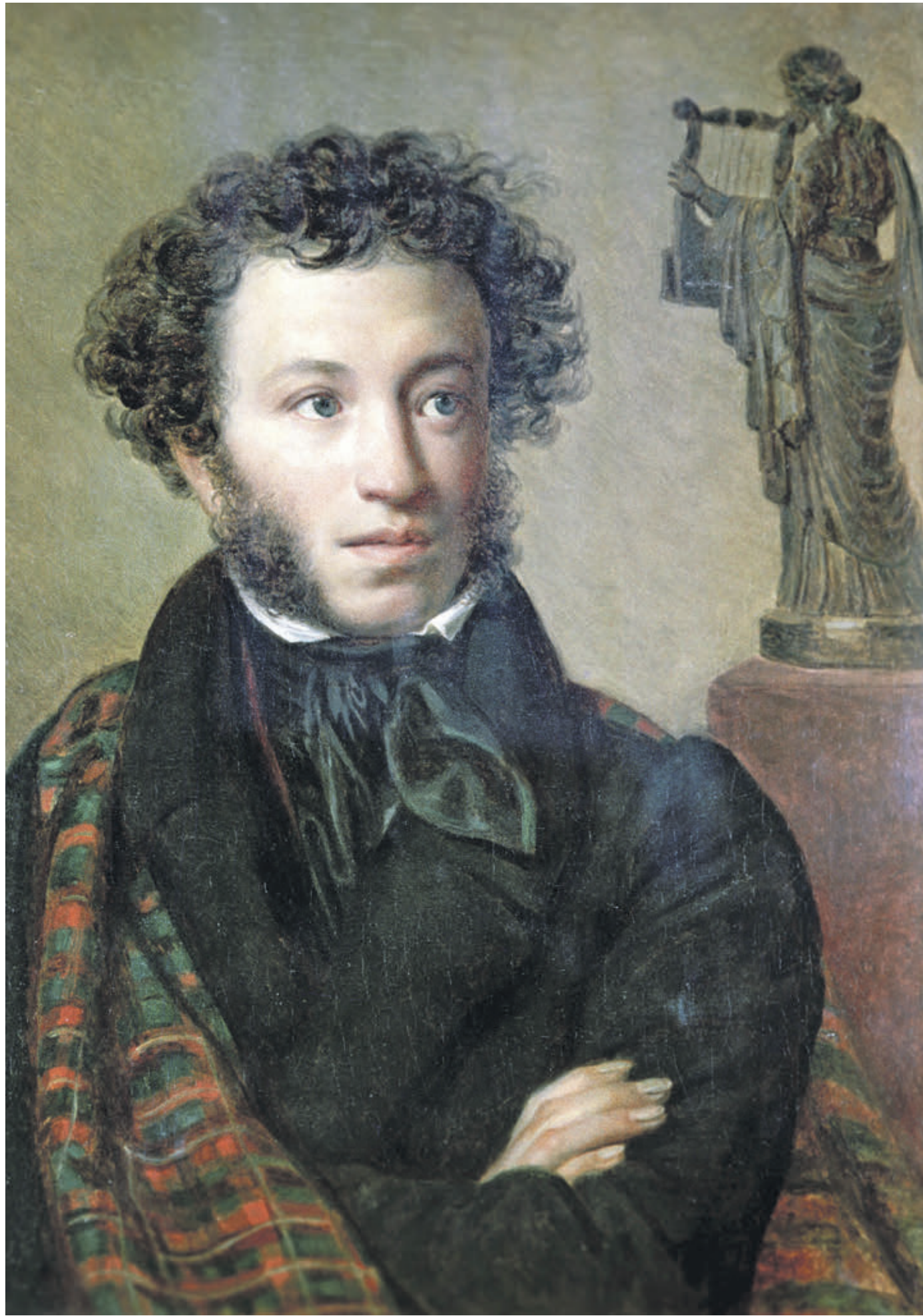
Портрет Александра Пушкина кисти Ореста Кипренского, 1827 год

Мнения колумнистов могут не совпадать с точной зрения редакции «Вечерней Москвы»