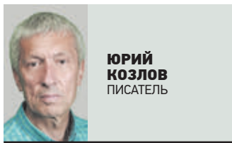
ЮРИЙ КОЗЛОВ ПИСАТЕЛЬ

Ф илософы Рима считали, что люди должны понуждаться к добродетели. Точно так же они должны понуждаться к культуре. В каждую эпоху эта проблема решается по-разному. Иногда новая культура растет на фундаменте прежней, иногда самоутверждается на ее обломках. Ранняя советская культура была воинственно враждебна буржуазной культуре царской России. В отвал ушли не только сброшенные с корабля современности Пушкин, но и классическая русская живопись, музыка, скульптура, архитектура, философия. До середины тридцатых годов советская культура существовала как «вещь в себе», эксплуатировавшая революционный пафос воставших против вековой несправедливости масс, выдавая шедевры типа «Броненосца «Потемкин» Эйзенштейна и поэм Маяковского. Ранняя советская культура была полна пафоса переустройства мира, но была лишена национального содержания. Это была культура изначально утопическая, ощутую выходящая на некие смутные всемирные идеалы всеобщего равенства, братства и счастья, которые противоречиво сочетались с жестокостями кровавой классовой борьбы.