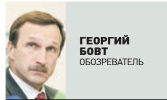
ГЕОРГИЙ БОБТ ОБЪЕДИТЕЛЬ

Логика законопроекта, на первый взгляд, проста. После отмены первоначальных условий пенсионной реформы, которая сильно не понравилась людям, пошли на смягчение. В частности, оно состояло в том, что появилась категория так называемых предпенсионеров. Это те, кто «по-старому» мог бы уже уйти на пенсию, но «по-новому» должен работать дольше. Если не инвалид. Для этой категории работников предусмотрели определенные гарантии от увольнения. А главное — сохранили за ними все те льготы, которые они могли бы потерять. Тут, впрочем, логика кончается, и начинается сплошная популизм. Он состоит в том, что предпенсионерам предъявляют очередную «поблажку» и как бы говорят: реформа не так страшна, у вас будет все то же самое, только работать надо будет чуть-чуть подольше. Ведь нас в прошлом году вовсю убеждали, что люди 55–60 лет вполне энергичны и могут спокойно трудиться еще несколько лет. То есть получается, что работать такой человек (предпенсионер) в состоянии, но может оказаться так, что он не в силах будет себя содержать. И пойдет подавать в суд на работодателя.