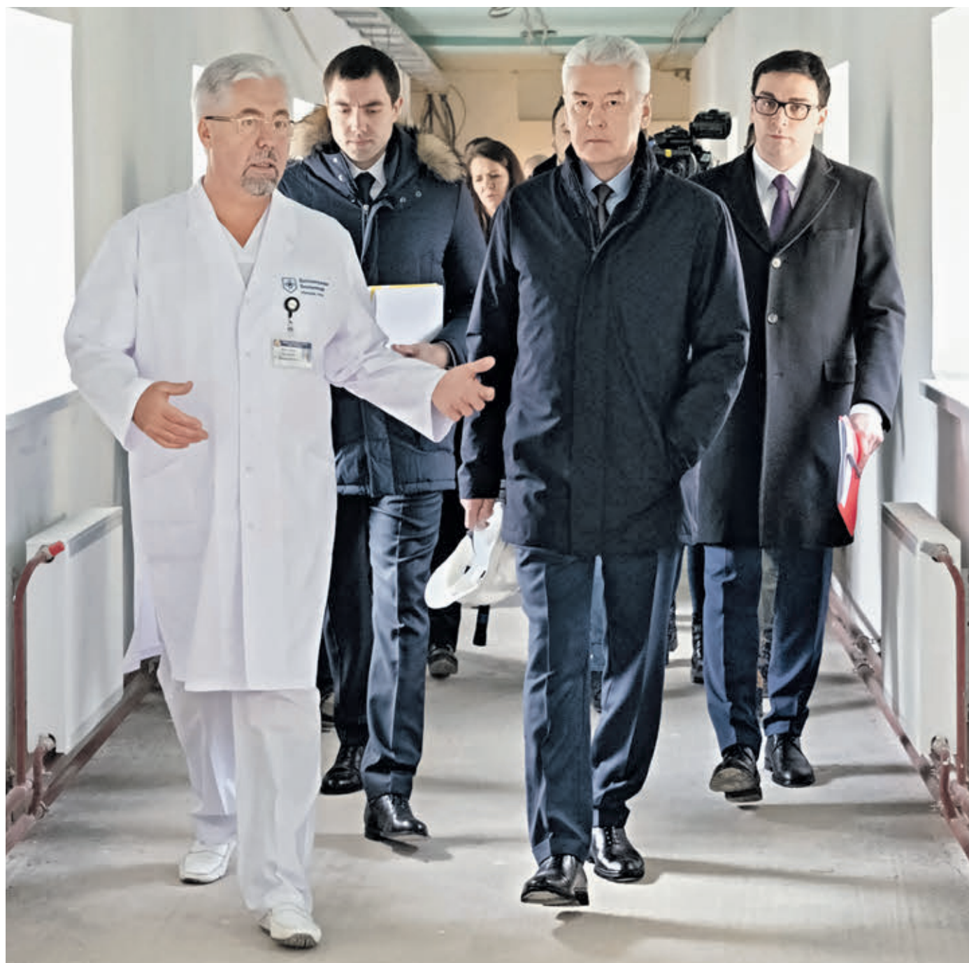
Вчера 12:34 Мэр Москвы Сергей Собянин (справа) прошел по коридорам исторического корпуса Боткинской больницы. Главврач медучреждения Алексей Шабунин рассказал главе города, что после ремонта здесь заработает нефрологический центр

— В целом все корпуса больницы будут в надлежащем, современном состоянии, — сказал Сергей Собянин, подчеркнув, что Боткинская больница — самая крупная в Москве. Ежегодно здесь проходит лечение более 100 тысяч человек. При этом в консультативно-диагностический центр клиники обращается в восемь раз больше людей, или каждый 25-й пациент в Москве. — В больнице работает опытный квалифицированный персонал, — добавил Собянин. — По большому счету,