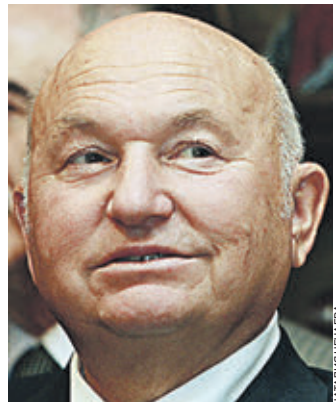
Собянин. — Соболезную родным и близким. Юрий Лужков руководил столицей с июня 1992 года по сентябрь 2010 года. Он стал вторым мэром Москвы после Гавриила Попова.

Вчера ушел из жизни бывший мэр Москвы Юрий Лужков (на фото). Ему было 83 года.