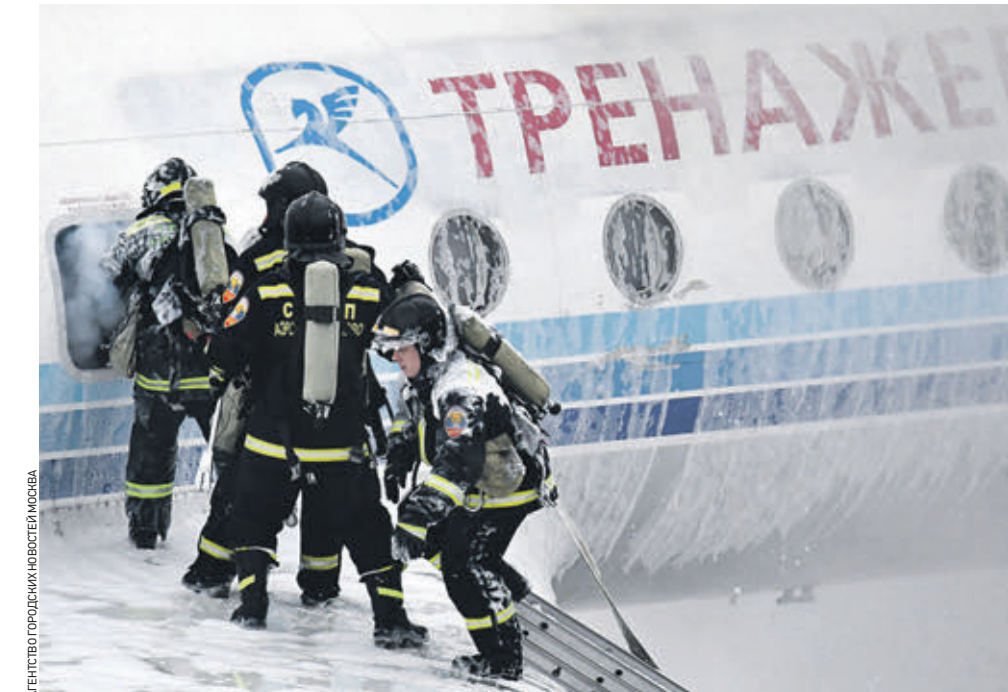
Вчера 13:42 В аэропорту Внуково прошли плановые учения Службы поискового и аварийно-спасательного обеспечения полетов (СПАСОП). На импровизированное учебное возгорание отправились сразу несколько пожарных автомобилей. По прибытии сотрудники приступили к оперативным действиям. На фото видно, как спасатели обрабатывают порядок действий во время тушения кабины самолета. Из салона специалисты вытаскивали условных пострадавших, после чего передали их в руки медицинских работников. Тушили фюзеляж лайнера из нескольких пожарных шлангов. Поставленные задачи были выполнены.