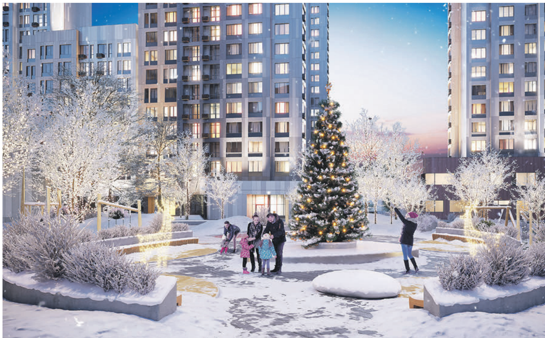
Проект жилого квартала «Преображение» предусматривает строительство детского сада, медицинского центра, универсальных спортивных площадок, велосипедных дорожек, а также обустройство комфортных придомовых зеленых зон для отдыха

— Приступая к работе над тем или иным проектом, мы всегда оцениваем планы по развитию транспортной системы всего Московского региона, — говорит президент