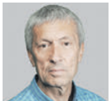
ЮРИ КОЗЛОВ ПИСАТЕЛЬ

Александра Солженицына обвиняли во многих грехах, но никто и никогда не обвинял его в отсутствии мужества. К Солженицыну вполне применимы слова одного из героев Достоевского: если и замахиваться на что-то, то только на большое, на мелкое, ничтожное — только руку «отмахать».