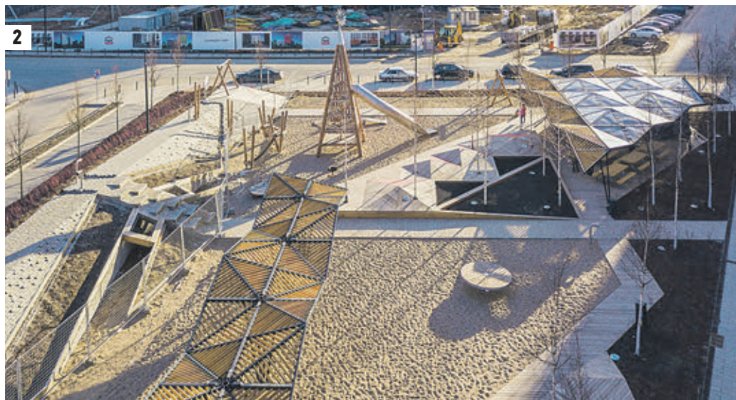
22 мая 2019 года 11:45 Площадка «Оригами» в микрорайоне «Саларьево парк» оборудована навесом, качелями (1) и различными приспособлениями для игр (2)

В сентябре этого года детский сад в составе ВОК уже принял первых воспитанников. Здесь есть все необходимое для комфортного и безопасного пребывания. Даже интерьеры способствуют гармоничному развитию детей: одна из стен превратилась в интерактивное панно с огромными шестеренками. Вращая их, ребята знакомятся с принципами работы механизмов. Впрочем, узнать новое и даже почувствовать себя первооткрывателями дети могут и за пределами образовательных учреждений. Так, в «Бунинских лугах» ПИК впервые представил необычную игровую площадку PlayHub «Пирамиды». Главный принцип, которым руководствовались при создании, — играть и учиться. Своё название площадка получила