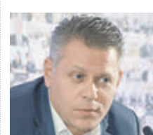
ВАДИМ ПРАСОВ ВИЦЕ-ПРЕЗИДЕНТ ФЕДЕРАЦИИ РЕСТОРАТОРОВ И ОТЕЛЕЙЕРОВ

ощущаем на себе изменение стоимости товаров и услуг во всех отраслях. Не думаю, что цены вырастут катастрофически. Главное, чтобы не изменилась программа по дотациям на перелеты в дальние регионы внутри страны. Это самое существенное, что может повлиять на рост цен. Величина повышения стоимости перевозок зависит от инфляции, ставок банков, но это не основной фактор. Туроператоры, которые формируют пакетные туры, пользуются услугами авиакомпании-партнера, которые регламентируют или индексируют стоимость билетов, чтобы максимально не допускать их рост. Повышение цен затронет именно тех, кто покупает билеты напрямую у перевозчиков. Могут сказать, что поток туристов за рубеж из-за этого не сократится — состоятельные клиенты продолжают пользоваться авиасообщением, а люди со средним достатком будут использовать другие виды транспорта.