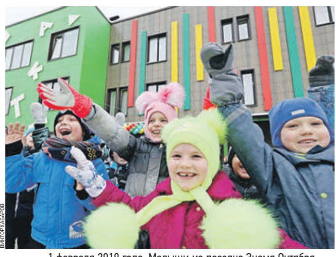
1 февраля 2019 года. Малыши из поселка Знамя Октября на открытии нового детского сада

и лицам с ограниченными физическими возможностями. Кроме того, более шести тысяч жителей ТиНАО старшего возраста являются участниками программы «Московское долголетие», — уточнили в департаменте, добавив, что и в последующие годы запланировано открытие подобных центров. Напомним, что 1 июля 2012 года к Москве присоединили часть юго-западных территорий Московской области. Их площадь составила 148 тысяч гектаров. Благодаря этому территория столицы увеличилась почти в два с половиной раза. С 2012 года в Новую Москву инвестировано 1,4 триллиона рублей, причем триллион из этого составляют внебюджетные средства. Ожидается, что до 2035 года объем инвестиций достигнет семи триллионов рублей.