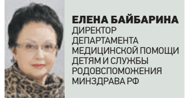
ЕЛЕНА БАЙБАРИНА ДИРЕКТОР ДЕПАРТАМЕНТА МЕДИЦИНСКОЙ ПОМОЩИ ДЕТЯМ И СЛУЖБЫ РОДОВСПОМОЖЕНИЯ МИНЗДРАВА РФ