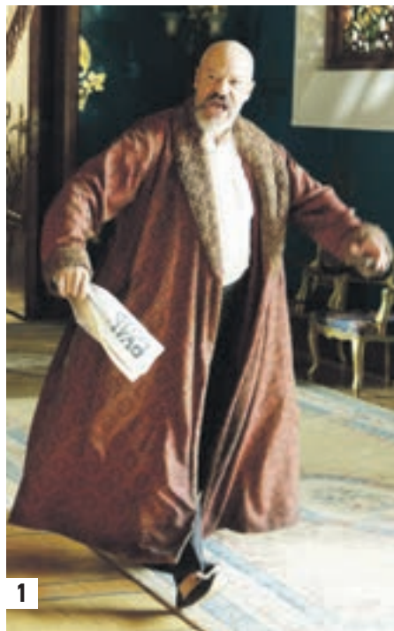
1 Два облина Александра Парвуса: человек-харизма в исполнении Федора Бондарчука («Демон революции») (1) и циничный бизнесмен («Троцкий»), сыгранный Михаилом Пореченковым (2)

Но надо ли нам знать эти детали? Да, в первую очередь потому, что история имеет тенденцию к повторению. Например, на круглом столе досталось либералам той поры. Как много знакомого в их коллективном «портрете», нарисованном политологом Дмитрием Журавлевым: — Они долго рвались к власти, но когда получили ее, поняли, что теперь надо заниматься делом, чего не умели в принципе. Начав реформы, либералы разваливали все насмерть: от госуправления до армии, а разогнав «ужасную царскую» полицию, не предложили взамен ничего, что удивляло и радовало уголовников. Вот они — параллели... Помните: «Слово честное есть дело», лозунг наших 80-х? Но магия пустословия не может быть долгой. И это стало ясно довольно быстро, уже к Октябрю, когда для населения, по словам Журавлева, стала приземлем любая группа людей, готовая взять на себя власть и хоть какую-то ответственность за это. Так Ленин, Парвус, Троцкий или кто-то еще? Или... что-то? Никто из экспертов не отрицает значения этих фигур. Разве что Парвус, вдруг оказавшийся активной исторической единицей, вызывает вопросы. Но историк Олег Яхшин искренне недоумевает: отчего же нигде нет и намека на роль во всей этой истории «крестьянского вопроса»? — Ленин отлично сработал на своем понимании кре-