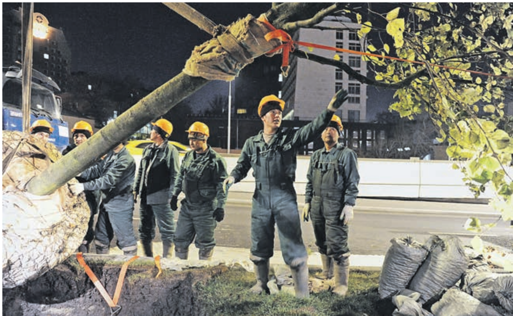
9 сентября 00:18 Садовое кольцо. Работники подрядной организации, занимающейся высадкой деревьев в столице, устанавливают липу в заранее подготовленную лунку. Теперь подрядчик обязан ухаживать за ней в течение трех ближайших лет, и если дерево не приживется — заменить за свой счет