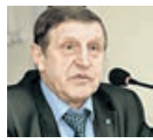
АНАТОЛИЙ ЗАХАРЕНКОВ ГЛАВНЫЙ ТЕХНИЧЕСКИЙ ДИРЕКТОР МЕЖДУНАРОДНОЙ ФЕДЕРАЦИИ ПРОФСОЮЗОВ

и предложениям. Тем более в такой консервативной отрасли, как трудовое законодательство. На мой взгляд, новый фонд способен создать подушку безопасности для тех, кто трудится в компаниях с ненадежной экономической ситуацией. Людям нужны определенные гарантии выплат — и такой фонд способен подобные гарантии дать.