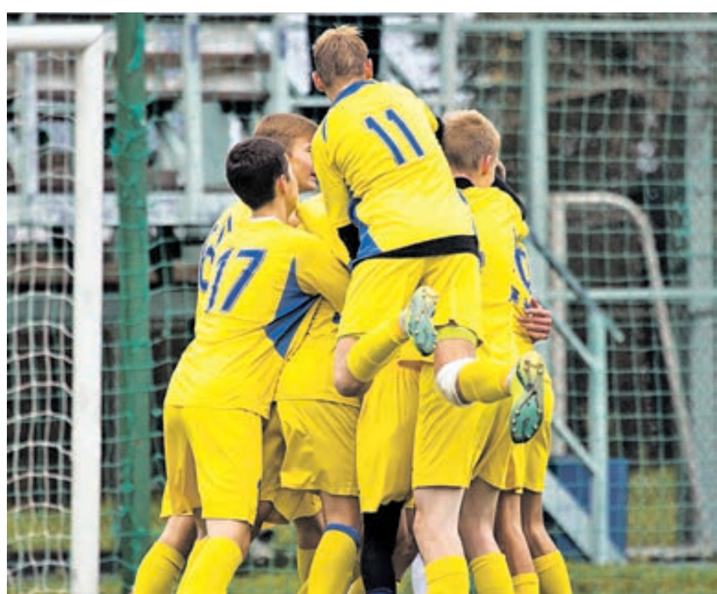
Юные игроки футбольного клуба «Строгино» радуются забитому голу

Сентября 2011 года спортивная школа входит в состав ГБУ ФК «Строгино» Москомспорта. Благодаря этому удалось организовать более качественный тренировочный процесс и создать дополнительные возможности для роста юных спортсменов. Был расширен диапазон спортивных дисциплин, которыми ребята могут заниматься в спортивной школе, в двух отделениях — «Строгино» и «Строгино-2». Занятия проводят более 30 высококвалифицированных тренеров, в том числе имеющих лицензию А-УЕФА, среди них есть заслуженный мастер спорта и мастера спорта международного класса. Тренеры работают по единой методике, постоянно совершенствуя свои знания, обращают внимание на развитие игрока — как на поле, так и вне его. «Строгино» выступает в первенстве среди профессиональных команд, а «Строгино-2» — в первенствах Москвы и России среди своих сверстников, чтобы, повзрослев, пополнить профессиональную команду клуба. Первая — играет в Клубной лиге наряду с «Динамо», «Спартаком», ЦСКА, «Чертаново», «Локомотивом» и другими сильнейшими футбольными школами и академиями Москвы. Вторая — представляет клуб в Премьер-группе, во втором по силе и престижу первенстве России — зоне «Москва». Обе команды име-