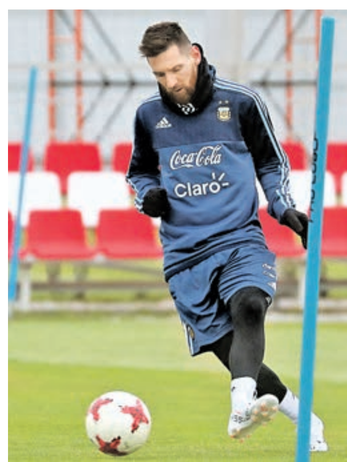
7 ноября. Лионель Месси во время тренировки перед товарищеским матчем со сборной России

В последнее время москвичи с особым удовольствием посещают матчи футбольной сборной России, которая готовится к главному турниру четырехлетия. На предыдущий матч в Москве, который сборная России провела на стадионе «ВЭБ Арена» против команды Южной Кореи, пришли почти 25 тысяч зрителей. В 2017 году команда Станислава Черчесова сыграет еще два контрольных матча — 11 ноября против Аргентины в «Лужниках» и через три дня в Санкт-Петербурге против сборной Испании. — Рассчитываю, что встречи с такими сильными соперни-