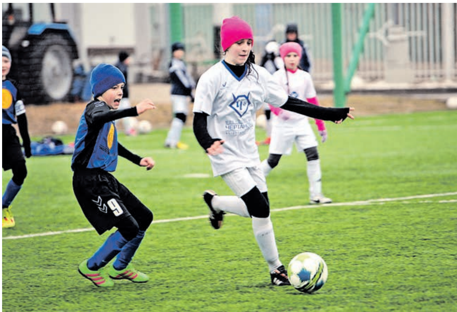
3 апреля. Тренировка воспитанников спортивной школы «Чертаново»