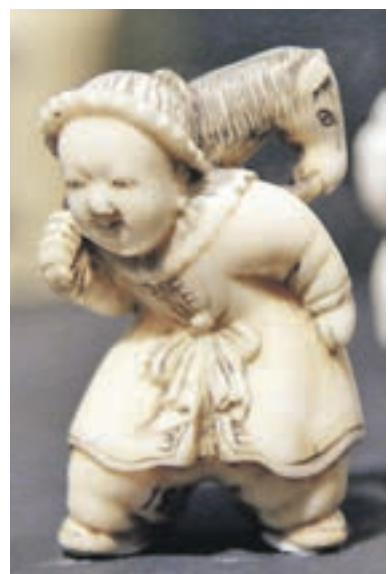
Вчера 16:57 Фигурки нэцке, сделанные японскими мастерами XIX века, из коллекции Государственного музея Востока

17:12 Маленькие фигурки, вырезанные из слоновой кости или дерева, называются смешным словом нэцке. В Государственном музее Востока открылась выставка таких скульптурок. Часть из них — из коллекции древностей музея. В экспозиции представлены и современные работы, сделанные мастерами из России, стран СНГ и Европы. К японскому искусству прибегнул корреспондент «ВМ».