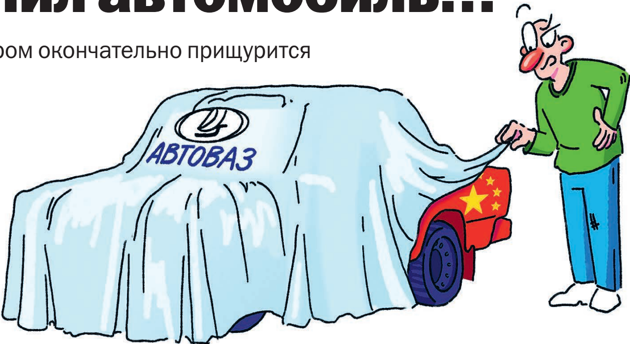
ИЛЛЮСТРАЦИЯ НАСТАСИ КОВАЛЕВОЙ

месте в мире находится Россия по наличию авто на душу населения: 315 легковушек на тысячу жителей. Для сравнения: в Германии – 590, в Финляндии – 666, в США – 772