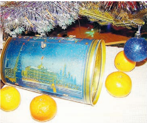
До 1965 года баульчики с гостинцами были жестяные, а потом пришла пластмасса.

куда больше: в Тайницком саду Кремля. На фото спецкора ТАСС Василия Егорова – новогодние гулянья как раз в этом саду 3 января 1961 года. Для современного читателя праздничные гулянья в Тайницком саду ничем не отличаются от таких же в Нескучном или, скажем, в Сокольниках. Но, по словам моей мамы, для нее и для отца, родившихся, когда свободный доступ в Кремль был уже закрыт, это событие стало знакомым. Тем более что семья жила недалеко, на Волхонке, и все происходило на их глазах. Так что в 1960-х новогодние гулянья в Кремле не обходились без нас, как и елочные базары в декабре в Александровском саду.