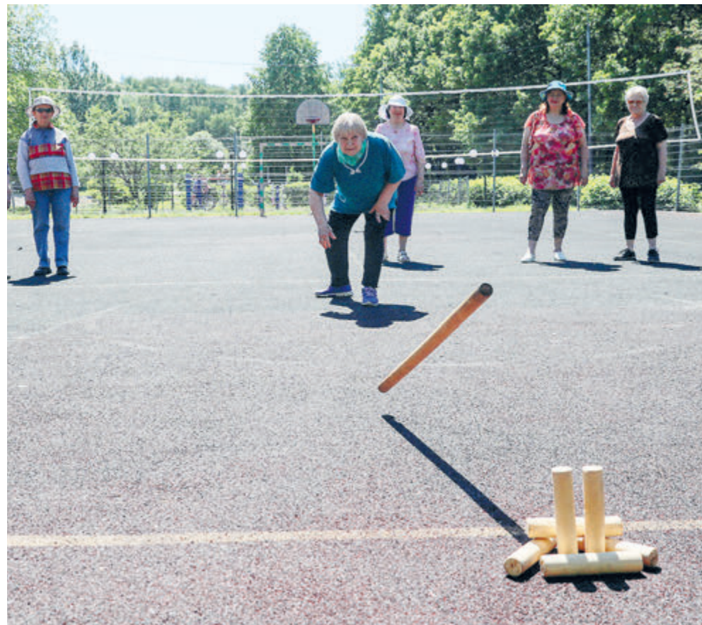
Во всем так весело в старости.

При этом большая часть декларируемых государством льгот и бесплатных услуг для инвалидов существуют лишь на бумаге. «На все наши обращения с просьбой повысить пособие по уходу хотя бы до размера МРОТ Минтруд отвечает, что это нецелесообраз-