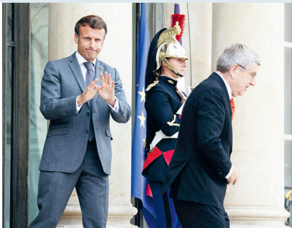
Эммануэль Макрон и Томас Бах смягчают тональность.

– И Макрон, и Томас Бах заинтересованы в том, чтобы Олимпиада в Париже было полноценная по части и атлетов, и туристов-болельщиков. Но даже при