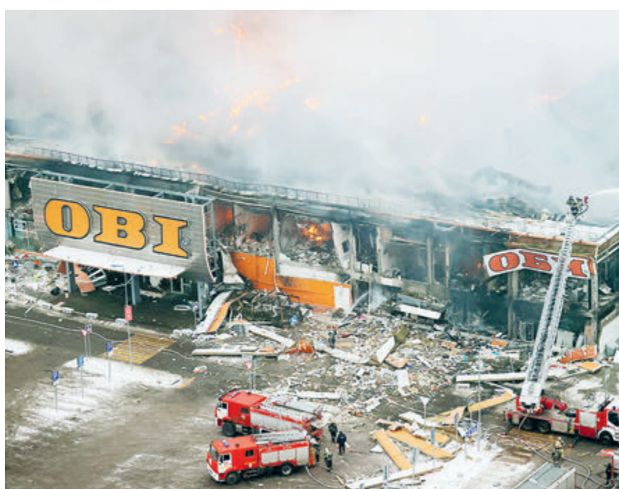
Вывеска – единственное, что осталось.

Однако все эти масштабы перекрыли магазин ОВІ в торговом центре «Мега Химки», загоревшийся рано утром в пятницу, 9 декабря, и строительный гипермаркет «Стройпарк» в Балашихе, который вспыхнул