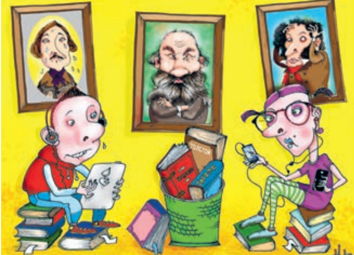
ИЛЛЮСТРАЦИЯ ОРИНА НАМЕСТИННИКОВА, CARTOONBANK.RU

«Труд» опросил родителей, учителей и психологов и выяснил, что далеко не все считают правильными запретительные инициативы. Ведь сегодняшние школьники вырастают в новую цифровую эпоху, они научились искать информа-