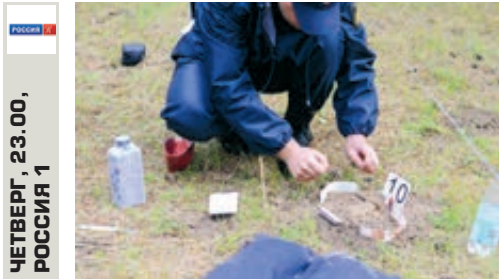
ЧЕТВЕРГ, 23.00, РОССИЯ 1

Они – герои детективных романов и остросюжетных фильмов. Самы следователи только ублажаются, глядя на своих экранных коллег. Как на самом деле раскрываются преступления? Кто ищет следы на месте происшествия и проводит экспертизы? Как были раскрыты громкие дела последних лет и для чего криминалисты изучают материалы, давно сданные в архив?