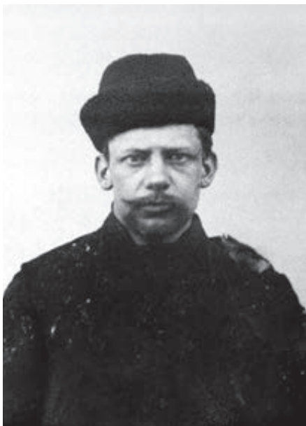
Великая княгиня Елизавета Федоровна и террорист Иван Калаяев были казнены. Этим сходство в их судьбах исчерпывается.

Джунковский, адъютант и друг великого князя Сергея.