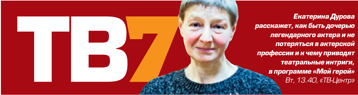
Екатерина Дурова расскажет, как быть дочерью легендарного актера и не потеряться в актерской профессии и к чему приводят театральные интриги, в программе «Мой герой» Вт, 13.40, «ТВ-Центр»