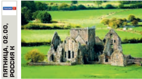
ПЯТНИЦА, 02.00, РОССИЯ К

Они – герои детективных романов и остросюжетных фильмов. Самы следователи только ублажаются, глядя на своих экранных коллег. Как на самом деле раскрываются преступления? Кто ищет следы на месте происшествия и проводит экспертизы? Как были раскрыты громкие дела последних лет и для чего криминалисты изучают материалы, давно сданные в архив?