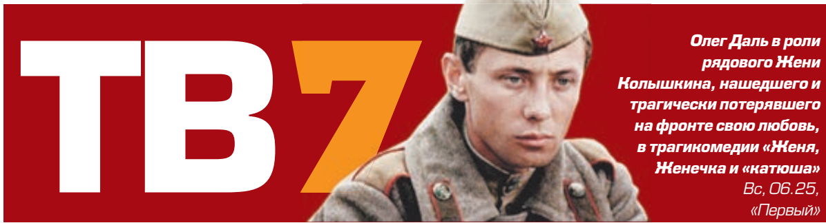
Олег Даль в роли рядового Жени Кольшикина, нашедшего и трагически потерявшего на фронте свою любовь, в трагикомедии «Женя, Женечка и «Катюша» Вс, 06.25, «Первый»