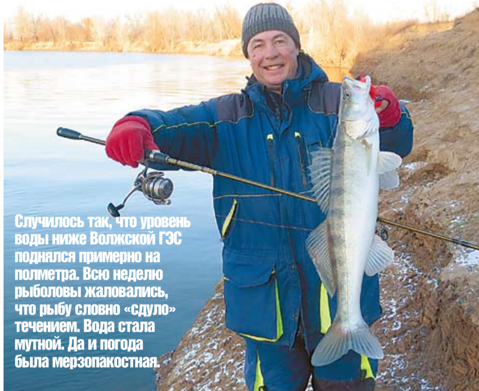
Случилось так, что уровень воды ниже Волжской ГЭС поднялся примерно на полметра. Всю неделю рыболовы жаловались, что рыбу словно «сдуло» течением. Вода стала мутной. Да и погода была мерзопакостная.