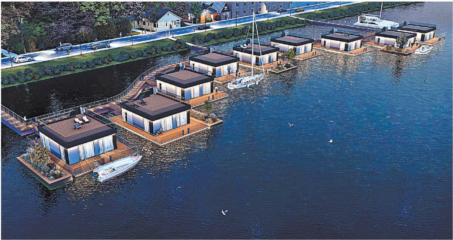
Так должен был выглядеть квартал плавучих домов в Галерной гавани Васильевского острова по проекту.

Других подробностей пока не приводится. Напомним, в исправительной колонии строгого режима, расположенной на окраине города Суровикино, четыре радикала напали на сотрудников колонии, убили несколько человек и захватили заложников. В итоге все радикалы были уничтожены. ●