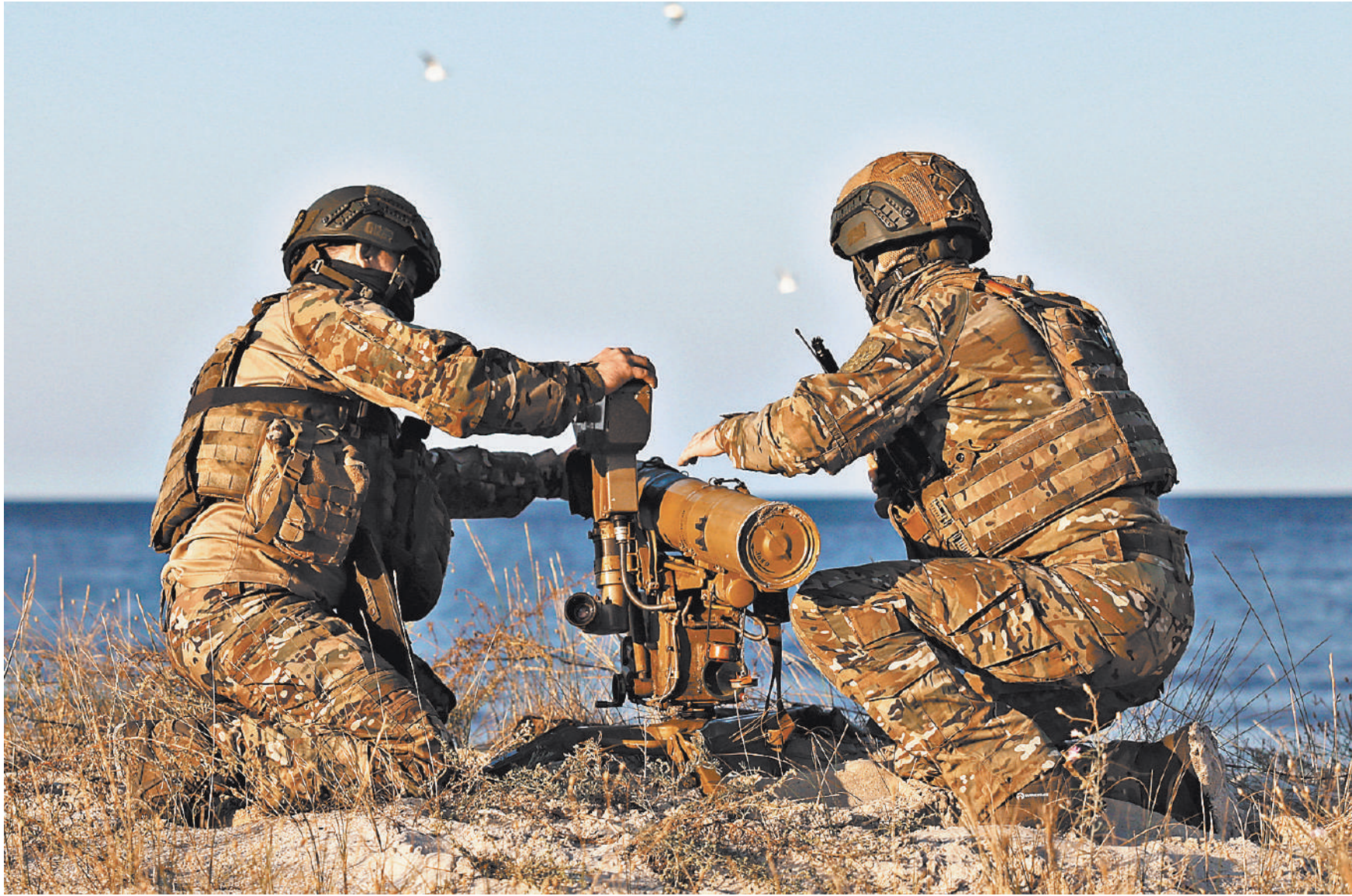
Противотанковые расчеты артиллерийского соединения ВДВ группировки войск «Днепр» не дали высадиться диверсионно-разведывательной группе ВСУ на побережье Кинбурнской косы.