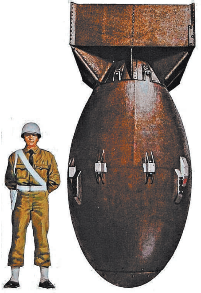
Примерно так выглядел аналог РДС-1 — американская бомба с кодовым названием «Толстяк» — 9 августа 1945 года сброшена на город Нагасаки.

Как в условиях послевоенной разрухи советским специалистам удалось за четыре года преодолеть монополию США на ядерное оружие? А спустя еще четыре — первыми испытать полноценный вариант водородной бомбы? Кто выбирал место для испытаний первой в СССР атомной бомбы и почему называли Горной станцией то, что