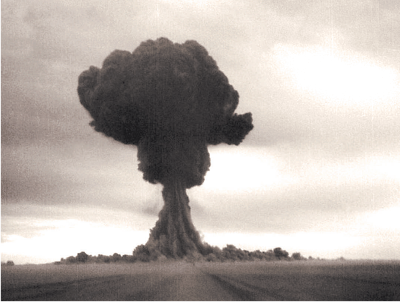
«Грибной» сезон, открытый летом 45-го в Аламогордо, продолжили в Неваде, под Семипалатинском, на Моруоро и в других местах ядерных испытаний.

против двух — таким было соотношение ядерных арсеналов США и СССР к началу 1950 года