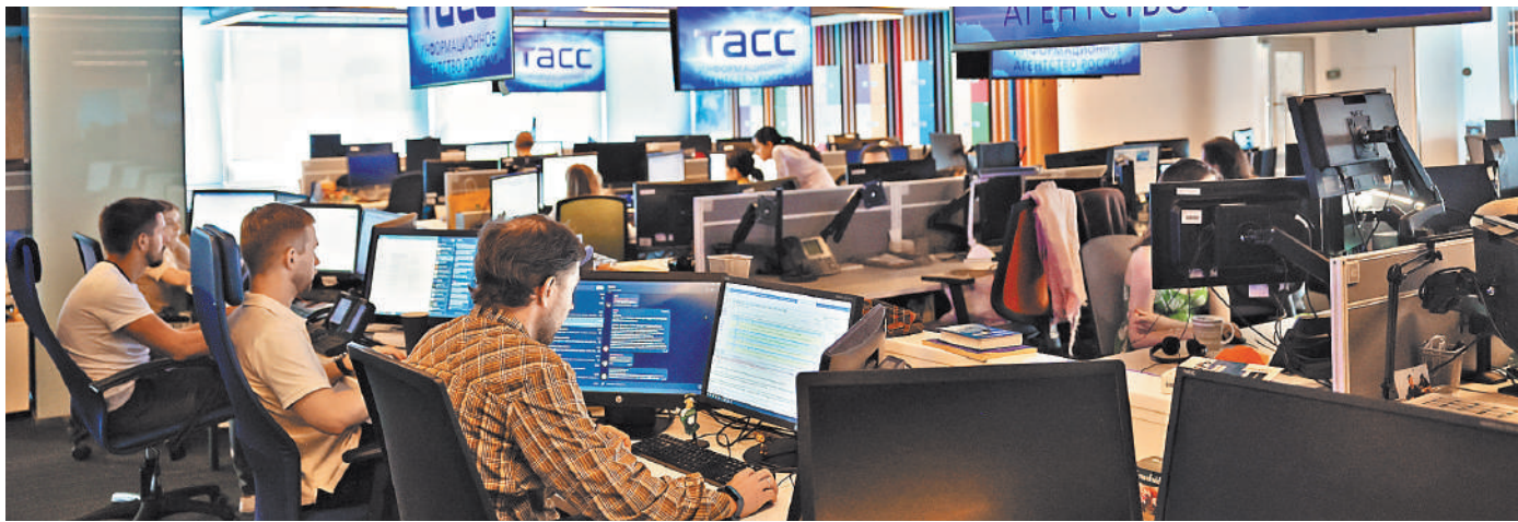
ТАСС держится потому, что традиционно существует как огромная семья. Сейчас здесь работают более 1700 человек.