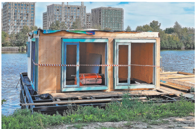
21.08.2024 г. от стройки в Галерной гавани почти ничего не осталось.

В апреле транспортная прокуратура начала проверку исполнения законодательства о безопасности судоходства в связи с возможным строительством плавучих домов в Галерной гавани.