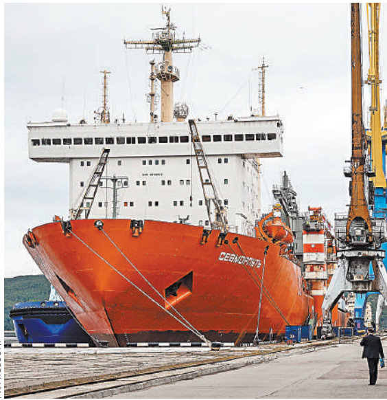
Значимость Севморпути для экономики России как национальной транспортной магистрали возросла многократно.

Северный морской путь обеспечивает свободный выход в Мировой океан, к странам Юго-Восточной Азии, Индии, Персидского залива и Африки, с которыми продолжают развиваться торговые связи. Поэтому значимость Севморпути для экономики России как национальной транспортной магистрали возросла многократно.