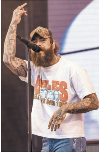
Кажется, Post Malone с его веселым и дружелюбным нравом не хватало именно заигнать кантри.

Компания для того, чтобы передать раскрепощенный, веселый дух современного кантри, давно забывшего про грустные гитарные переборы Джонни Кэша или Вилли Нельсона из прошлого века. Нынешнее кантри — это скорее просто гитарная музыка для того, чтобы повеселиться с приятелями в баре. С этого, говорят, рэпер и начал. Шутил, рассказывал о любви к этой музыке. И жаловался, что после жизни, проведенной на глянцево-поп-премиях типа MTV, уже мало кто верит, что у него получится играть что-то стоящее.