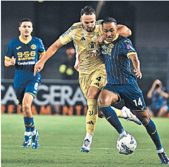
Футболисты «Ювентуса» (по центру) выигрывают оба матча на старте сезона и вышли в лидеры итальянского первенства.

21.45. «Наполи» — «Парма». Прямая трансляция