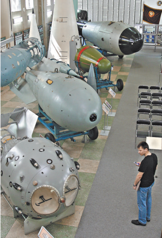
Образцы ядерного оружия — авиационные бомбы, торпеды и боеголовки к ракетам, созданные в разные годы в КБ-11 (ныне — РФЯЦ-ВНИИЭФ).