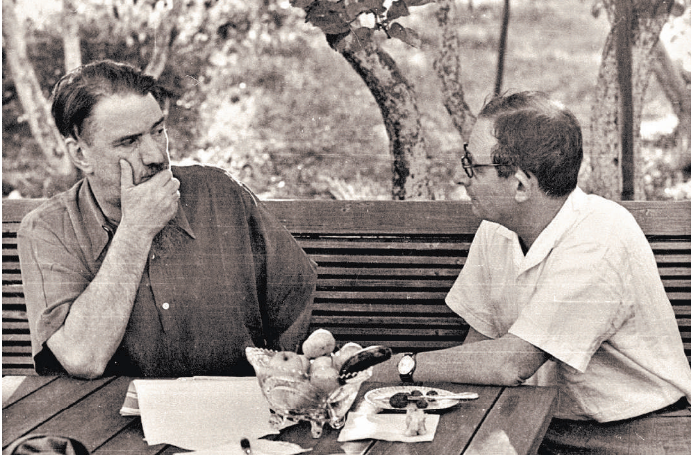
Игорь Васильевич Курчатов (слева) и Юлий Борисович Харитон. Скромные люди, великие имена.

К моменту закрытия Семипалатинского полигона в мире сохранилось пять действующих площадок, где проводили отработку новых видов термоядерного оружия и проверяли надежность существующих образцов. США такие тесты проводили на полигоне в штате Невада, Франция — на атолле Муруоро в Полинезии, Китай — на полигоне у озера Лоб-Нор. В СССР было два ядерных полигона — Семипалатинский (организован в 1947 году) и на Новой Земле, созданный уже в середине 50-х на удаленном архипелаге для испытания мощных термоядерных зарядов и специального вооружения для ВМФ. 2-й Государственный центральный испытательный полигон, как официально именовали полигон в Семипалатинской области Казахстана, расформирован в декабре 1993 года согласно директиве министра обороны РФ.