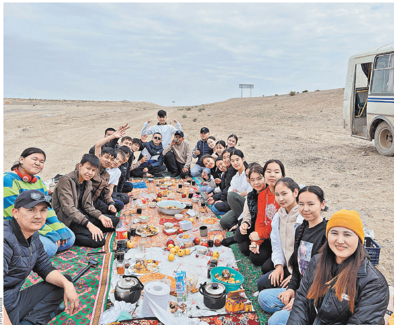
Пикник на обочине. Дети со школьным руководителем едят куурдак (мясо с овощами, тушеное в чугунном казане на костре), сидя на ковре.