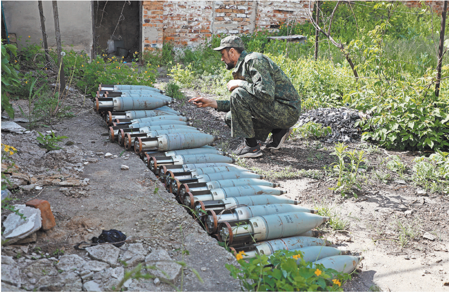
Танк подбили, экипаж погиб, а снаряды так и остались лежать ровными рядами...

— Я дома уже давно не была... — поясняет она. — Украинские военные нас выгнали, а здесь в Александровке люди приняли и помогли обустроиться. Но хочется посмотреть, как там наш