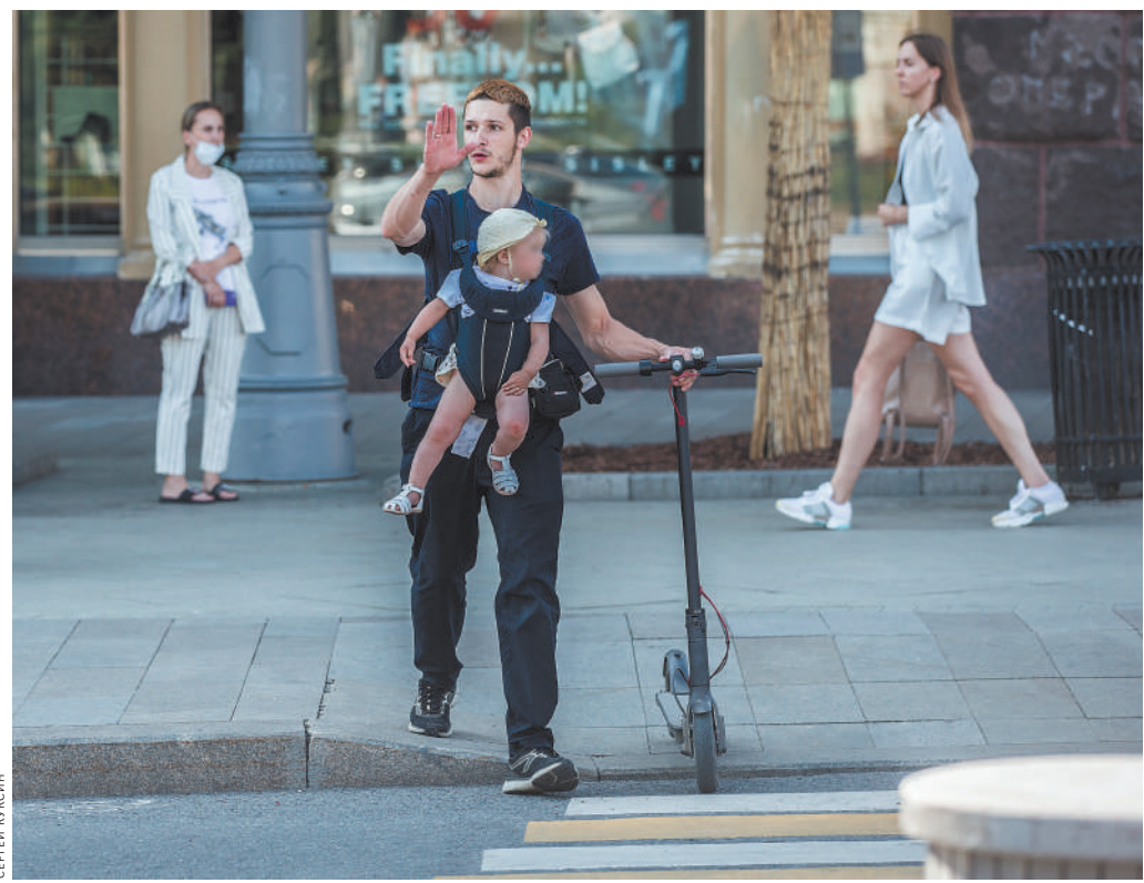
Этот пример идеального самокатчика: он переходит дорогу спешившись, да еще и знак подает водителю.

Напомним, что в проекте нового Кодекса об административных правонарушениях заложена такая новелла, как повышенная ответственность водителей в состоянии опьянения, которые перевозят детей. Если обычно за управление транспортным средством в состоянии опьянения предусмотрен штраф 30 тысяч и лишение прав на 1,5—2 года, то при таком обстоятельстве, как перевозка детей, штраф вырастет до 50 тысяч, а лишение прав можно будет на 3 года. Впрочем, когда будет принят этот проект —