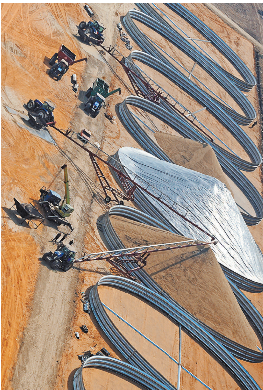
Планируется создать запасы продовольственного зерна — пшеницы и ржи — в размере 3 млн тонн.

Что касается обязательного оформления в системе товаросопроводительных документов, то после тщательного рассмотрения было принято решение сохранить ранее обозначенные сроки. То есть, как и планировалось, с 1 сентября 2022 года. Мы рассчитываем, что за лето производители смогут качественно подготовиться к работе в системе, заблаговременно внесут в нее данные и учтут различные нюансы. Получить всю необходимую консультативную поддержку можно в том