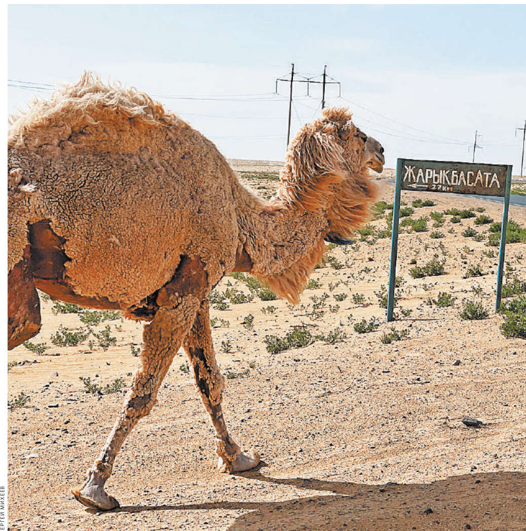
Великая степь. Она открывается в горизонт...