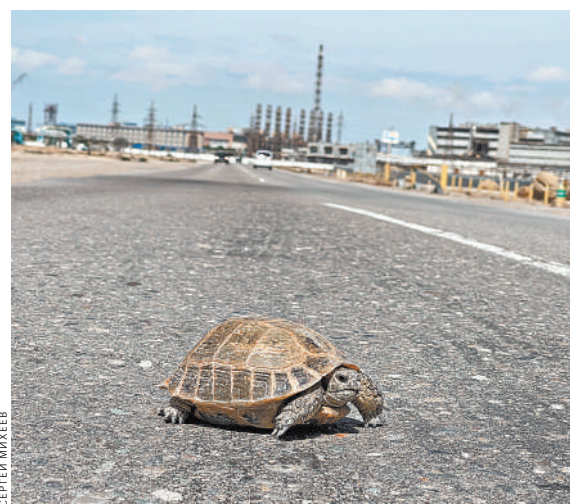
Черепаха на шоссе, такое тут можно видеть ежедневно.