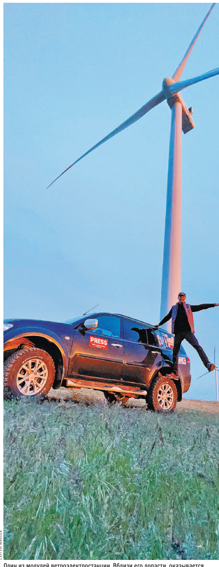
Один из модулей ветроэлектростанции. Вблизи его лопасти, оказывается, со свистом рассекают воздух, очень эффектно.