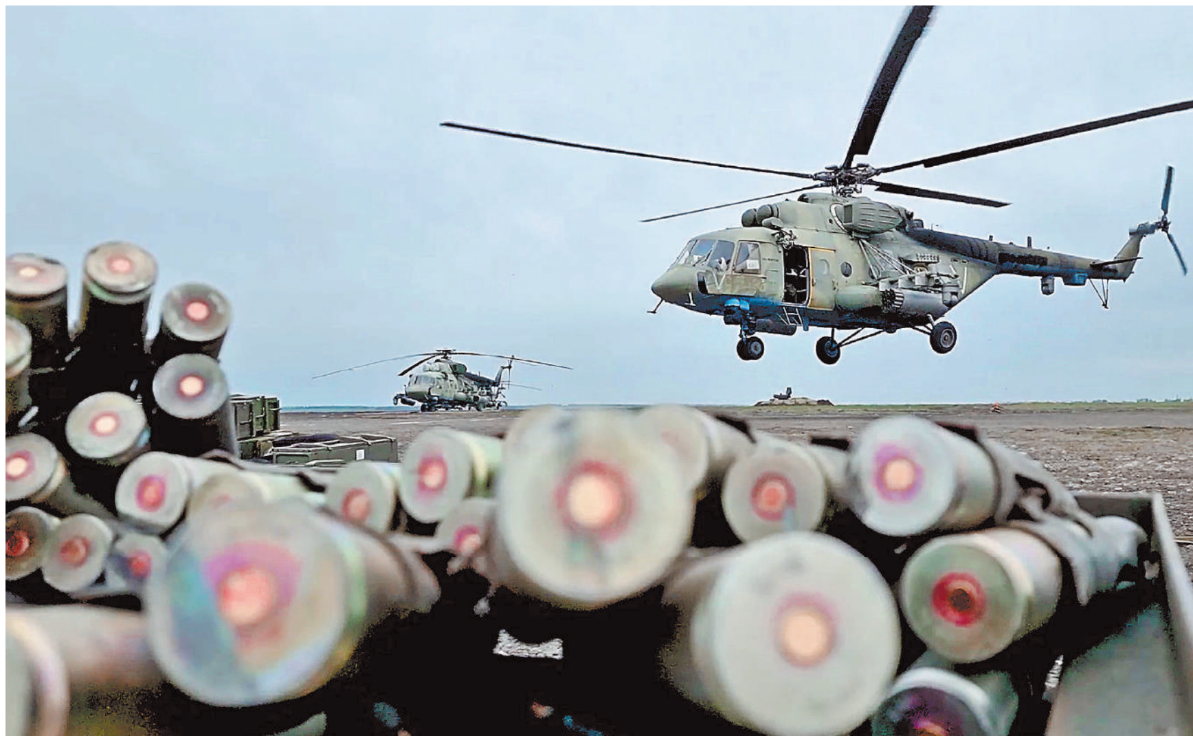
В ходе специальной военной операции вертолеты Ми-8AMTШ «Терминатор» показали себя настоящими тружениками. Их экипажи в том числе выполняют рейды в вражеских позициях. Идти летчикам приходится не выше 5–10 метров от земли. Они доставляют на передний край людей и грузы, в том числе беспилотники. А когда требуется, эвакуируют с поля боя раненых.