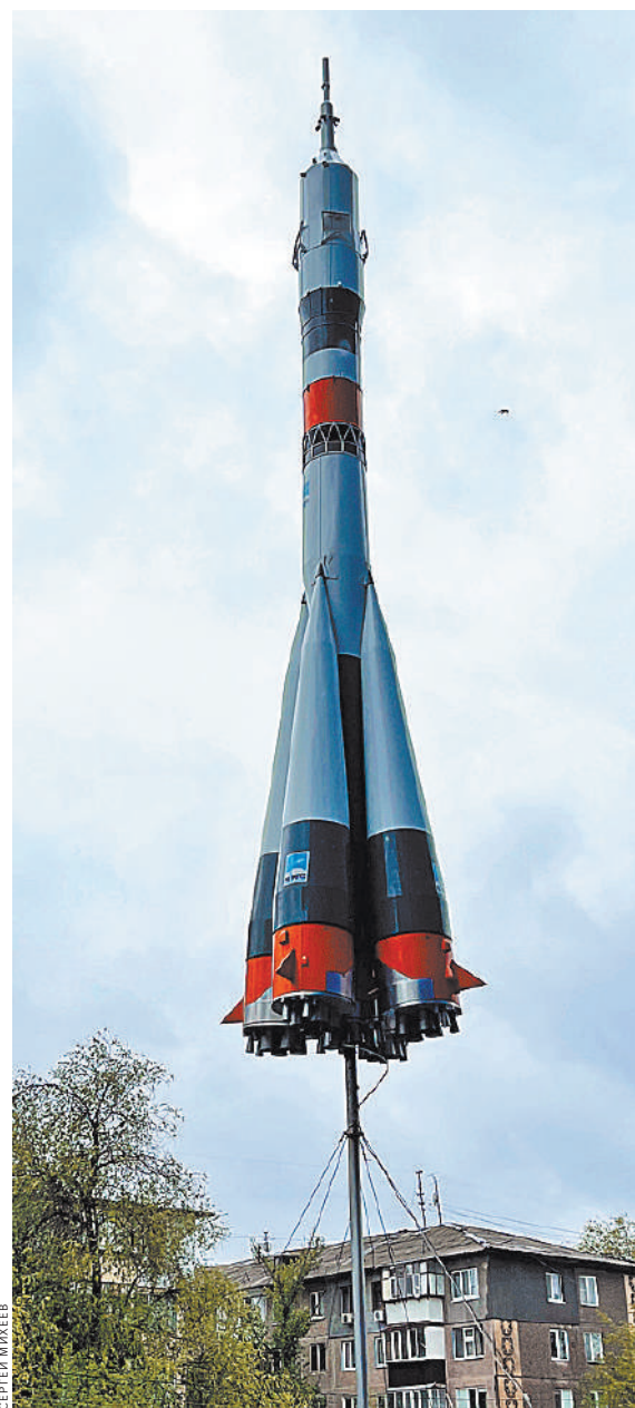
Уральск. Космическая ракета на улице казахского города — обычное дело, ведь неподалеку легендарный Байконур.