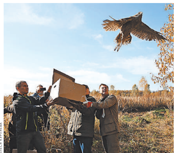
Ястреб-тетеревятник смело вылетел из коробки сам, не дожидаясь помощи людей.

ЭКОЛОГИЯ В Новой Москве выпустили из центра передержки птиц и змею Да, уж!