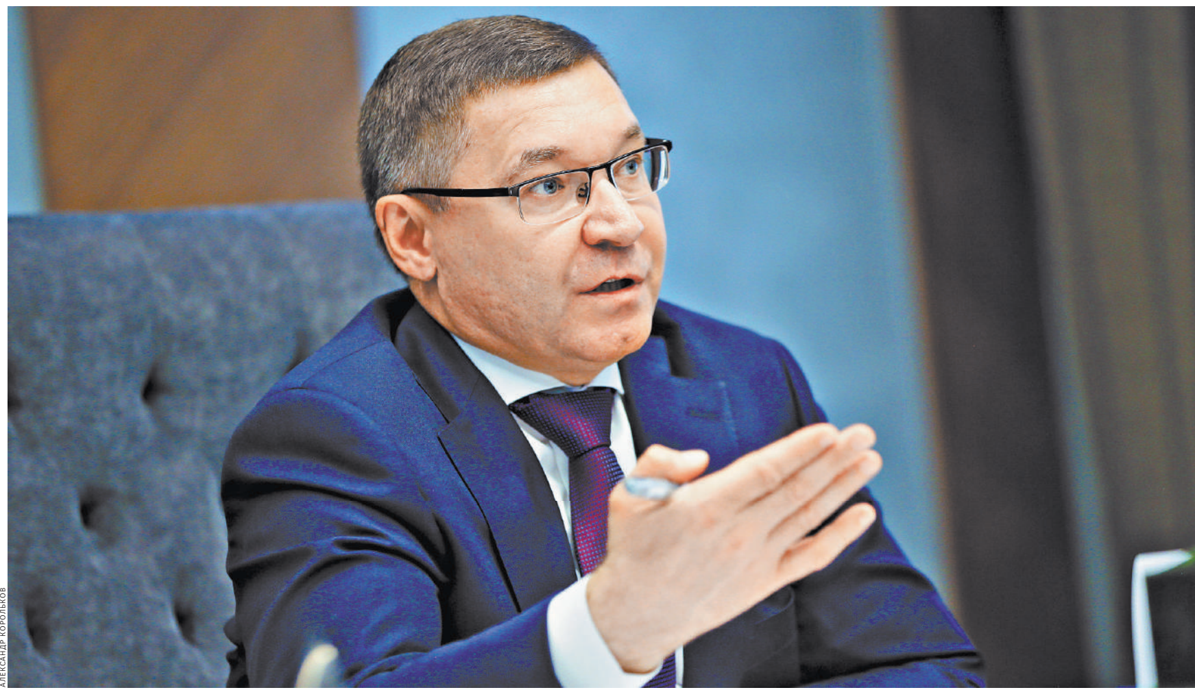
Министр строительства и ЖКХ Владимир Якушев: «Перегрева» рынка новостроек не ожидается.