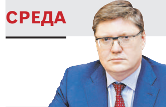
Андрей Исаев первый заместитель руководителя фракции «Единая Россия» в Государственной Думе