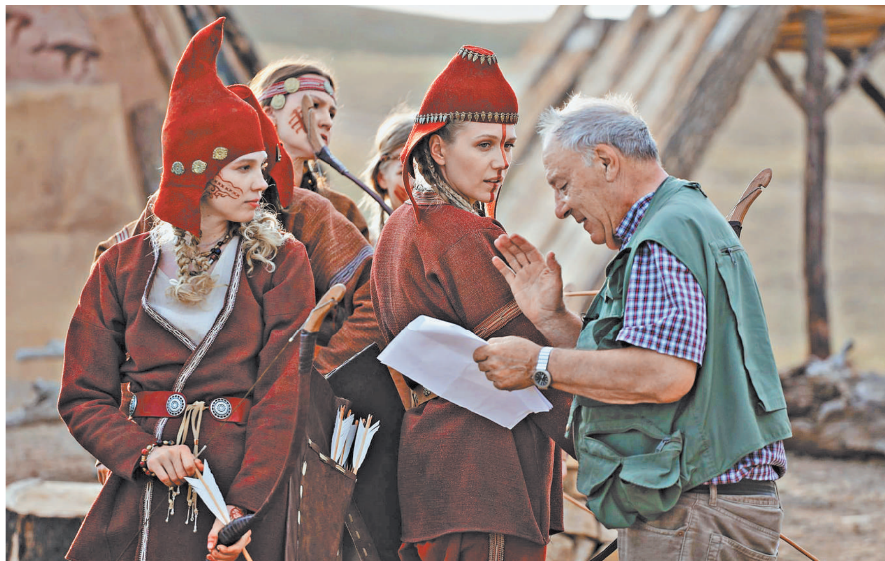
РЕЖИССЕР АЛЕКСАНДР ПРОШКИН