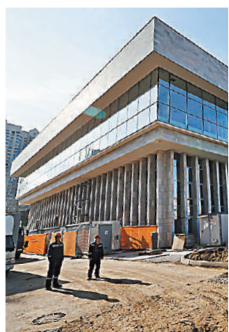
Отделка фасадов библиотеки уже полностью завершена, а на территории идет благоустройство.

Здание же библиотеки восстановлено в соответствии с проектом известного советско-