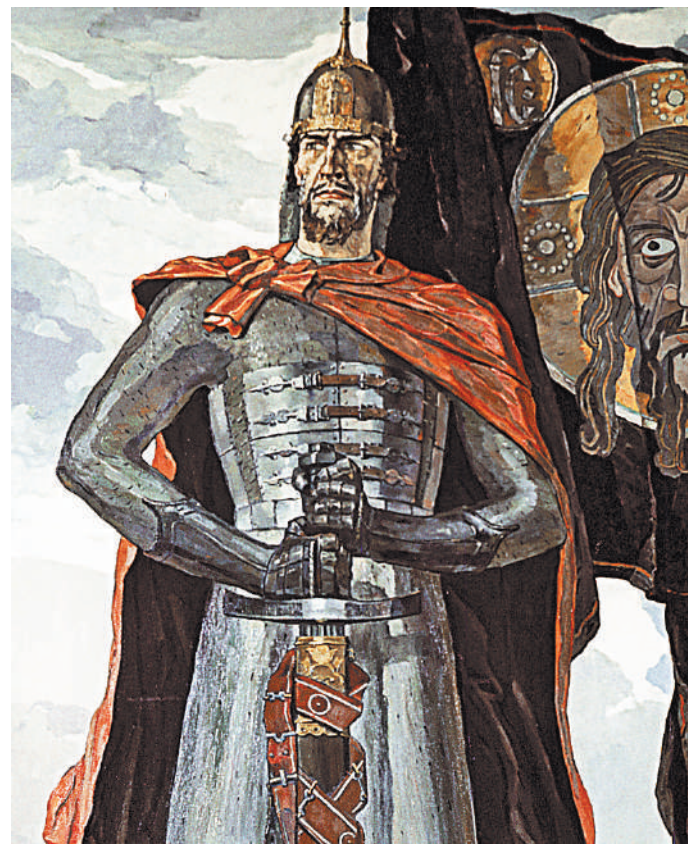
Александр Невский на знаменитом триптихе Павла Корина, наверное, один из его лучших образов в современности.

Спроси на современной улице об Александре Невском, и каждый повторит фразу из фильма Сергея Эйзенштейна «Кто с мечом к нам придет, тот от меча и погибнет». А при серьезном обсуждении национальной идеи обязательно всплывут еще более важные его слова: «Не в силе Бог, а в правде». Хотя спроси на той же улице, чьи это слова, вам всего скорее скажут: Даниила Багрова из фильма «Брат». Но похоже, что и талантливый Балабанов — на парадоксах и юродстве — восхристал в 90-е нравственную максиму Александра Невского. Как знак того, что мы не погибли. И хоть поисковик «Яндекс» при наборе слов «Александр Невский» в первую очередь выбрасывает «От чего помогает» и «актер, Википедия», нам предстоит пройти какой-то серьез-