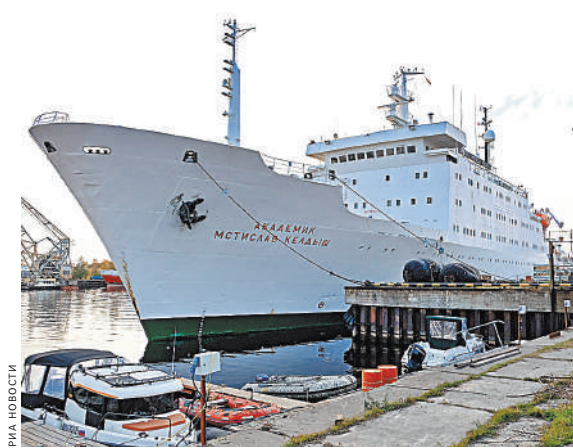
НИС «Академик Мстислав Келдыш» называют флагманом научного флота России. Имя на борту к этому обязывает.

Понимание происходящих процессов имеет большое значение для России, поскольку многолетняя мерзлота встречается на значительной части территории. О ее состоянии можно судить по составу веществ, которые переносятся в Северный Ледовитый океан крупными реками. В устьях Оби, Енисея и Лены ученые рассчитывают уловить и распознать этот интегрированный «геохимический сигнал».