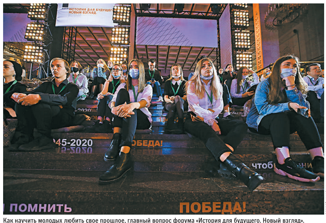
Как научить молодых любить свое прошлое, главный вопрос форума «История для будущего. Новый взгляд».