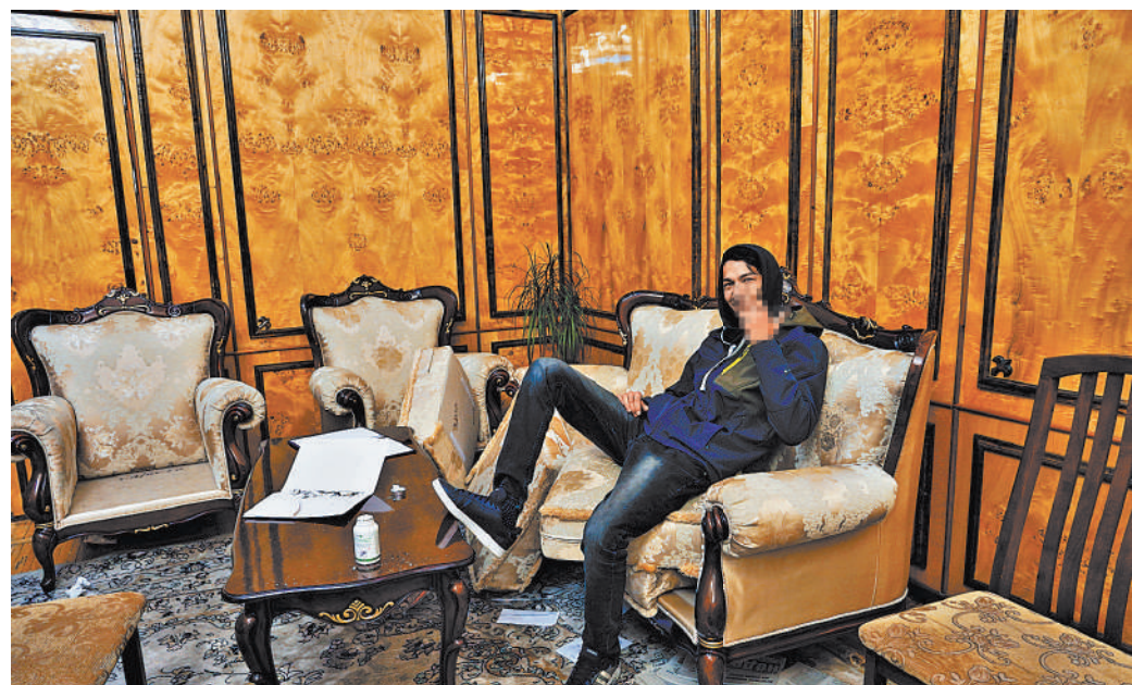
После захвата здания парламента демонстранты бродили по его кабинетам и фотографировались.