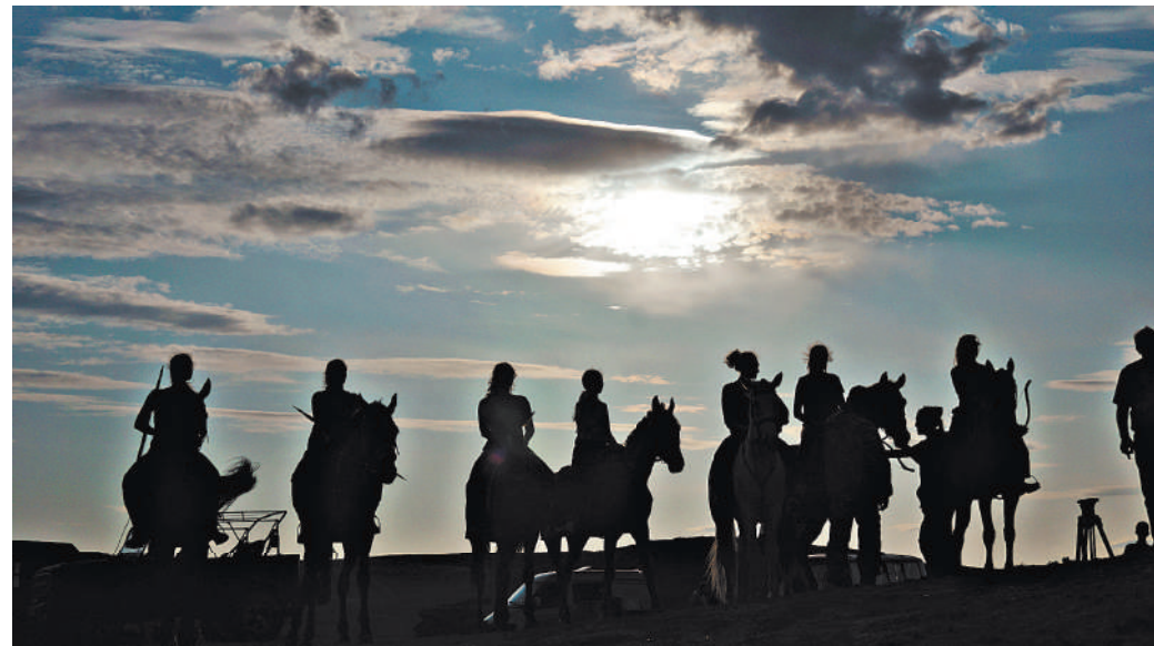
Фильм снимался в краях мистических: кажется, что из-за холма вот-вот покажутся конницы сарматов, скифов...