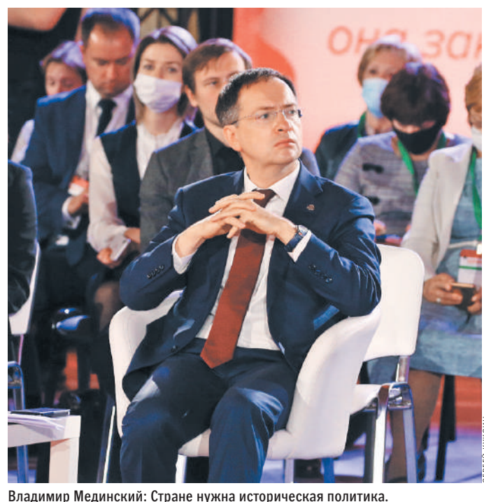
Владимир Мединский: Стране нужна историческая политика.

Конечно, все выше сказанные тезисы — не догма. Стране нужна историческая политика. Давайте думать вместе. ♣