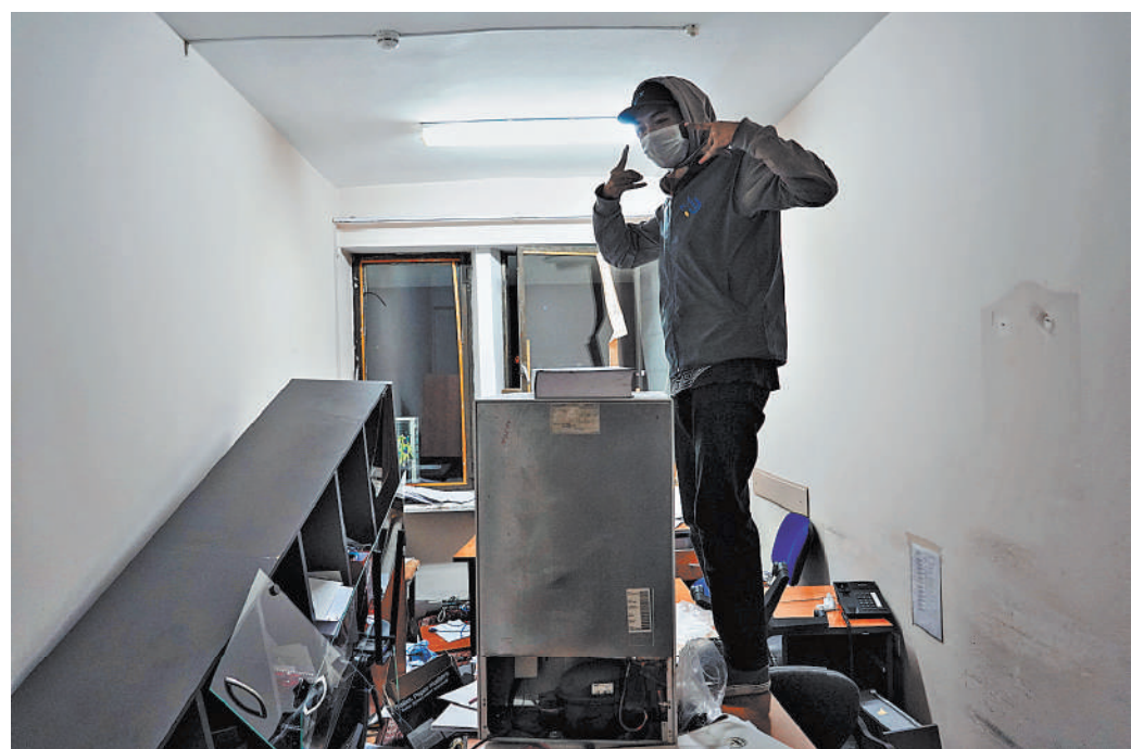
Часть помещений в здании парламента протестующие полностью разгромили, не забыв прихватить ценные вещи.