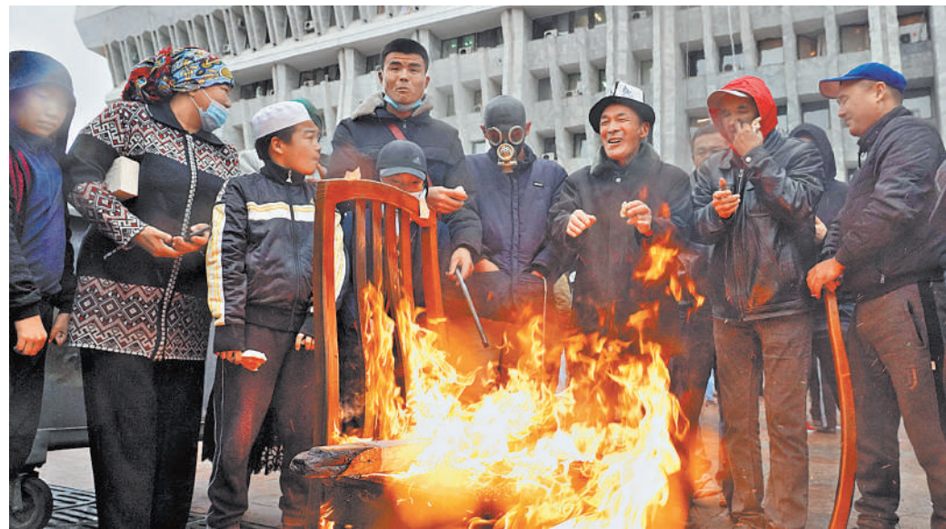
Протестующие захватили и разграбили здание парламента (на заднем плане) в Бишкеке.