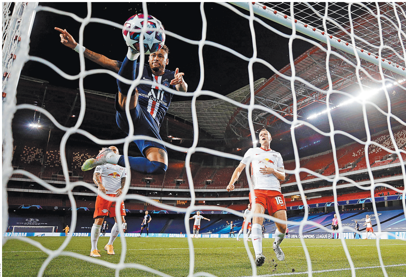
С «ПСЖ» Неймар трижды становился чемпионом Франции, но в его коллекции нет пока что главного трофея — Лиги чемпионов.

Вчера в рамках третьего тура РПЛ состоялось еще два матча: грозненский «Ахмат» обыграл на своем поле волгоградский «Ротор» (3:1), а чемпион страны «Зенит» принимал московский ЦСКА. Результат встречи в Санкт-Петербурге стал известен после подписания номера «РГ» в печать. ●