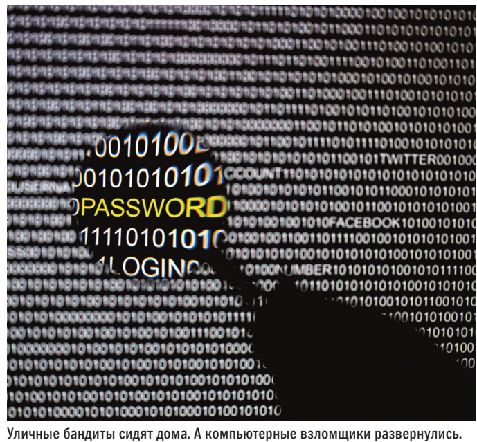
Уличные бандиты сидят дома. А компьютерные взломщики развернулись.

Но это в основном связано с увеличением киберпреступности. Число преступлений, совер-