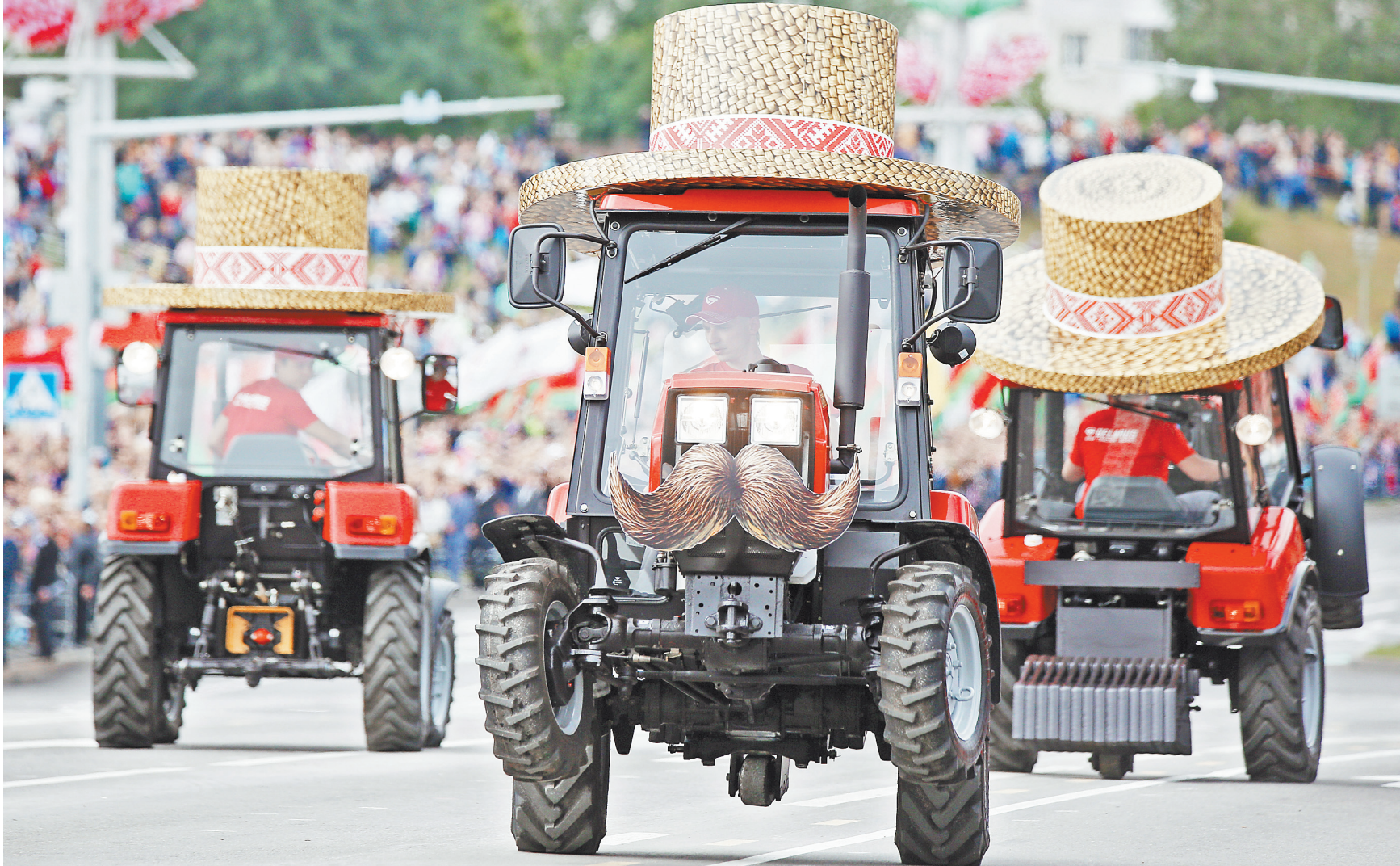
Этот трактор может и пахать, и танцевать, нужно только, чтобы управлял им умелый тракторист.

На втором месте — промышленная продукция. Одной из основных статей белорусского экспорта являются автотранспортные средства для перевозки грузов, шасси с двигателем и кабиной. По данным Всемирной торговой организации (ВТО), в Россию экспортируется 82% всей товарной группы. В основном это продукция крупнейших производственных объединений республики — «БелАЗ» и «МАЗ». Их остановки наряду с МТЗ и МЗКТ может оказать серьезное влияние на ряд российских отраслей. Так, «БелАЗы» активно используются в российской горнодобывающей промышленности, и у компании уже подписано несколько крупных контрактов с российскими покупателями. Среди покупателей белорусской машиностроительной продукции есть и другие страны, в том числе Африка и Латинская Америка. Но эти