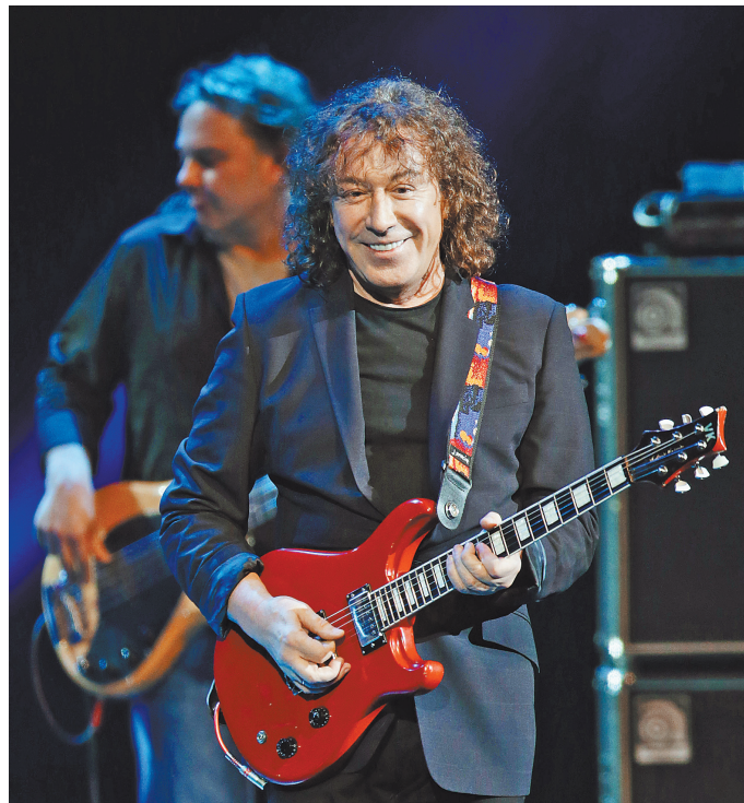
Чтобы писать светлые хиты, надо быть добрым человеком. Кузьмин такой.

Кроме того, смущает тот факт, что у Сандлера, по сути, отсутствует четкая программа, а также в силу объективных причин нет понимания всех нюансов того, как устроена работа федерации. Предвыборные заявления кандидата предсказуемо основывались на критике деятельности РФБ во главе с Кириленко. Между тем нынешний президент федерации ныне без преувеличения является самым узнаваемым лицом отечественного баскетбола и успешно конвертирует свой авторитет, идет ли речь о международных делах (Кириленко — член центрального бюро ФИФА) или о поддержке баскетбола в регионах. И раз запущенные им проекты уже работают, логично, если именно Кириленко и доведет их до конца. ●