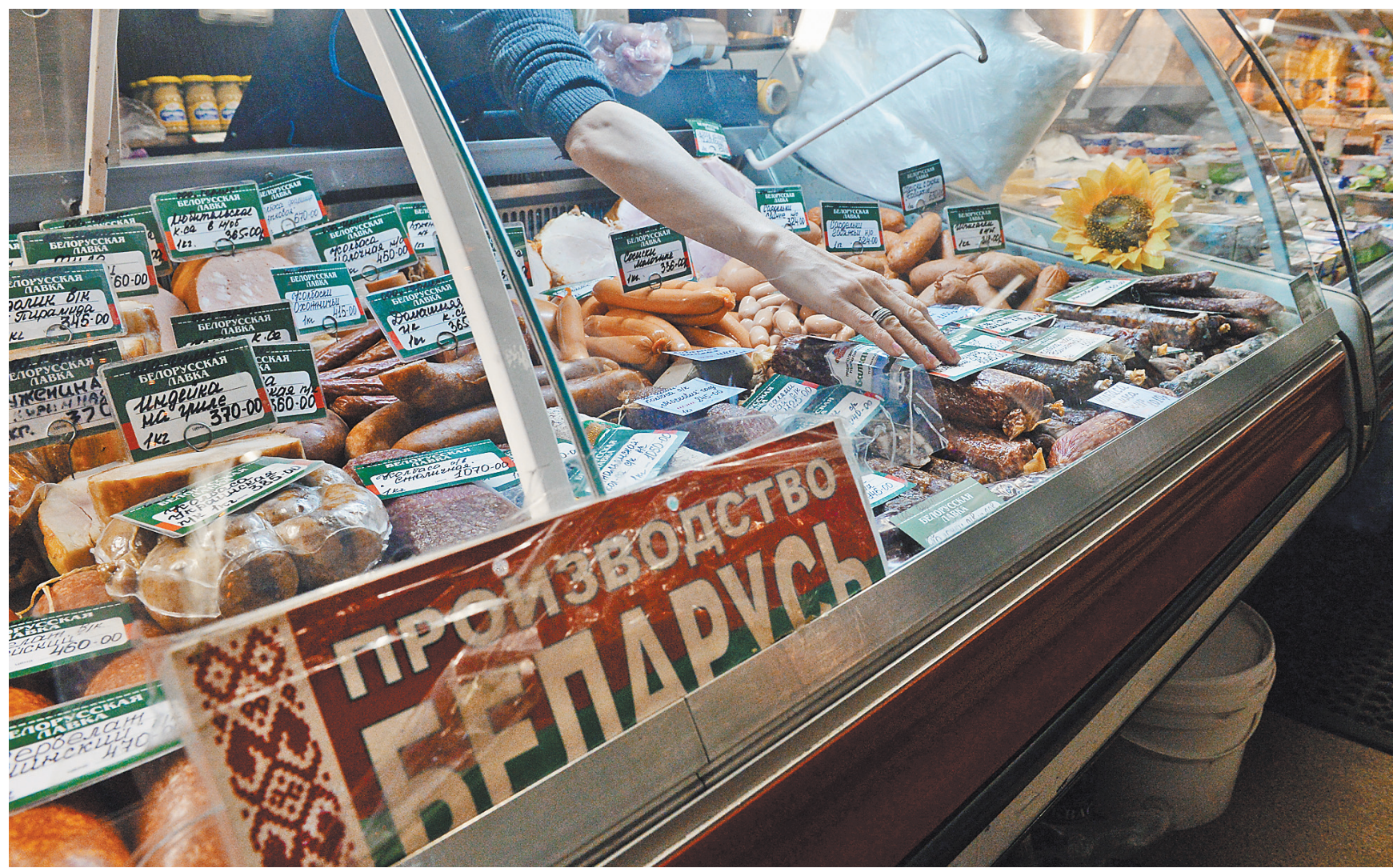
Иногда место, где сделан продукт, становится лучшей гарантией качества. Его можно смело брать и к праздничному столу, и просто на ужин. Не надо смотреть ни на состав — он будет натуральным и оптимальным, ни на ГОСТы, только лишь на срок годности. Когда в продовольственном магазине видишь на витрине надпись «Произведено в Беларуси», то сразу знаешь — вкусное здесь. И дальше уже думаешь только о том, чем сегодня отдать предпочтение: деликатесной грудке или нежному сыру.