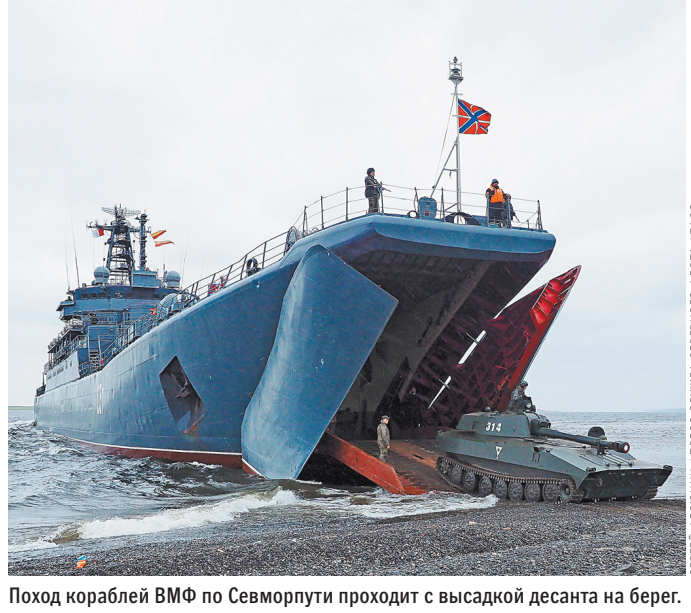
Патруль кораблей ВМФ по Севморпути проходит с высадкой десанта на берег.

По данным заместителя секретаря Совбеза РФ, план боевой службы ВМФ за 2019 год выполнен полностью. Увеличилась средняя продолжительность дальних походов, а также интенсивность боевой службы кораблей и подводных лодок — носителей высокоточного оружия большой дальности. Морская авиация после длительного перерыва возобновила интенсивные полеты с выполнением практических действий в дальней морской и океанской зонах. Кроме того, во время несения боевой службы Военно-морским флотом успешно решаются задачи защиты национальных интересов России в оперативно важных районах Мирового океана.