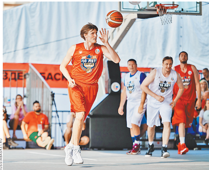
Для Андрея Кириленко секретов в баскетболе не существует.