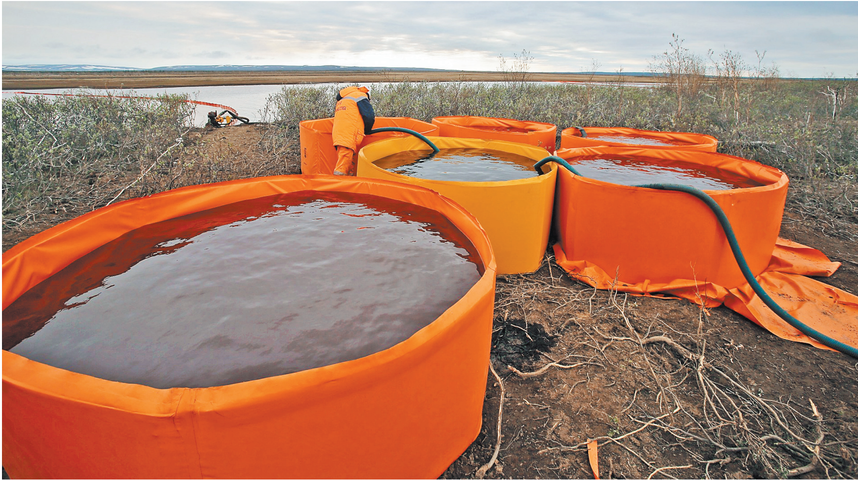
Спасатели перекрыли реку Амбарная бонами — специальными заграждениями и откачивают дизтопливо в емкости.

1 ← Местные власти, увидевшие наконец-то своими глазами масштабы экологической катастрофы, признают, что ущерб значительный. Но это связано, по их мнению, не с тем, что вылилась 21 тысяча 161 тонна дизтоплива, а с тем, что компания НТЭК и администрация города Норильска несвоевременно «принформировали» краевой центр, систему реагирования, а также главное управление МЧС России о произошедшей катастрофе.