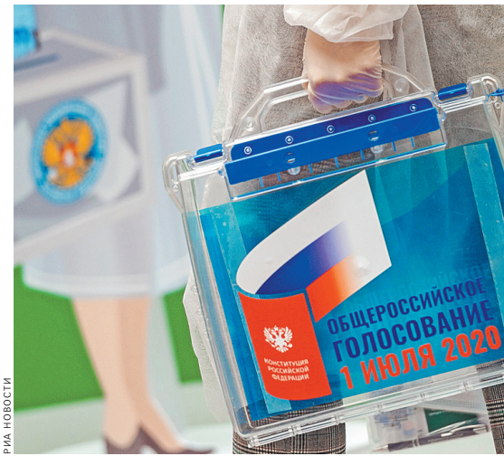
Избиратели, не желающие голосовать онлайн, смогут сделать это классическим способом.

По словам министра цифрового развития, связи и массовых коммуникаций РФ Максута Шадаева, ведомство уже сегодня, 5 июня, готово запустить процесс по-