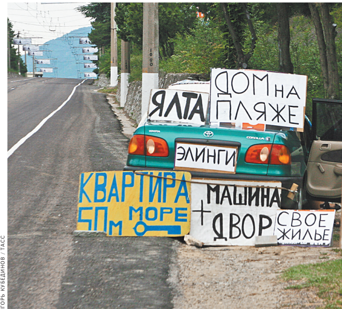
Жилье у моря ценится даже в пандемию.

Читайте на сайте: Как туристическая отрасль восстанавливается после пандемии rg.ru/art/1894462