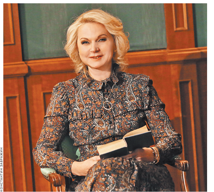
Для видеокнижки «Читаем Онегина» заместитель председателя правительства РФ Татьяна Голикова записала письмо Татьяны.

Марафон «Пушкин» смотрите на сайте: https://godliteratury.ru/