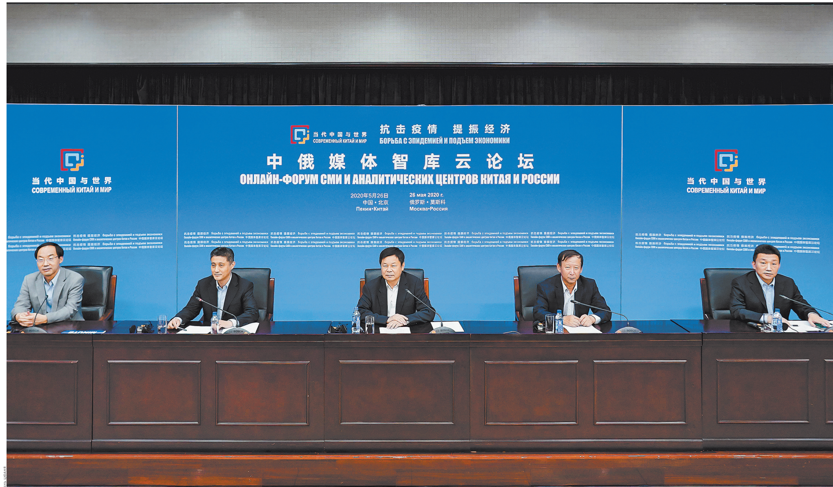
Участники форума подчеркнули важную роль СМИ в донесении достоверной информации о пандемии и опровержении слухов.

В Пекине 26 мая прошел онлайн-форум СМИ и аналитических центров Китая и России «Современный Китай и мир: борьба с эпидемией и подъем экономики», организованный Управлением