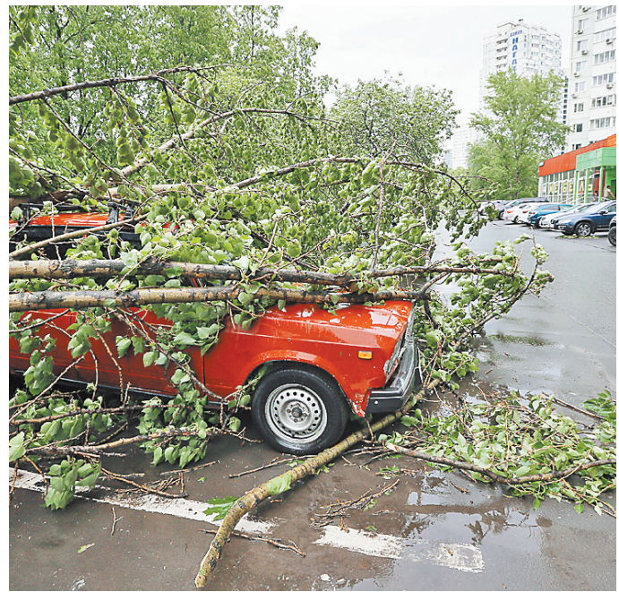
Верховный суд уточнил, что по закону коммунальщики должны доказывать, что их вины в падении дерева нет.

— Читайте также о других решениях Верховного суда rg.ru/sujet/2605