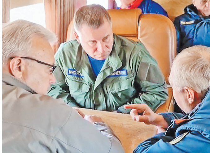
Глава МЧС России Евгений Зиничев, губернатор края Александр Усс вместе со специалистами осматривают на вертолете место ЧП и обсуждают, что делать.