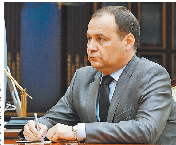
Новый премьер Беларуси Роман Головченко имеет опыт дипломатической работы, возглавлял ВПК страны.

На встрече с членами правительства президент Беларуси подчеркнул, что их задача не только не допустить падения экономики и уровня жизни людей. «Необходимо уметь не только работать в сложных и непредсказуемых условиях, но и видеть пути развития там, где их не видят другие. А коль стоит вопрос нашей выживаемости, мы все должны прозреть и увидеть эти пути», — сказал глава государства. Он также призвал министров «выхватывать и использовать каждый шанс, каждую возможность для движения». ●