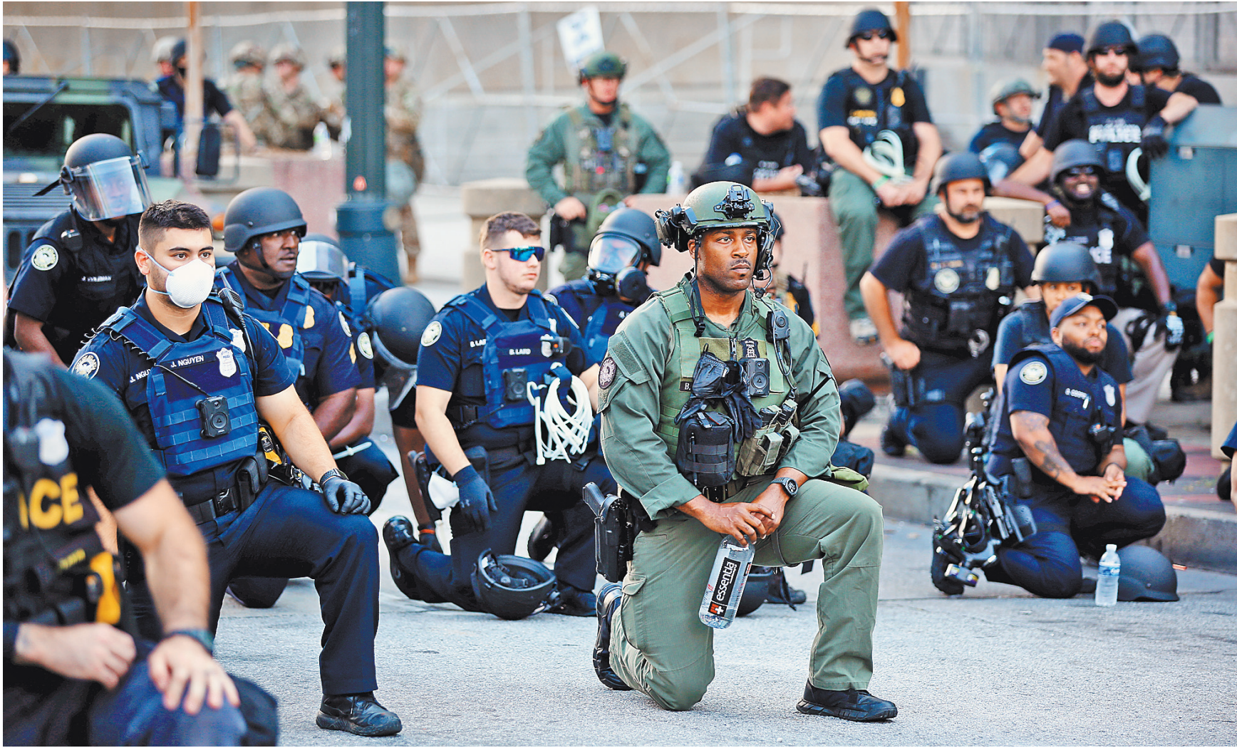
Пока президент призывает штаты к жесткому подавлению насилия, все больше полицейских по всей стране демонстративно встают на одно колено — это знак солидарности с протестующими.

Впрочем, эти и другие предпринимаемые федеральными и региональными властями США меры, в том числе репрессивного характера, по стабилизации общественно-политической обстановки в стране пока не дают видимого эффекта. Напротив, начало второй недели беспорядков в США ознаменовалось новыми погромами, грабежами и мародерством, а также задержанием около сотни человек в Нью-Йорке. Все они нарушили комендантский час и вышли на улицы города под лозунгами «Справедливость для Джорджа Флойда». Несмотря на то что к обузданию акций гражданского неповиновения привлечены уже более 30 тысяч бойцов национальной гвардии США в 31 штате, введенный комендантский час повсеместно игнорируется практически на всей территории страны: от Лос-Анджелеса на западном побережье до Вашингтона на востоке.