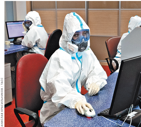
Выложенные переводы набирают тысячи просмотров.

У созданного телеграм-канала уже свыше полутора тысяч подписчиков. Информация более чем востребована: выложенные переводы набирают тысячи просмотров.