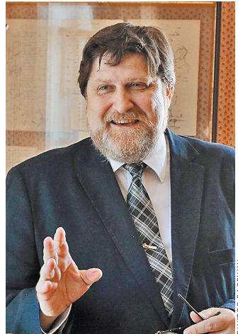
Георгий Василевич: Читатели смогут лично поздравить поэта в виртуальном формате.

Кроме того, в онлайн-режиме музей разместит в этот день и обзорную ретроспективу прошлых праздников. Рассказ об одном из них, проведенном в 1936 году, на сайте музея уже появилась. 6 июня можно будет увидеть, как проходили Всероссийские Пушкинские праздники поэзии в другие годы. Видеозаписи последних, фотовыставки, рассказывающие о первых, — словом, документальные материалы про все 54 праздника тоже появятся на сайте.