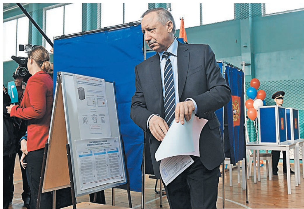
Врио губернатора Санкт-Петербурга Александр Беглов голосовал на участке в школе на Васильевском острове.

Людям с ограничениями по здоровью была предоставлена возможность вызвать социальную такси, чтобы добраться до избирательного участка. Внутри помощь им оказывали волонтеры.