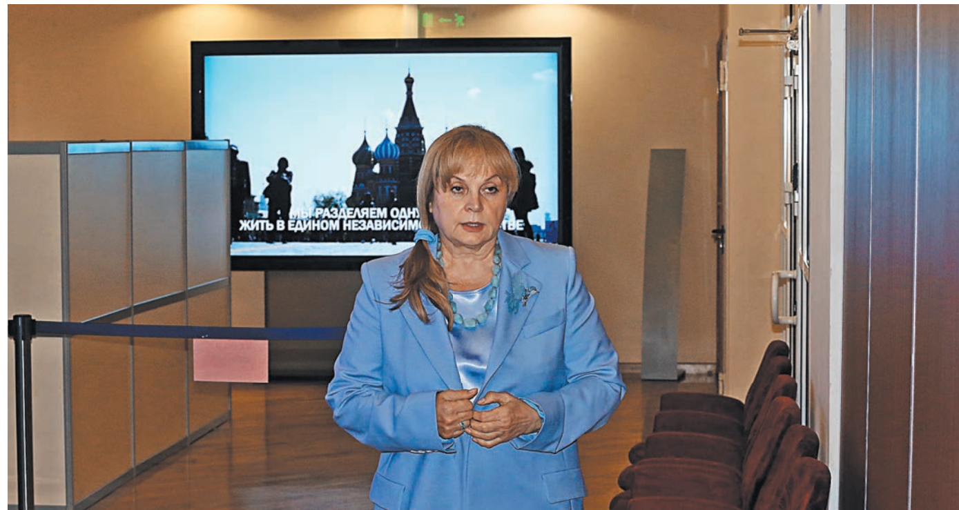
Цифровой избирательный участок в Тверском районе посетил председатель ЦИК Элла Памфилова. Высокую явку здесь она объяснила тем, что пользоваться новыми возможностями голосования люди обычно активны и ответственны.

Всех участников электронного голосования, как выяснилось, еще в субботу исключили из списков в участковых избирательных комиссиях, чтобы не допустить возможности дублирования. В помещениях для наблюдения установили шесть специальных принтеров. Первые два печатают анонимный номер голосующего, еще два — зашифрованный голос, состоящий из множества букв и цифр. Соотносить их никак нельзя, как и определить, кто и за кого проголосовал. Расшифровать бюллетень можно только после 20.00 в воскресенье, когда разделенный на семь частей ключ соединят, по сути, создав единый пароль. Он представляет собой длинный случайным образом сгенерированный код, который разделен на семь частей. Части зашифрованного кода записали на флешкарты и