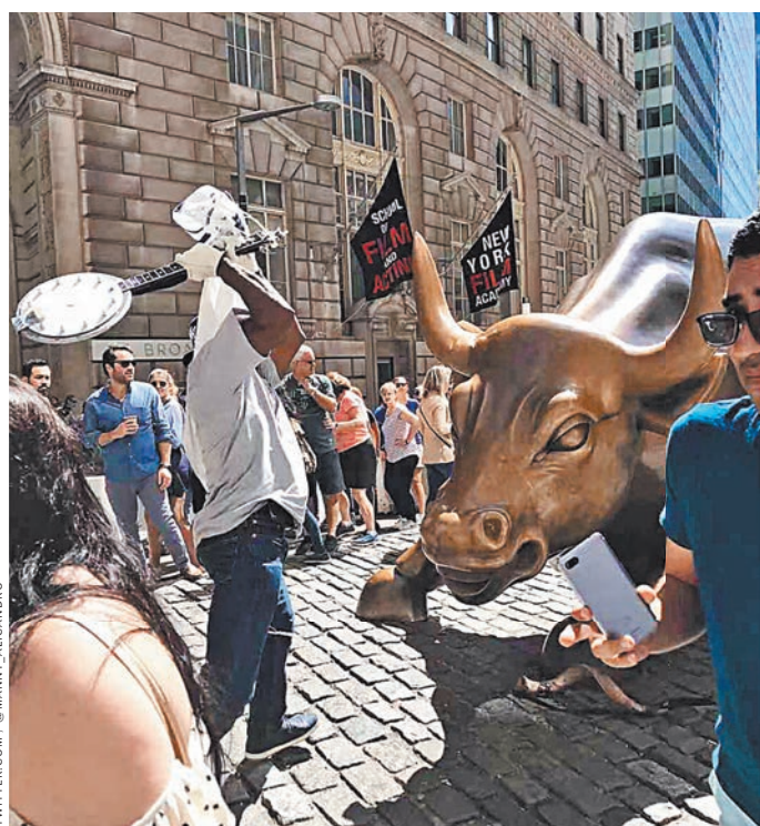
Мужчина, вооруженный банджо, атаковал окруженную туристами статую быка среди бела дня.