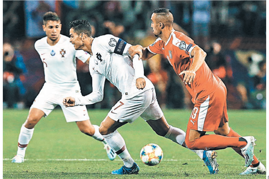
В активе Роналду 89 мячей за сборную. Остальные его партнеры суммарно забили за Португалию втрое меньше.

помогли англичанам выиграть в 13-м поединке подряд в отборочном турнире к Евро. По этому показателю британцы вышли на второе место в истории, догнав Испанию. По мнению Кейна, большая заслуга в последних успехах его сборной принадлежит главному тренеру команды Гарету Саутгейту. — Мы стали лучше играть после того, как Саутгейт возглавил нас. Да, у нас хороший состав, но за результат отвечает тренер, — уверен Кейн. — Мне кажется, Англия в состоянии бороться за титулы с Францией, Испанией, Италией, Голландией. При этом важно показывать такой же яркий футбол как в отборочном цикле, так и в финальных стадиях крупных турниров. В свою очередь Саутгейт посетовал на нехватку сильных соперников в отборочном цикле. По мнению специалиста, матчи в Лиге наций были напряженнее. — В тех играх мы многому научились. А теперь ребята должны компенсировать их нехватку тренировками, — рассказал рулевой англичан. — Знаю, некоторым не нравится Лига наций. Но когда ты доходишь до полуфинала, как мы, то хочешь пройти дальше и завоевать трофей. Что касается уровня нашей команды, то в удачный день мы способны победить любого. Добавим, что накануне состоялся ряд матчей в отборочном цикле Евро-2020. Результаты встреч: Армения — Босния и Герцеговина, Финляндия — Италия, Греция — Лихтенштейн, Румыния — Фарерские острова, Руанда — Мальта, Норвегия — Швеция, Грузия — Дания и Швейцария — Гибралтар стали известны после подписания номера «РГ» в печать. ●