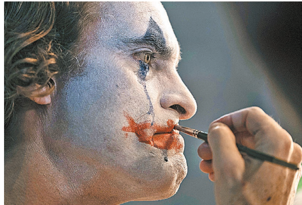
Хоакин Феникс в фильме Тодда Филлипса «Джокер».