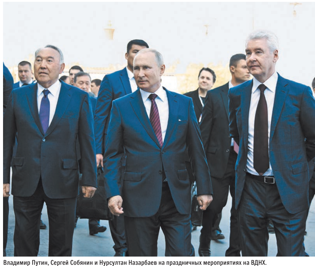
Владимир Путин, Сергей Собянин и Нурсултан Назарбаев на праздничных мероприятиях на ВДНХ.

— Фото и видео на сайте rg.ru/sujet/3404