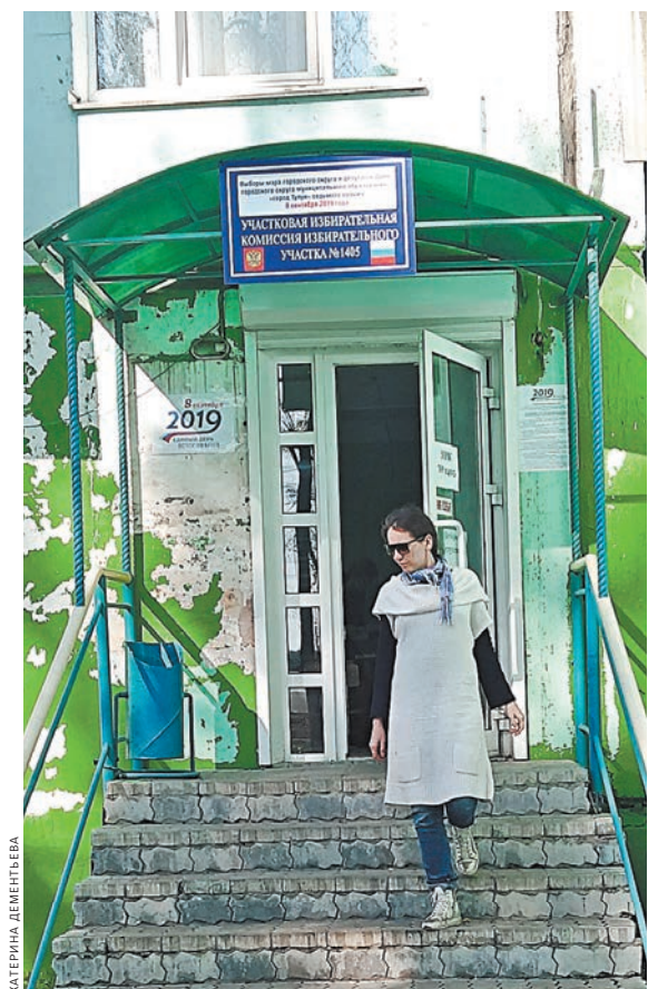
Из-за паводка этому избирательному участку пришлось перебраться из школы № 20 в здание бывшей аптеки.

— Я бы и хотел остаться здесь, но после наводнения цены на жилье поднялись непомерно. За те деньги, которые я получил за свой дом в виде компенсации — очень приличные деньги, — в Тулуе такой же не куплю. А под Красноярском — вполне, — поясняет он.