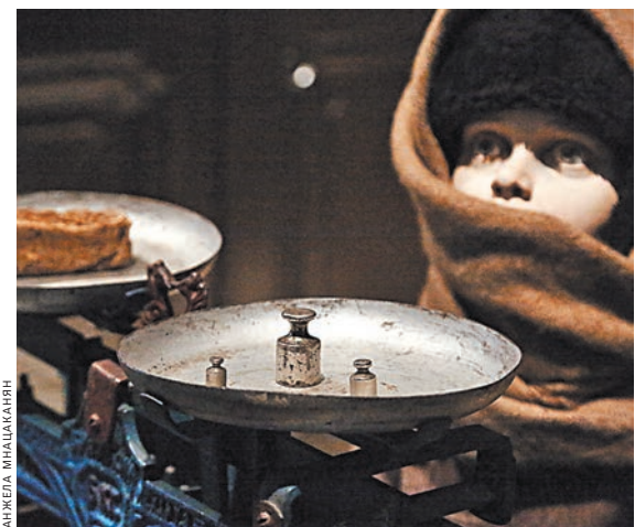
Одна из блокадниц, увидев эту инсталляцию, тут же воскликнула: «Да это же я».

Блокадники, которые присутствовали на церемонии открытия, поблагодарили городских власти и за бережное отношение к исторической памяти, и за то, что музей удалось отстоять. Ранее обсуждалась идея строительства для него нового здания, однако власти Петербурга прислушались к мнению городского сообщества, которое выступало за сохранение музея на прежнем месте. ●