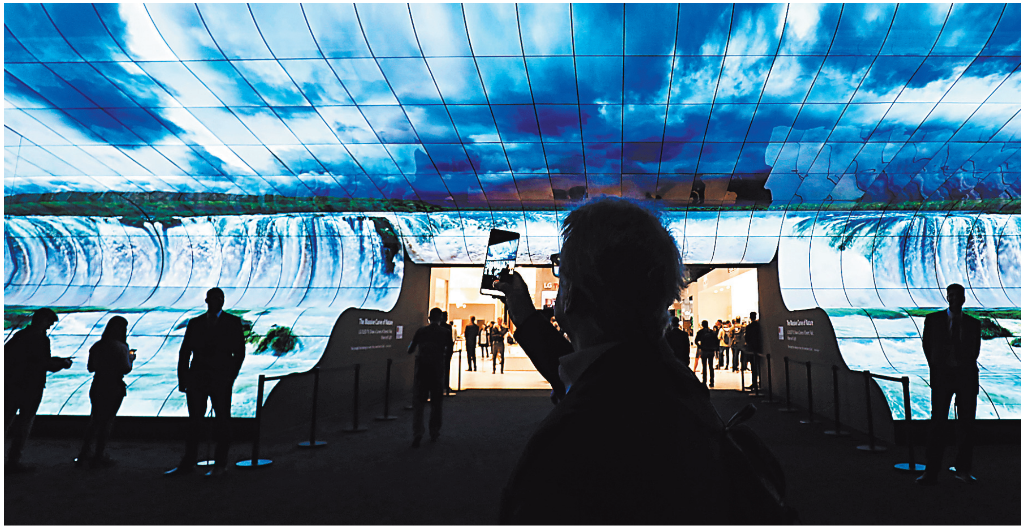
При входе на выставку посетителей встречает гигантское панно, составленное из телевизоров LG, каждый из которых показывает свою часть общей картинки.