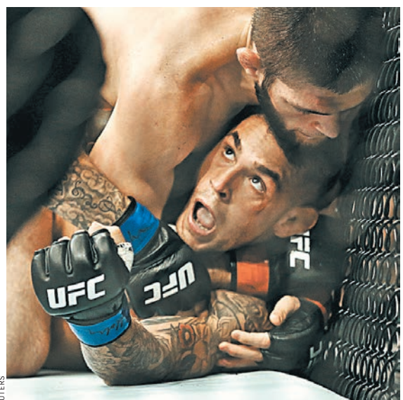
В третьем раунде поединка с Порье Нурмагомедов применил удушающий прием и одержал свою 28-ю победу в октагоне.

Разумеется, спросили у Нурмагомедова о планах на будущее. Но чемпион UFC в легком весе ушел от ответа, заявив, что хочет отдохнуть: — Так и напишите: мой следующий оппонент — стейк и бургер. Дайте мне, пожалуйста, пару дней на отдых, а потом уже можно будет что-то планировать. Впрочем, уже идут разговоры о том, что следующим соперником нашего бойца должен стать Тони Фергюсон. При этом, если Тони откажется от боя, то возможен вариант проведения реванша с Конором Макгрегором. Ирландец уже заявил, что он хотел бы провести реванш с Хабибом в Москве. Об этом Макгрегор сообщил в своем «Твиттере». «Назначьте мой реванш в Москве», — написал Макгрегор. Разумеется, яркая победа Нурмагомедова не осталась без внимания. Так, президент UFC Дана Уайт считает, что российскому чемпиону UFC в легкой весовой категории осталось совсем немного до звания лучшего бойца в истории MMA.