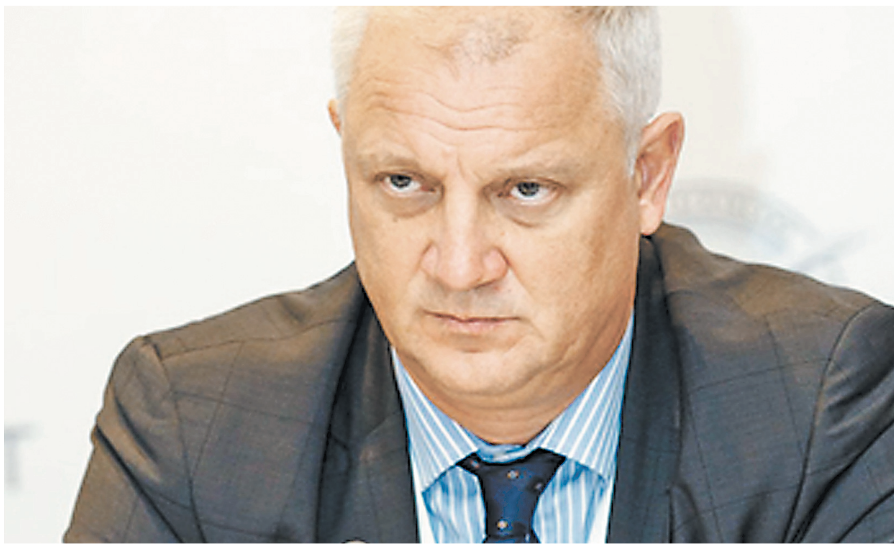
ЦЕНТР СТРАТЕГИЧЕСКИХ РАБОТ В ГРАЖДАНСКОЙ АВИАЦИИ