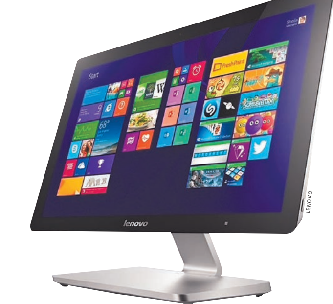
Компьютер Lenovo IdeaCentre A540.

— Что еще показали на выставке IFA читайте в спецпроекте «РГ» rg.ru/rgdigital