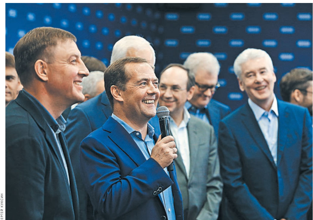
Дмитрий Медведев поблагодарил коллег по партии за проделанную работу, а победившим кандидатам напомнил: теперь они должны заниматься выполнением тех программ, с которыми шли на выборы.

Когда завершился Единый день голосования и начался подсчет голосов, премьер-министр, председатель «Единой России» Дмитрий Медведев приехал в центральный штаб партии, чтобы подвести предварительные итоги состоявшегося волеизъявления граждан. «Можно сказать, что партия «Единая Россия» сохраняет свои лидерские качества и остается ведущей политической силой нашей страны», — констатировал он, отталкиваясь от поступивших первых данных. «Граждане нашей страны оказали поддержку кандидатам от нашей партии на различные должности и тем, кому мы помогаем, за кого выступали».