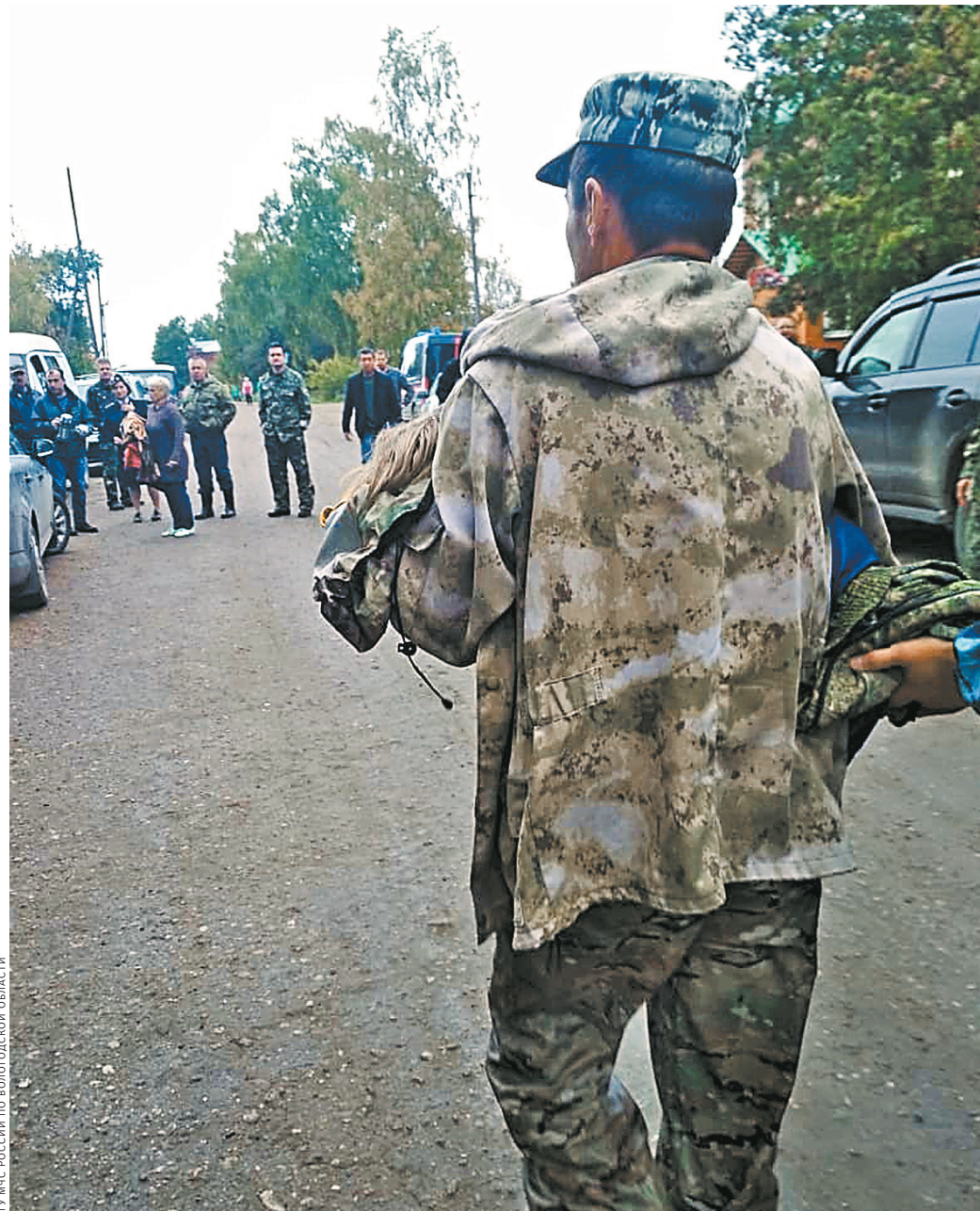
Волонтер нашел малышку в лесополосе, укутал и передал врачам.

Травм криминального характера нет. Правда, одна необычная деталь. В листовке, которую распространили, написано, что девочка была одета в платье темно-синего цвета в горошек и темно-синие колготки. Но на кадрах видно, что на девочке другое платье. И нашли ее там, где проходили неоднократно.