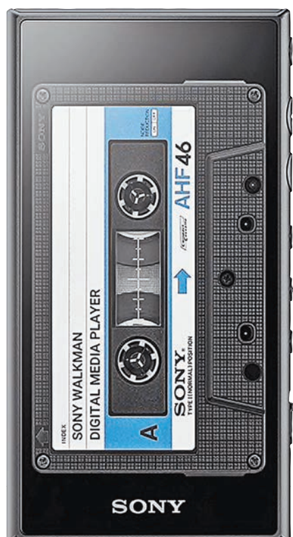
Плеер Sony Walkman 40 Anniversary Edition.

причем выглядит это весьма правдоподобно. Сам экран сенсорный и может отображать, конечно, не только кассеты — на него можно выводить список песен, переключаться между треками, искать композиции и так далее.