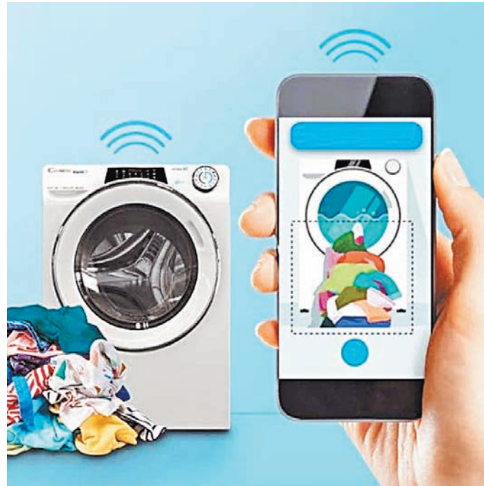
Стиральная машина Candy Rapid'0.

Работает это следующим образом. Нужно выложить испачканную одежду горкой на пол возле стиральной машины, сфотографировать на камеру смартфона и загрузить в фирменное приложение. После этого искусственный интеллект самостоятельно подберет