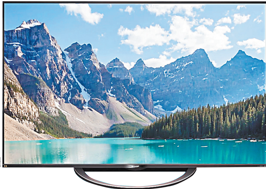
Телевизор Sharp 120" 8K.

Впрочем, не всем удается хорошо задевать ностальгические струны потенциальных покупателей. Например, компания Sharp решила впечатлить всех самым большим в мире телевизором с диагональю 120 дюймов и разрешением 8K. Это 7680 пикселей по горизонтали и 4320 пикселей по вертикали, если кому-то интересны подробности. Панель получилась высокой — ростом с человека, даже если не брать в расчет подставку.