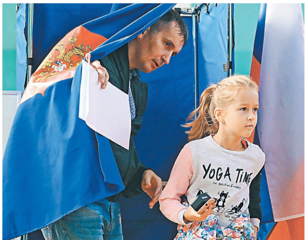
На избирательные участки многие россияне приходили вместе с детьми.