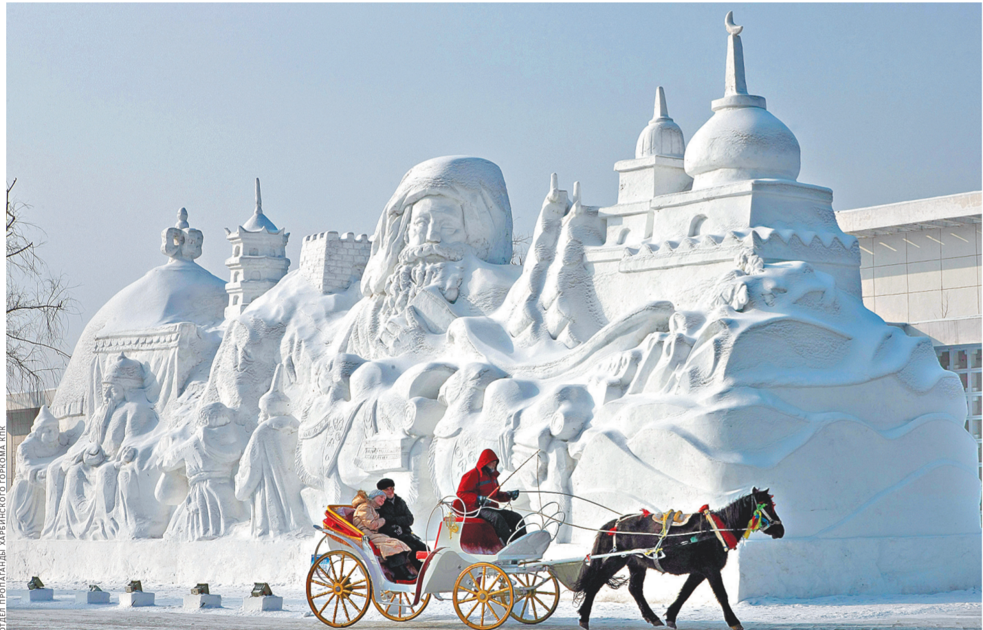
ФОТО: ПРОГРАММА «ХАРБИНСКОГО ГОРОДА» КИТА

Особенно эффектно экспозиция выглядит с высоты птичьего полета.