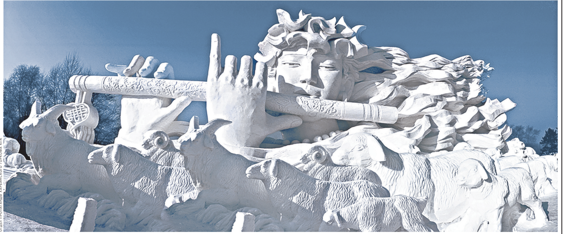
ФОТО: ПРОГРАММА «ХАРБИНСКОГО ГОРОДА» КИТА

Жители Харбина вообще очень любят спорт и предаются ему со всей страстью, ничуть не меньше, чем основным профессиям. Во время Международного фестиваля снежных и ледяных скульптур в Харбине проводятся и соревнования международного уровня по лыжам, хоккею, керлингу и многим другим зимним видам спорта. А горожане