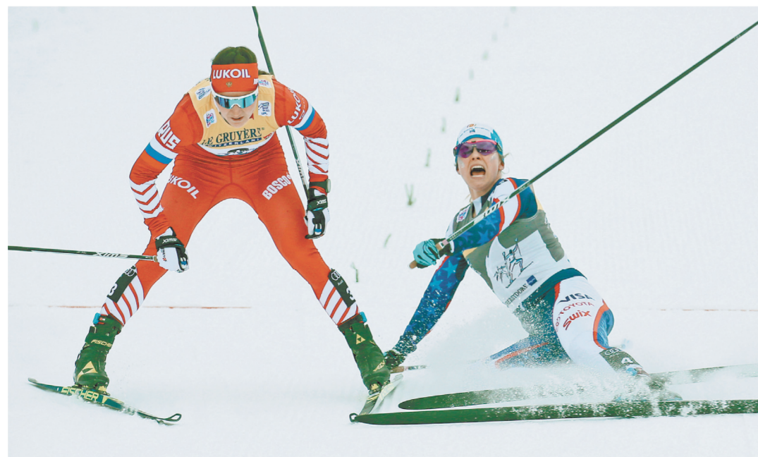
Наталья Непряева (слева) опередила на «Тур де Ски» многих сильных соперниц и стала первой россиянкой, поднявшейся на итоговый подиум гонки.

Успехи на «Тур де Ски» приносят спортсменам не только моральное удовлетворение и медали, но и вполне ощутимые призовые. Выплаты полагаются как по итогам каждой гонки, так и на основании положения в общем зачете. Так, победительница многодневки у женщин Ингвильд Эстберг за первое место в генеральной классификации получит 55 тысяч швейцарских франков. А всего за этот тур она заработала 78 тысяч франков — это почти 70 тысяч евро. Общий гонорар Натальи Непряевой составил 52 тысячи франков — это около 46 тысяч евро. У мужчин богаче всех стал победитель общего зачета Йоханнес Клебо. Помимо первого места в генеральной классификации у него четыре выигрыша на отдельных этапах. В сумме это принесло ему 77 тысяч франков, или 68,5 тысячи евро. Гонорар Сергея Устюгова — 50 тысяч франков, или 44,5 тысячи евро.