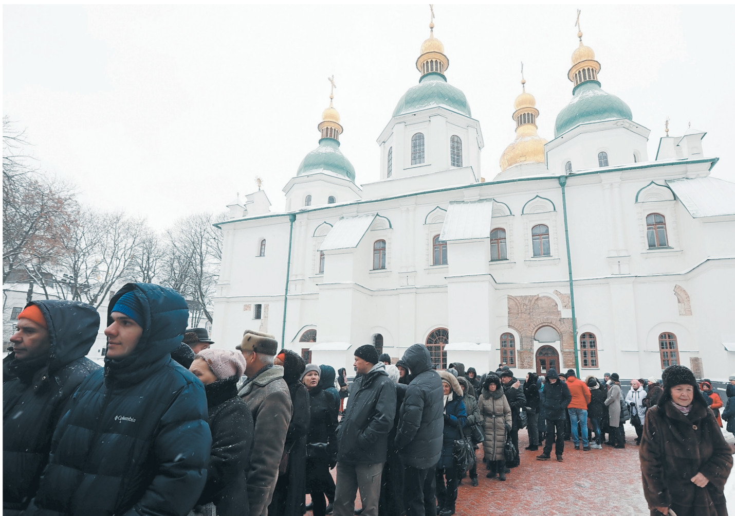
Сотни украинцев пришли в собор Святой Софии, чтобы посмотреть на неправильный томос.

О готовящихся нововведениях в интервью телеканалу TF1 рассказал премьер-министр Франции Эдуар Филипп. Ранее, 5 января, его подчиненному — официальному представителю правительства Бенжамену Гриво пришлось буквально бежать из собственного кабинета через задний двор, когда разъяренная толпа с помощью строительной техники взяла штурмом здание, в котором он работает.