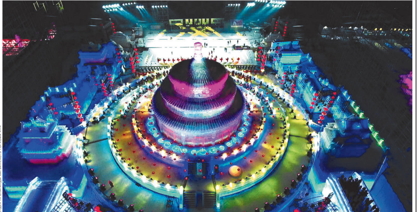
ФОТО: ПРОГРАММА «ХАРБИНСКОГО ГОРОДА» КИТА

Так весело, как празднуют новый год в Харбине, наверное, больше не празднуют нигде в мире. И если вы хотите, чтобы ваши подписчики в социальных сетях ахнули от изумления, то вам непременно надо приехать на праздники в Харбин. Ведь на фестивале снежных и ледяных скульптур днем можно посмотреть киберспортивные состязания в «Ущелье короля льда и снега», а вечером принять участие в концерте электронной музыки «Ледяной город Чаопа». Маститые диджеи «заводят» зрителей не на шутку, и под праздничные фейерверки все вместе весело встречают Новый год. ●