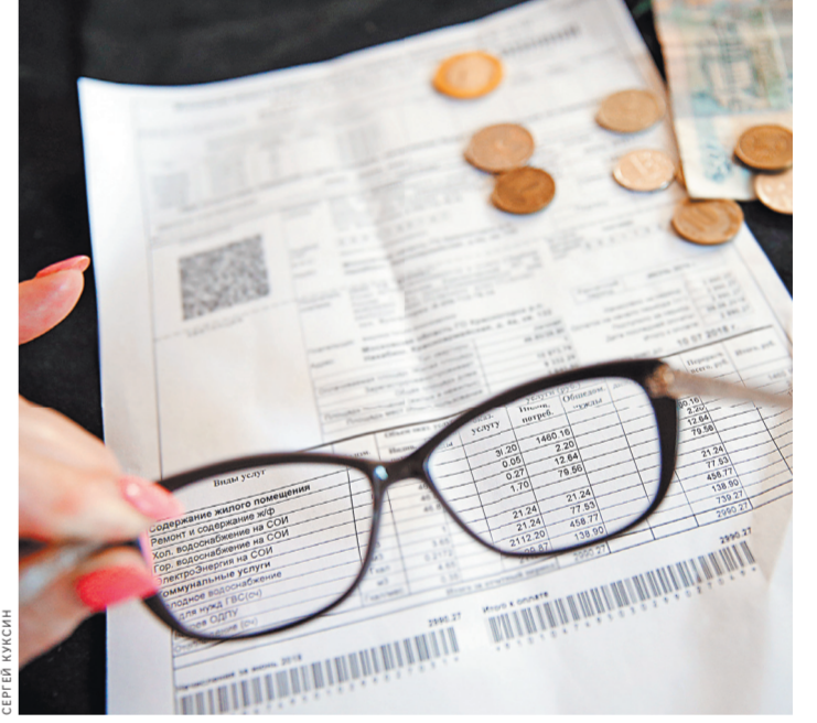
Эксперты советуют внимательно изучить платежку и оценить, все ли услуги в ней действительно необходимы.

Для городов федерального значения — Москвы, Санкт-Петербурга и Севастополя — старт «мусорной реформы» отсрочен до 1 января 2022 года. Телефоны «горячих линий» в регионе по «мусорной» реформе можно узнать на сайте «РГ».