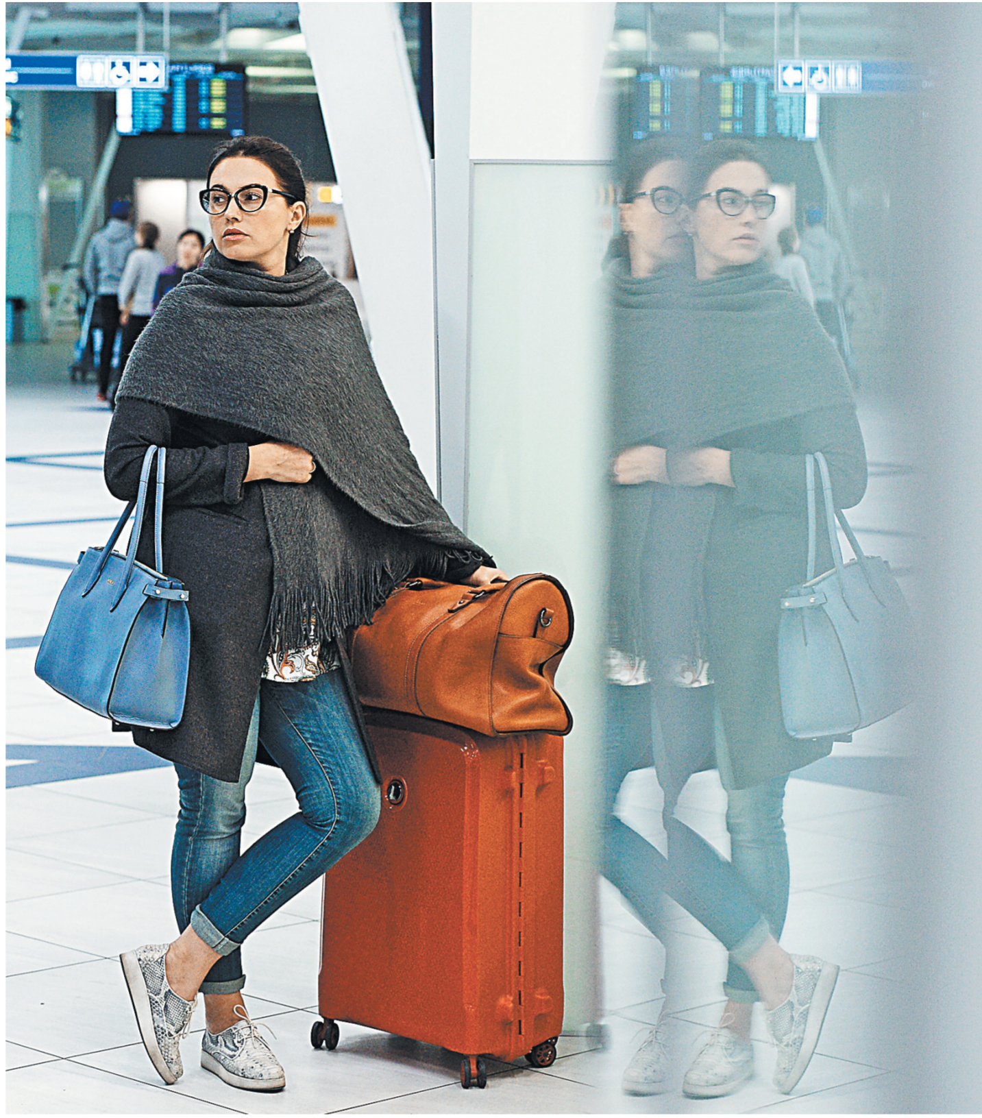
Без уплаты пошлины можно везти в страну в багаже или почтовым отправлением не более 200 сигарет, 50 сигар или 250 граммов табака и не более трех литров алкогольных напитков в расчете на одного совершеннолетнего получателя. За каждый литр алкоголя сверх меры придется заплатить пошлину в 10 евро.