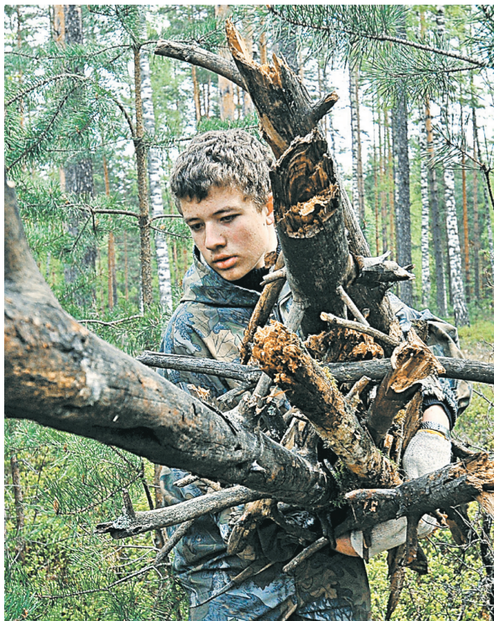
Собирать валежник можно весь год без уведомления властей, предельный объем не устанавливается.

Например, в Краснодарском крае установлены порядок и сроки подачи уведомления гражданами, а также учет собранного валежника. В Ханты-Мансийском АО об участках сбора валежника граждане должны оповещать лесничества, размещая информацию на специальных стендах. В Пензенской области собирать валежник можно без рубки лесных насаждений и без использования пилы и сучкореза. Закон Приморского края устанавливает, что граждане, которым предоставлены лесные участки в аренду, не вправе препятствовать доступу других людей для заготовки валежника. «Об условиях сбора валежника можно ознакомиться на официальном сайте органа госвласти региона, уполномоченного в области лесных отношений», — отметили в Рослесхозе. ●