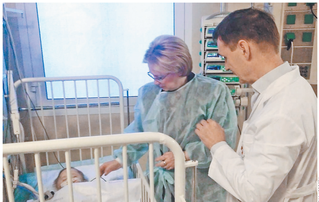
Выздоравливай, Ваня! У постели малыша — министр здравоохранения Вероника Скворцова и хирург Валерий Митиш.

Полный текст интервью читайте на сайте rg.ru/art/1637609