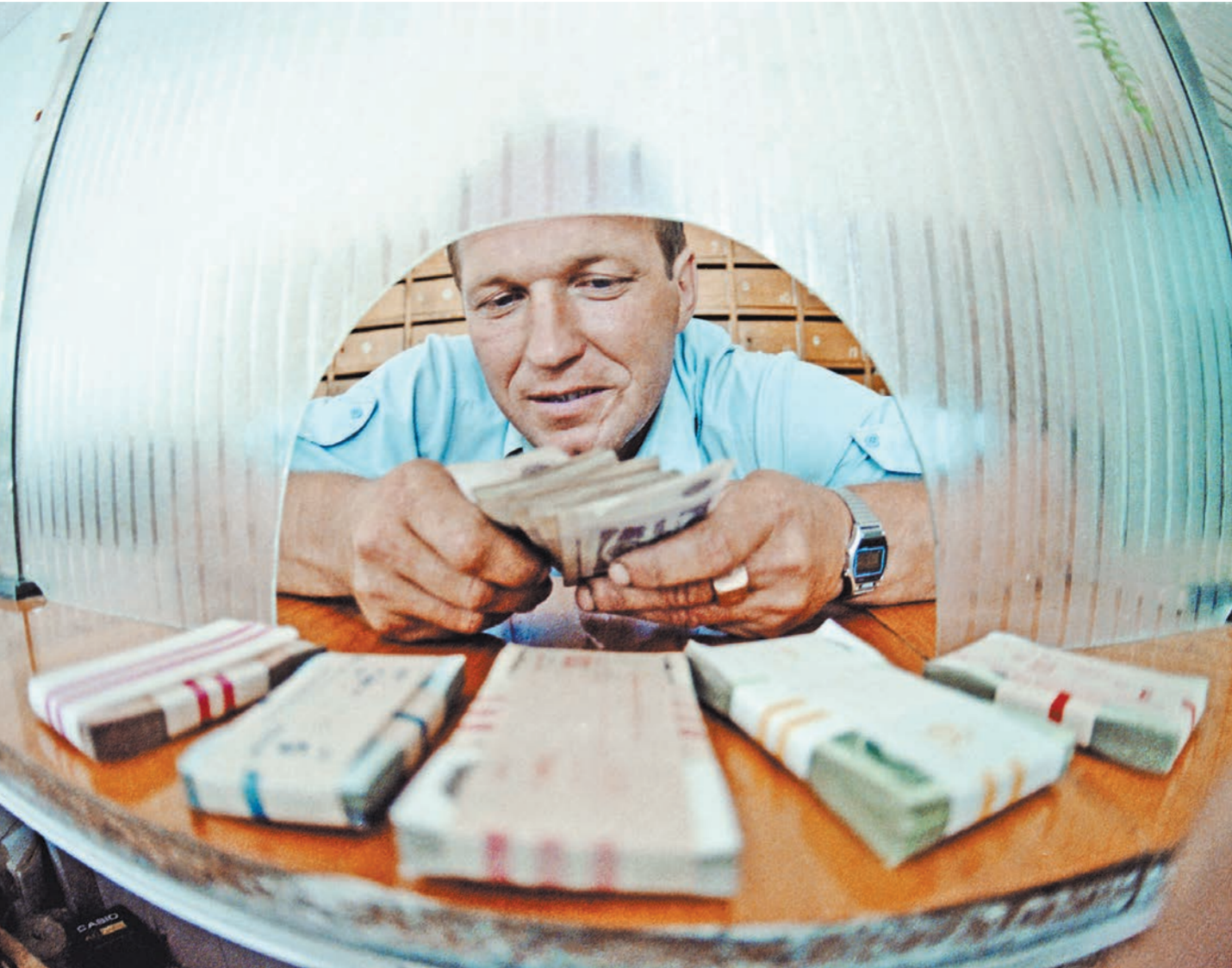
Как ни странно, но больше всего микрозаймов берут те граждане, чей доход выше среднероссийского.