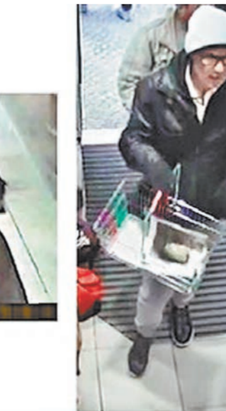
Peter Ehrlich @BrachinalmPress