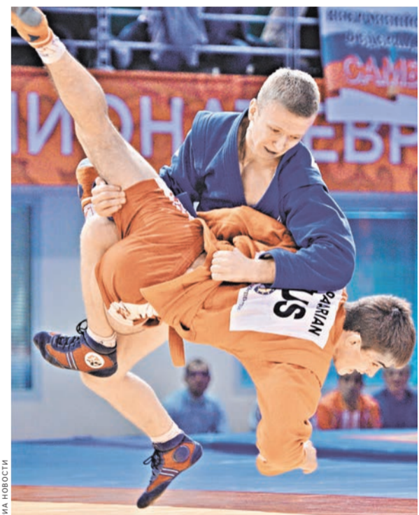
Самбисты сражаются только на ковре. А сойдя с него, они вновь члены одной дружной семьи.

Не остался без внимания и изменение в формуле состязаний. Всем британцам понравилось, что мы привезли не первую сборную, а самбистов из Новосибирска. Конечно, не игра в поддавки, зато точно уравнивание