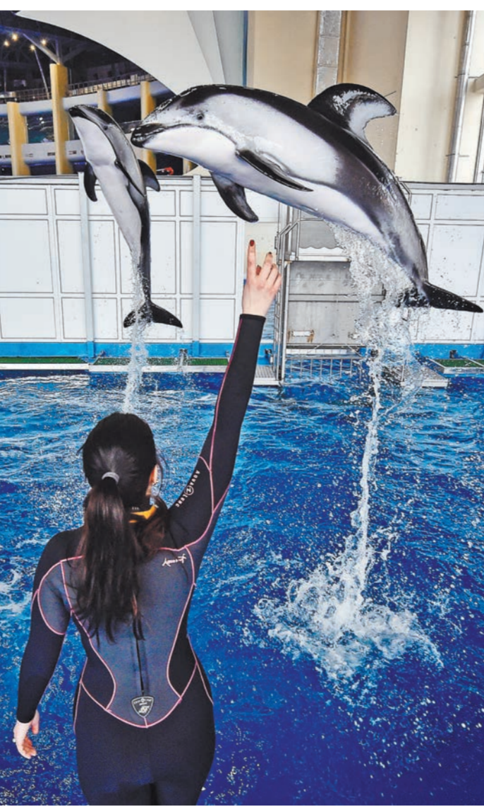
Посмотреть на дельфинов дешевле не удастся, но отмена НДС на билеты может пригодиться владельцам океанариумов для развития бизнеса.

То, что билеты в океанариумы освободили от НДС, вовсе не означает, что цены на них сразу снизятся