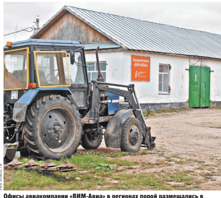
Офисы авиакомпании «ВИМ-Авиа» в регионах порой размещались в самых неожиданных местах.