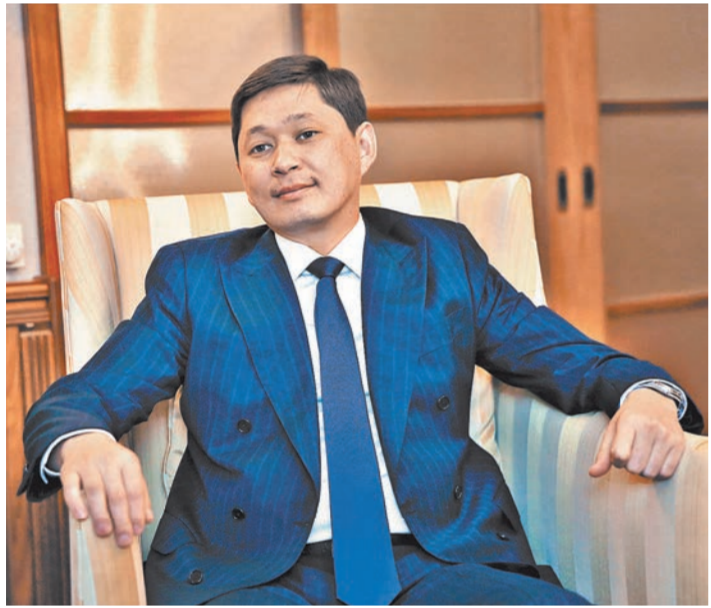
Сапар Исаков: ЕАЭС дает только положительные плоды.

Каким вы видите сотрудничество с Россией, с другими участниками Организации Договора о коллективной безопасности (ОДКБ) в плане обеспечения стабильности в регионе? САПАР ИСАКОВ: Это важнейший стратегический и геополитический проект. Вопросы, обсуждаемые в различных форматах ОДКБ, несут очень серьезную повестку дня. Во внешней политике нашей страны ОДКБ занимает приоритетное место. Мы четко понимаем, что вопрос обеспечения региональной безопасности, особенно в свете непростой ситуации в