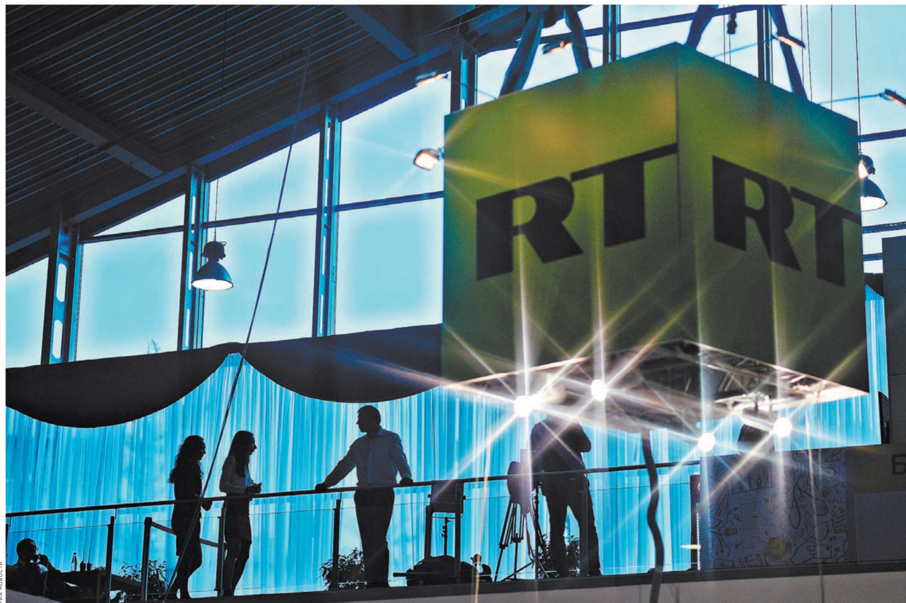
США давно выжили RT из страны, пытались разрушить репутацию, а теперь поставили в условия, в которых невозможно работать.

МАРГАРИТА СИМОНЬЯН: Наши зрители нас поддерживают, за что им спасибо. Много американцев пишут в соцсетях, что это предательство свободы слова, которую в самой же Америке и придумали. Благодарят нас за то, что мы показываем новости, которых нет на CNN. Самое удивительное, что такие комментарии люди пишут и в ответ на статьи в мейнстримовских СМИ. Ради этого и работаем.