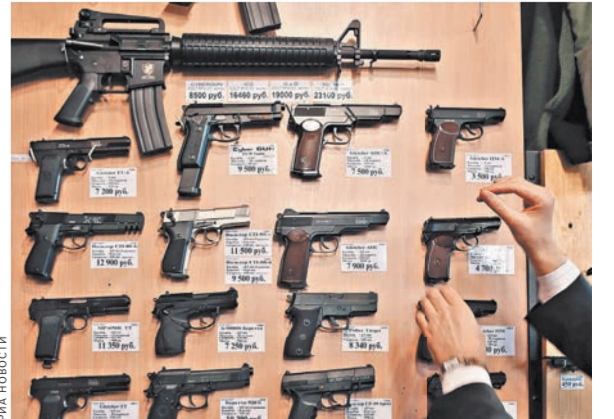
В скором будущем придется регистрировать на только огнестрельное, но и пневматическое оружие.

При этом пейнтбольного, страйкбольного и других подобных типов спортивного оружия поправки не коснутся, заверили в Росгвардии.