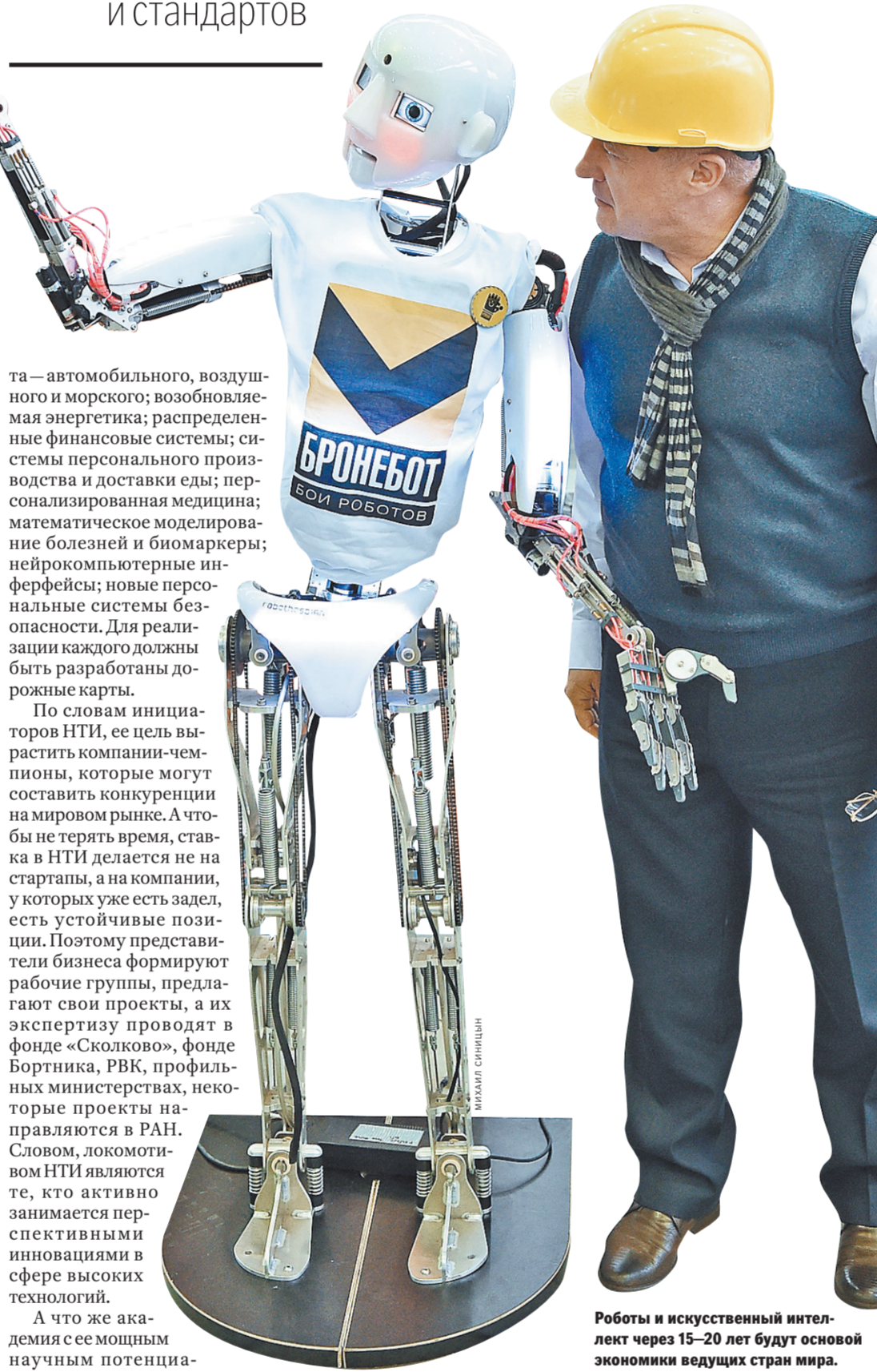
Роботы и искусственный интеллект через 15–20 лет будут основой экономики ведущих стран мира.

Конечно, науке и бизнесу не просто найти общий язык, отметил Андрей Белоусов. Ведь фундаментальная наука генерирует новые знания, ее результаты — статьи в журналах, а бизнес «чистые» знания мало интересуют. Ему, говоря образно, нужны знания упакованные, в виде патентов, ноу-хау, опытные образцы. И это тоже серьезный барьер. Чтобы его преодолеть обе стороны обязаны пойти навстречу друг другу. Кроме того, многие проекты являются междисциплинарными, в них участвуют специалисты самых разных областей науки. И здесь, по словам Белоусова, пока далеко не все получается. Мешают сугубо организационные барьеры, которые надо расширять. Наконец, он считает, что в самое ближайшее время необходимо завершить инвентаризацию сквозных технологий по каждому направлению, а также предложить РАН провести инвентаризацию, поиск перспективных проектов для разработки принципиально новых технологических заделов.