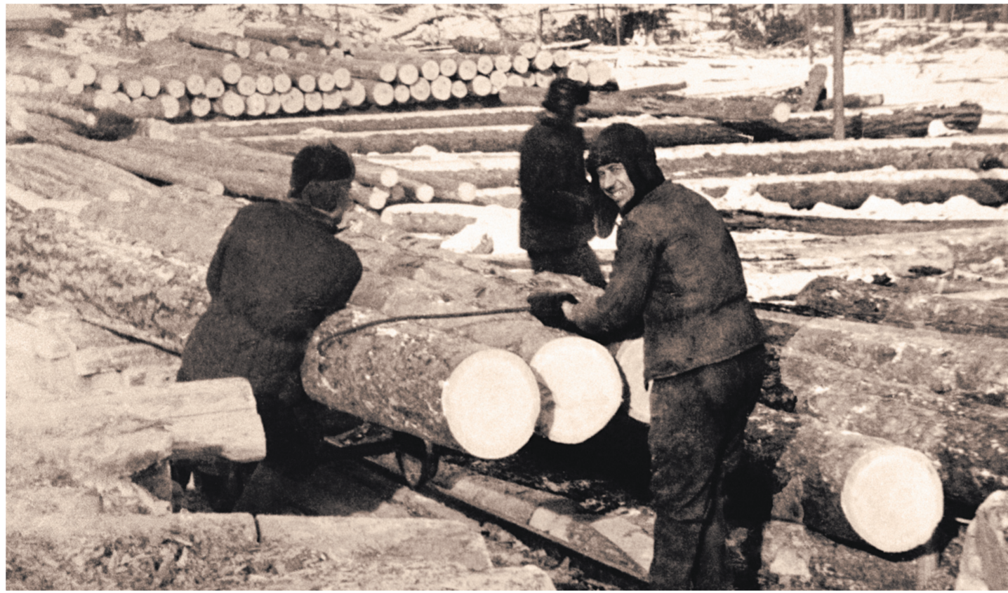
Работа заключенных в Озерлаге, 1950-й год.

Таковы были нормы довольствия заключенных (в граммах на человека в день), которые заместитель министра внутренних дел СССР генерал-полковник