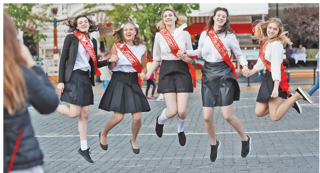
На общегородской выпускной в парке Горького в этом году придет каждый третий выпускник.

В результате московские школьники побили свой же прошлогодний рекорд по количеству дипломов, полученных на заключительном этапе Всероссийской олимпиады. В ее финале приняли участие более 1,3 тысячи учащихся. На счету столичной сборной оказалось более трети всех врученных наград — 817 дипломов против 699 в прошлом году (рост составил 17%). Из них — 167 победителей и 650 призеров олимпиады, которых подготовили 222 московские школы (рост составил 4%). Особенно школьники начали радоваться своими знаниями с 2014 года, когда завершилось реформирование школ. Они получили финансирование, при котором в равной мере деньги из бюджета города получают все школы по принципу: есть ученики — есть деньги, нет учеников — нет денег. Оснастила Москва школы и самым современным компьютерным оборудованием, создала в городе большое количество инженерных и медицинских классов. Такие условия позволяют практически каждому школьнику найти свой любимый предмет и любимого учителя.