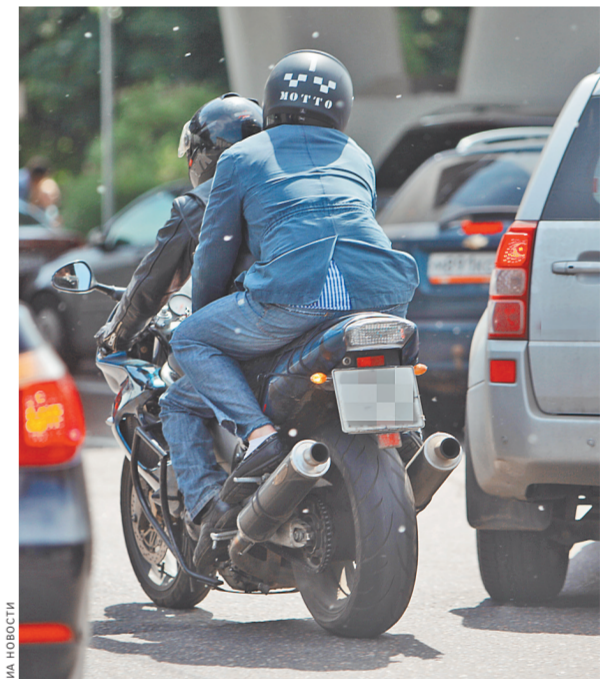
Скорость у мототакси, конечно, на зависть, но куда девать чемодан или большую сумку, отправляясь в аэропорт?

Пожойкий ответ дали «РГ» в Get-такси, также отметив, что в Москве не слишком подходящий климат для развития подобных сервисов. В столичном департаменте транспорта, курирующем работу такси в Москве, не смогли предоставить комментарий.