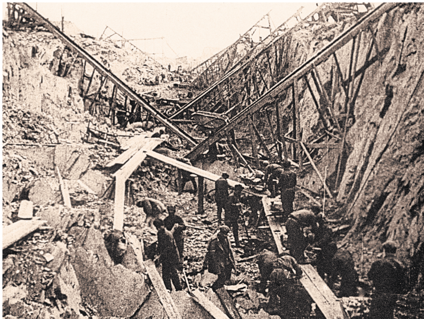
Строительство Беломоро-Балтийского канала велось в основном силами заключенных ГУЛАГа.

«Министерство внутренних дел СССР превратилось в основную организацию по золотой и платиновой промышленности; продолжает расти программа производства угля, нефти, сажи газовой, лесоматериалов, олова, никеля, меди, кобальта, алмазов, янтара, вольфрама и т.д. Товарная продукция промышлен-