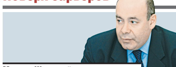
Михаил Швыдкой доктор искусствоведа