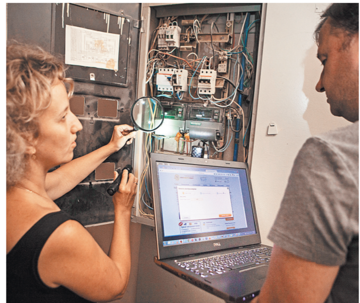
Жильцы вправе требовать компенсации за слабый ток в розетках.

О применении физической силы, специальных средств и оружия надо информировать в возможно короткий срок, но не позднее 24 часов, прокурора. Если происшествие было зафиксировано на видеорегистраторы или иные штатные средства записи, такие материалы будут предоставляться в прокуратуру по запросу.