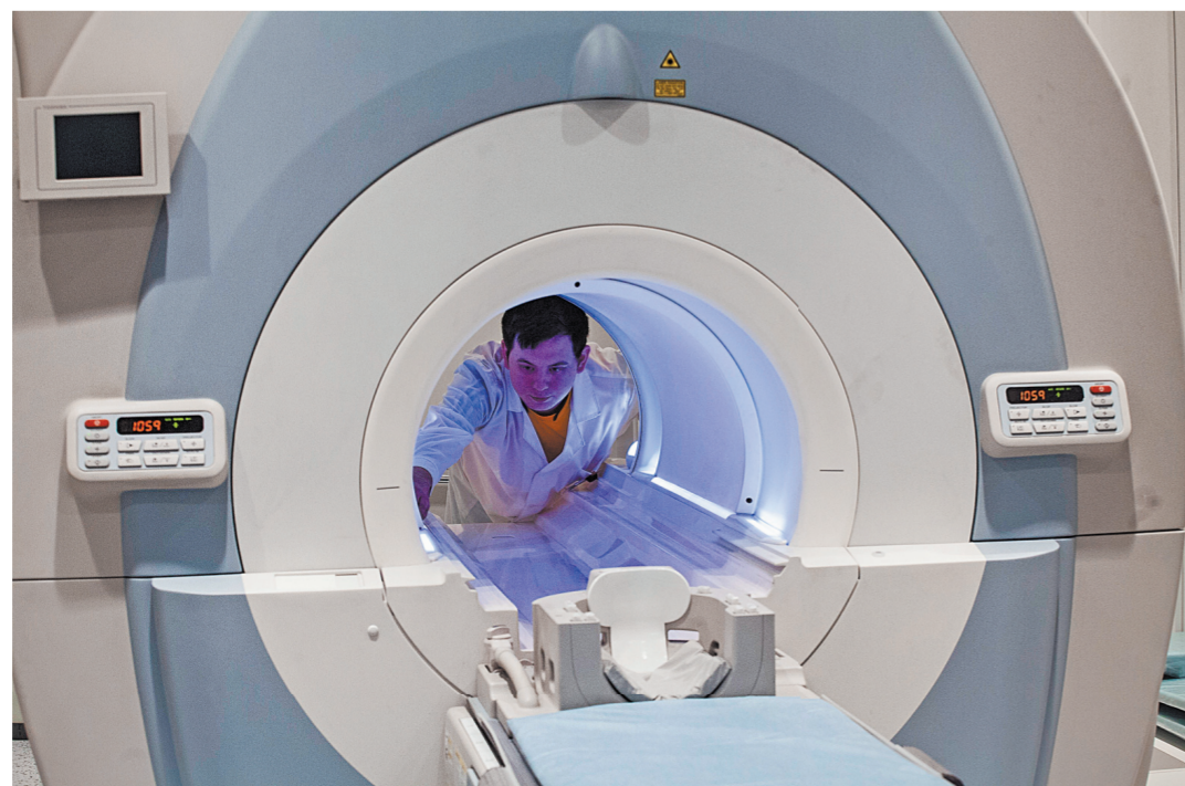
Изобретение россиян вдвое сокращает время обследования на МРТ и выявляет опухоль на самой ранней стадии.