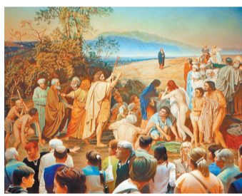
Эрик Булатов: Работа «Картина и зрители» имеет для меня особое значение. И Третьяковка — единственное место, где она должна быть.

И главный акцент в ней будет как раз на комплектовании фондов отечественного искусства XX века и нынешнего. Во-вторых, неплохо бы вспомнить, что в 2006 году Третьяковской галерее, чтобы сделать большую ретроспективу Эрика Булатова, понадобилось привезти его работы из 29 крупнейших европейских и американских музеев. В самой Третьяковской галерее картин Эрика Булатова, одного из самых известных художников XX века, почти буквально — раз, два и обчелся.