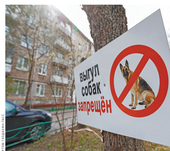
Сегодня жители пытаются бороться с собаками с помощью табличек и увещаний, но не всегда успешно.