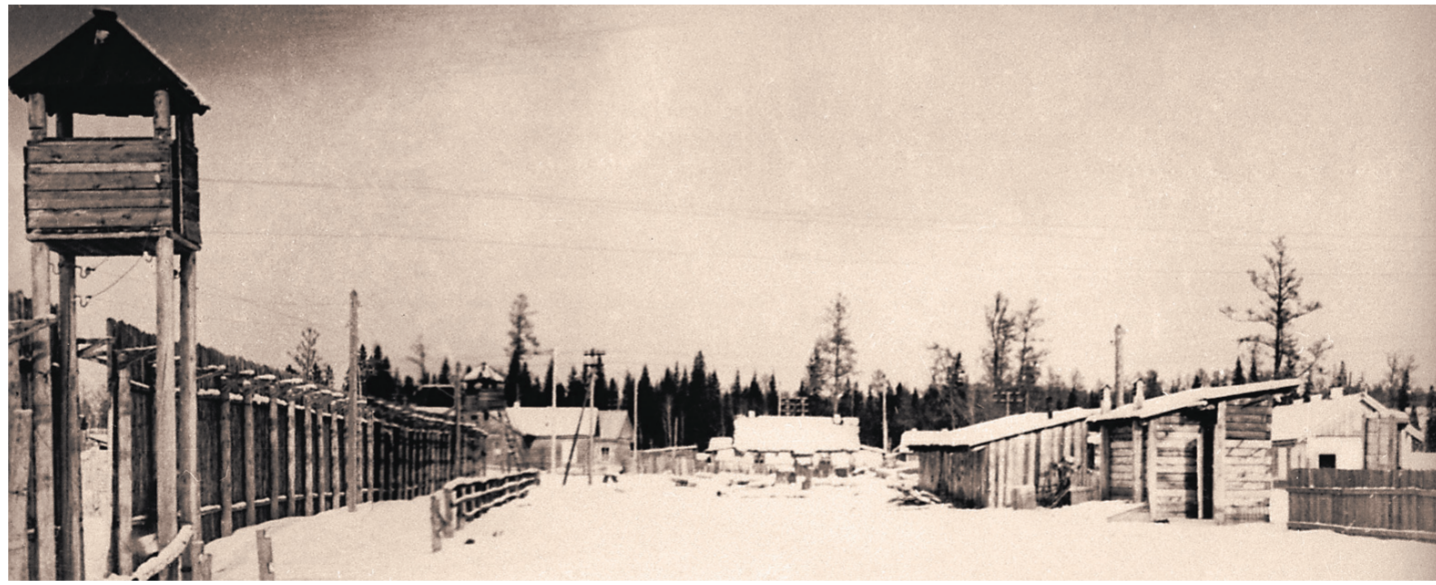
Озерный исправительно-трудовой лагерь № 7, 1951 год.