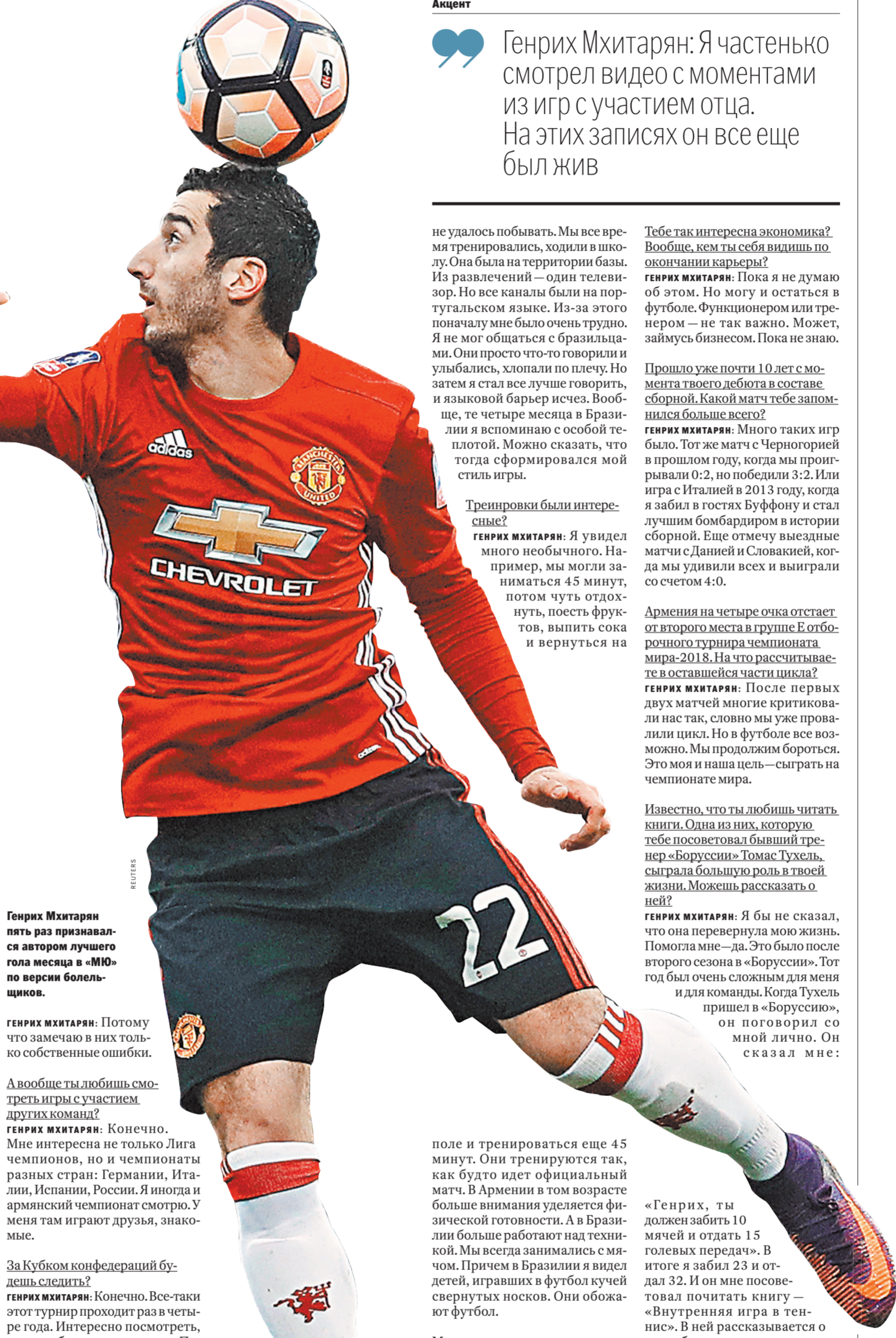
Генрих Мхитарян пять раз признавался автором лучшего гола месяца в «МЮ» по версии болельщиков.

Ты сказал, что не пересматриваешь свои записи. Почему?