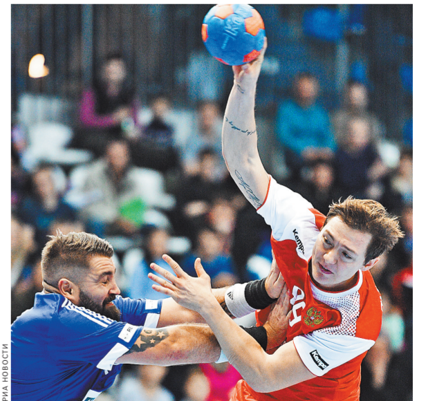
Чтобы выйти на Евро-2018, мужской сборной России надо обязательно побеждать и Словакию, и Черногорию.