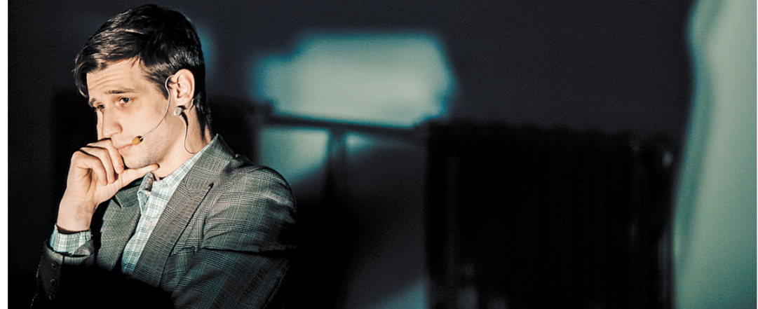
Герои спектакля «Розенкранц и Гильденстерн» обмениваются репликами, сидя за шахматным столом.