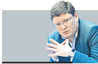
Андрей Исаев первый заместитель руководителя фракции «Единая Россия» в Государственной Думе