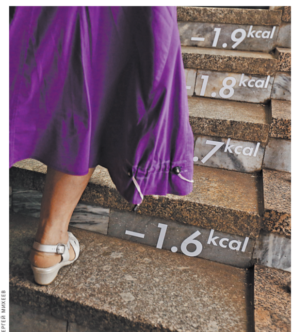
Ученые наставляют: сокращайте калории, но почему-то мир упорно движется к ожирению.