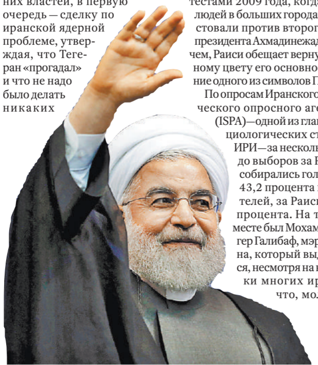
Роухани (слева) вывел Иран из изоляции. Но Раиси, его соперник на выборах, считает, что Тегеран слишком легко согласился с Западом.