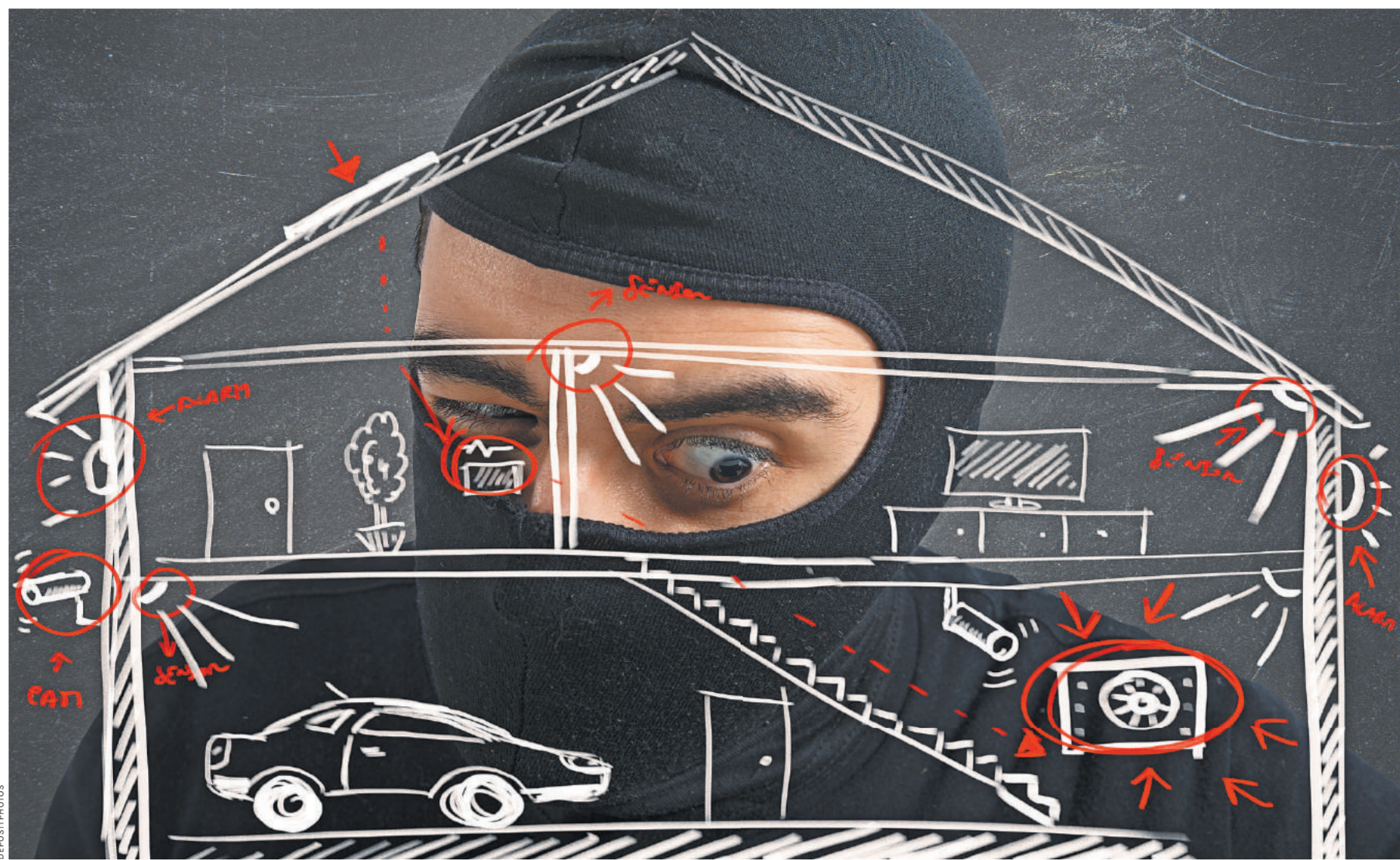
Обычно воры стараются навредить чужой дом в отсутствие жильцов. Но в последнее время преступники не так щепетильны, и у хозяев есть риск столкнуться с ними лицом к лицу.

1 А как бы сложилась судьба человека, если бы на его защиту не встала общественность?