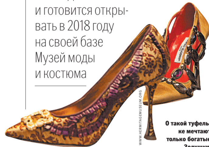
О такой туфельке мечтают только богатые Золушки.

Эрмитаж не первый раз обращается к теме дизайна и готовится открывать в 2018 году на своей базе Музей моды и костюма