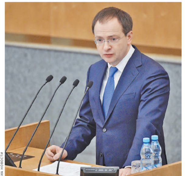
Министр культуры сообщил о разработке законопроекта по борьбе с перекупщиками театральных билетов.

На правительственном часе поговорили и о театре. В ответ на жалобы на «билетную мафию» Мединский сообщил о разработке законопроекта о борьбе с такого рода спекулянтами. «Ограничиваются сайты перекупщиков. Нельзя будет продавать билет дороже, чем цена, указанная в номинале», — назвал он ключевую идею. Кроме того, строго будет ограничен перечень причин, по которым можно будет сдать билет в кассу за 15 минут до спектакля. Эти и другие меры согласованы с театральным сообществом, сказал собеседник депутатов.