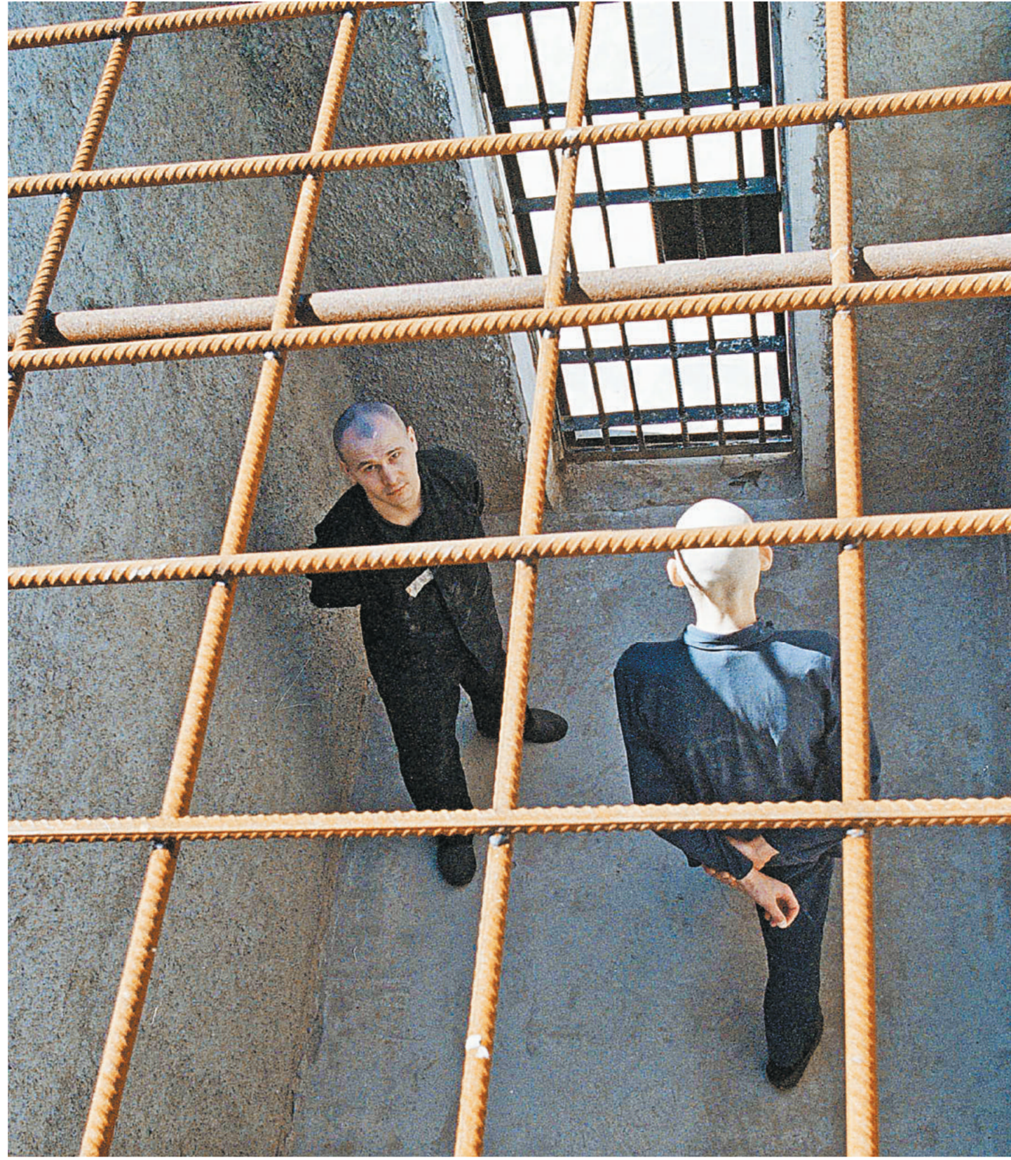
Повзрослевших заключенных из воспитательных колоний предлагается изолировать от взрослого криминала.

Еще один актуальный вопрос: правовой статус школ воспитательных колоний.