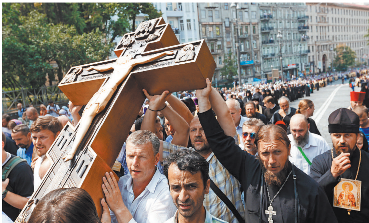
Пока еще на крестный ход верующие в Киеве выходят без согласования с властями.

К главам государств и религиозным лидерам Патриарх Кирилл обращается с призывом приложить все усилия к тому, чтобы воспрепятствовать принятию дискриминационных этих законопроектов, которые грозят стать вопиющим примером попрания прав человека на свободу религиозного исповедания».