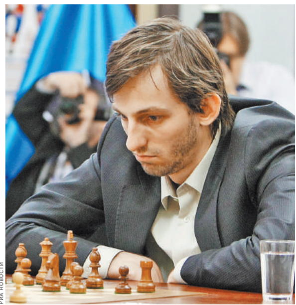
Александр Грищук — один из пяти российских гроссмейстеров, которые принимают участие в московском турнире.

Напомним, что турнир претендентов состоится в марте 2018 года. Одним из участников автоматический стал россиянин Сергей Карякин. Там также сыграют два лучших шахматиста Гран-при ФИДЕ, два сильнейших участника Кубка мира и два лучших по рейтингу из числа не отобравшихся по первым двум критериям и один обладатель «уайлд-кард». Матч за мировую шахматную корону между Карлсеном и победителем турнира претендентов 2018 пройдет в том же году с 7 по 28 ноября.