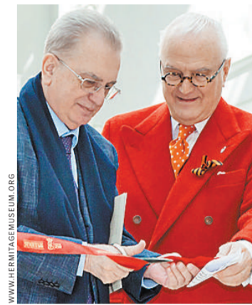
Эту выставку в Эрмитаже Михаил Пиотровский и Маноло Бланник открывали вместе.

Залы представляют основные темы, интересные дизайнеру. Скажем, секция «Сердце» рассказывает о важных, интересных дизайнеру. Скажем, секция «Сердце» рассказывает о важных, интересных дизайнеру.