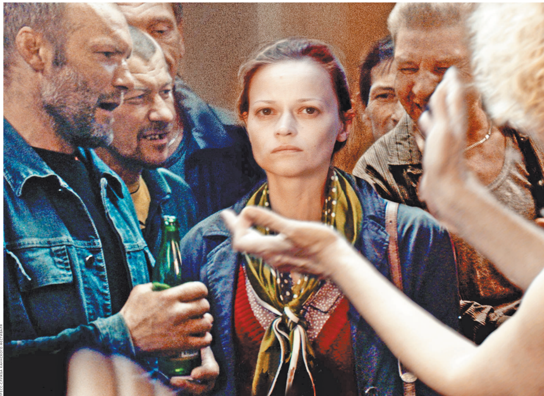
Выжить в такой среде главной героине оказывается очень сложно, не потеряв человеческие ценности: сострадание, терпение, любовь.