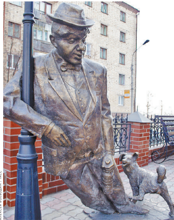
В Красноярске любителям рюмочки установили персональный памятник.