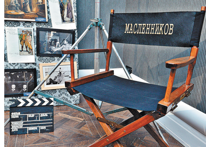
«Именная» кресло у режиссера на съемках не было. Но ему понравилось.

Фоторепортаж с выставки смотрите на сайте rg.ru/art/1343025