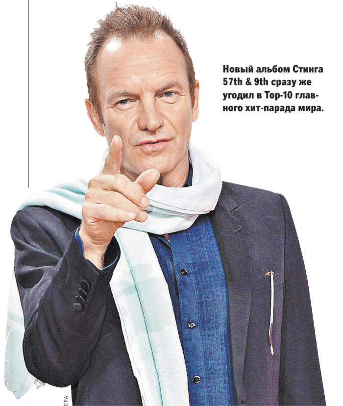
Новый альбом Стинга 57th & 9th сразу же угодил в Top-10 главного хит-парада мира.

Впрочем, беспокоился Стинг, похоже, не зря. Ведь помимо главного сингла альбома — I Can't Stop Thinking About You действительно сильных и эмоциональных удач на 57th & 9th немного. Разве что две песни, наследующие ритмике и куражу группы Police начала 80-х: One Fine Day и Petrol Head. Зато много красивых, страстно спетых баллад, за которые Стинга тоже всегда ценили. Но этого, похоже, оказалось недостаточно: стремительно деботировав в главном хит-параде мира Billboard Top-200 на девятом месте, диск уже вскоре откатился за пределы первой сотни лучших. Впрочем, эта неудача эмоционально и настороно Стинга наверняка только раззадорит. А значит, ждать очередных премьер и альбомов от него долго не придется.