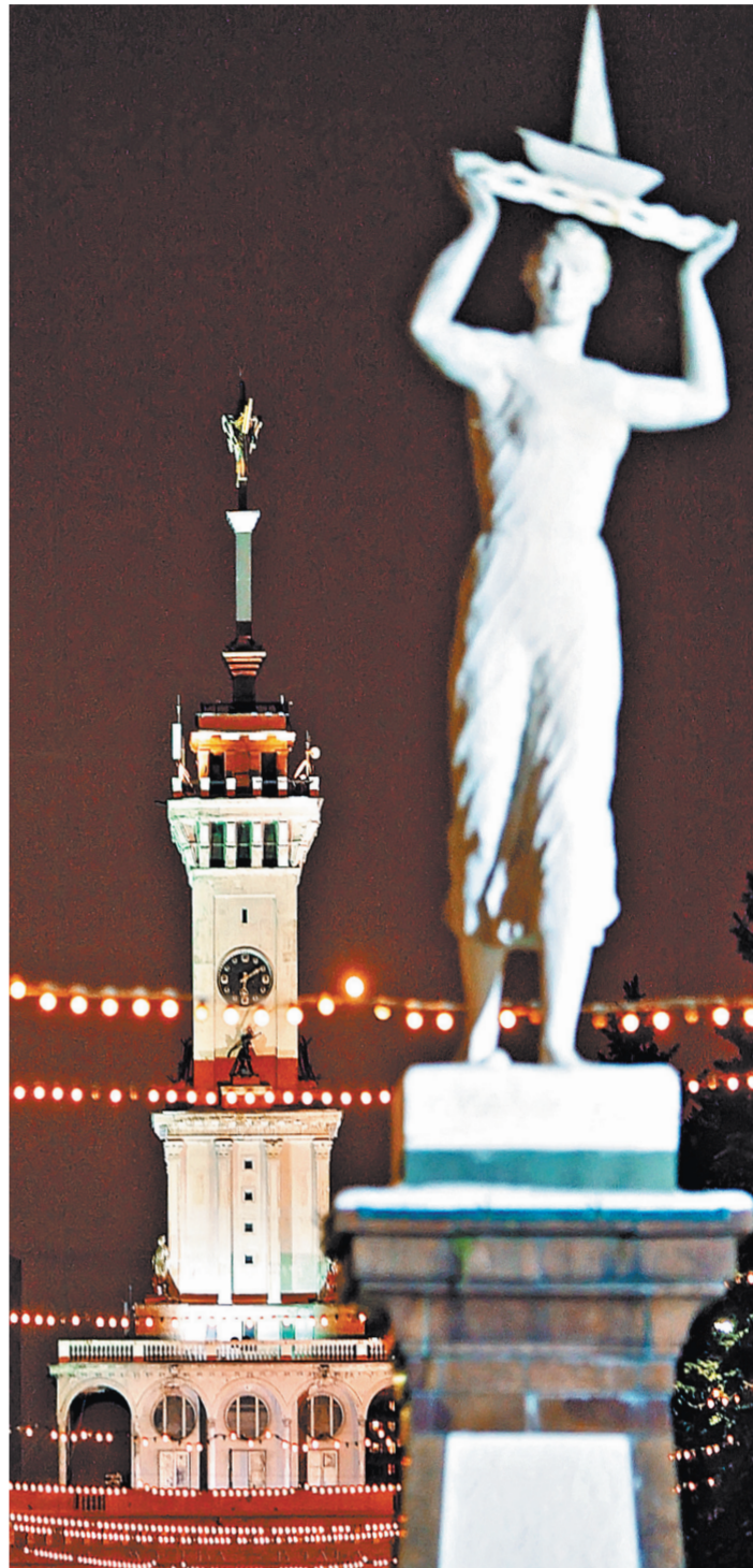
Речной вокзал, как и прилегающий к нему парк, носят статус объектов культурного наследия.

История здания вокзала, напомним, началась в 1930-е