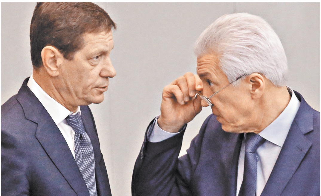
Александр Жуков и Владимир Васильев делятся впечатлениями от завершающего 2016 год заседания Госдумы.

Следите за курсом валют на сайте rg.ru/sujef/3477