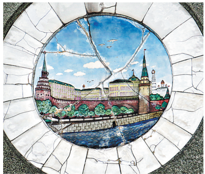
Большинство элементов фасадов и интерьеров вокзала нуждается в реставрации.

Во время закрытия навигации и вновь выдвигаться с ее возобновлением, но на практике механизм использовали лишь несколько раз. Задумывалась постройка как символ Москвы — порта пяти морей. Об этом свидетельствует и хорошо сохранившаяся на фасаде надпись «1933 ВОЛГА = МОСКВА 1937». Она подчеркивает роль канала, давшего судам возможность выходить из столицы к морям через Волгу и Дон.