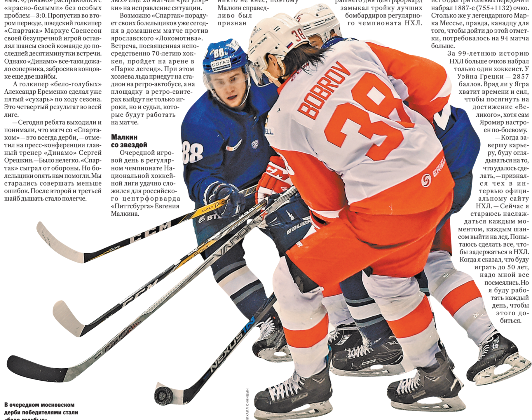
В очередном московском дерби победителями стали «бело-голубые».