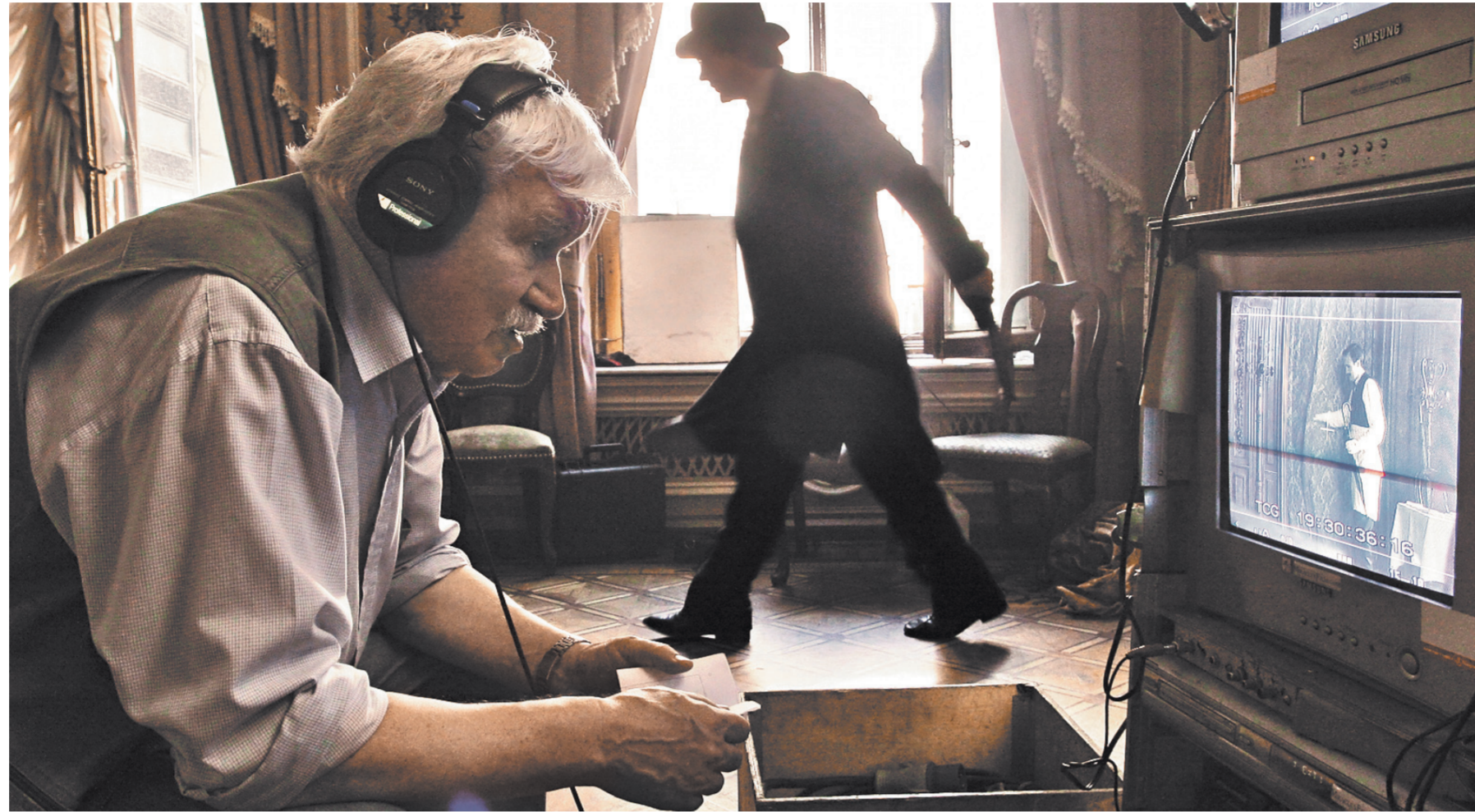
Первую свою картину, «Кузя и Маргарита», Масленников снял на «Ленфильме» полвека назад.

Знаменитый сыщик занимался на досуге боксом, фехтованием, играл на скрипке, поэтому присутствуют боксерские перчатки,