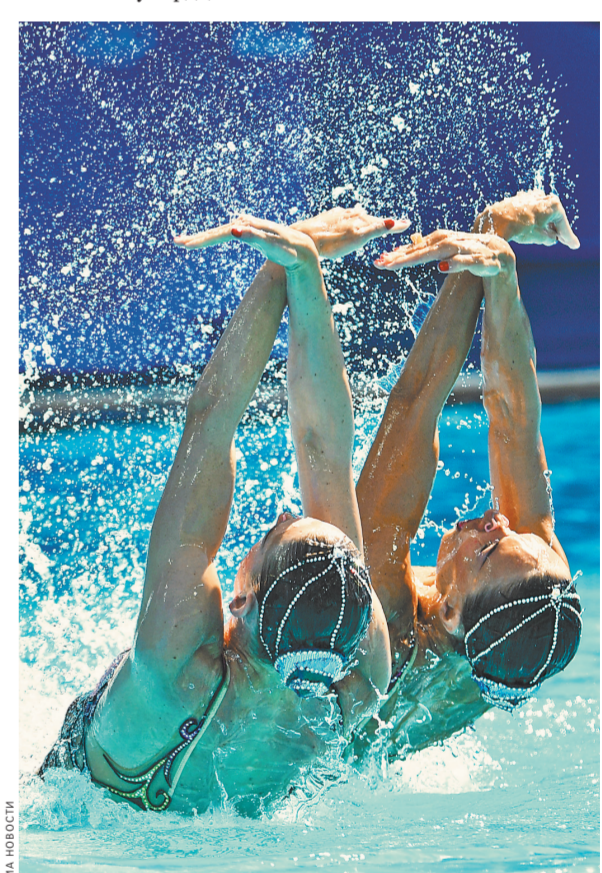
Синхронистки Светлана Ромашина и Наталья Ищенко теперь уже пятикратные олимпийские чемпионки.

Не вошел в «десятку» никто из пловцов, даже красавица Юлия Ефимова «проплыла» мимо. Здесь, судя по мнению многих ведущих журналистов, сыграло не в пользу Юли то, что сразу после Игр она вернулась тренироваться в США. А ведь в чем только не упрекали дважды серебряного призера Рио пловца американской сборной! Но выбор сделан, его надо уважать, а уж голоса отдавать по зову сердца.