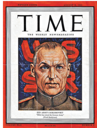
В разгар Сталинградской битвы Time опубликовал портрет Рокоссовского на обложке.

Внук маршала рассказал «РГ», что в последние годы он наблюдает, как растет интерес в семье Рокоссовских можно судить по тому, что, несмотря на арест Константина Константиновича в 1937-м, несмотря на скитания его семьи в начале войны, жена и дочь не расстались с патефоном, на котором в те счастливые времена, когда семье удавалось собраться вместе, они слушали пластинки Александра Вертинского.