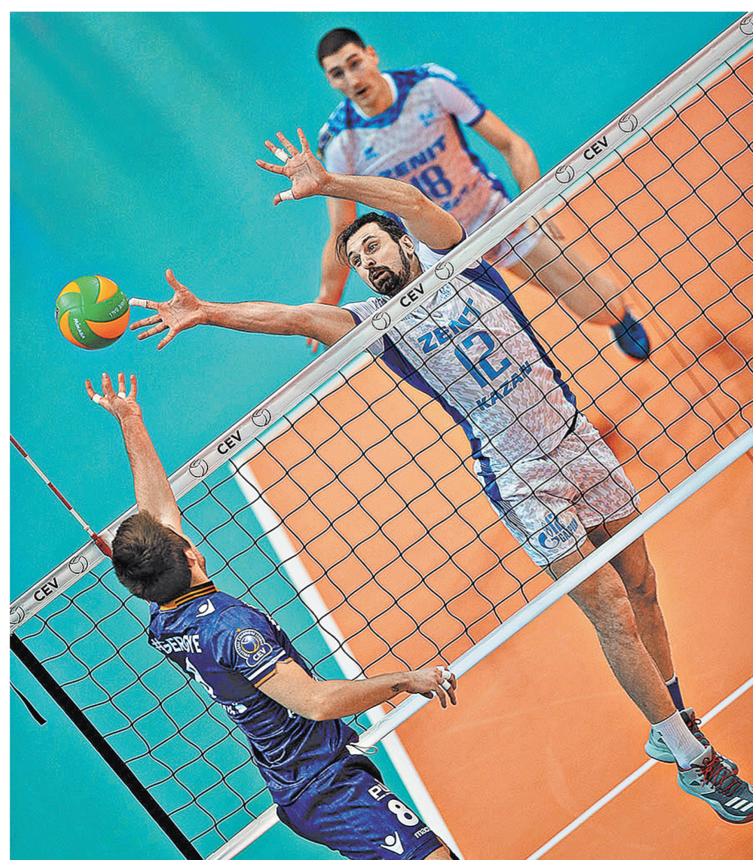
Казанский «Зенит» дома разобрался с французским клубом «Пари Волей» всего лишь за час с небольшим.