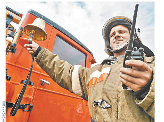
Сигнал SOS уйдет по смс-рассылке родным и в МЧС.

В ходе конференции было презентовано совместное монографическое исследование сотрудников института и МЧС России — «Правовые и институциональные основы предупреждения и ликвидации последствий чрезвычайных ситуаций». А выпустившие предложения детально прописать в законе понятие социально-значимой информации и установить правила ее распространения, возможно, предусмотреть какие-то льготы организациям, которые ее распространяют. Например, сегодня в разных региональных управлениях МЧС активно выпускают коммюнике для детей по правилам безопасности. Вопросы их распространения было бы решать проще, если официально придать им статус социально значимых материалов. Но пока таких правил, к сожалению, нет.