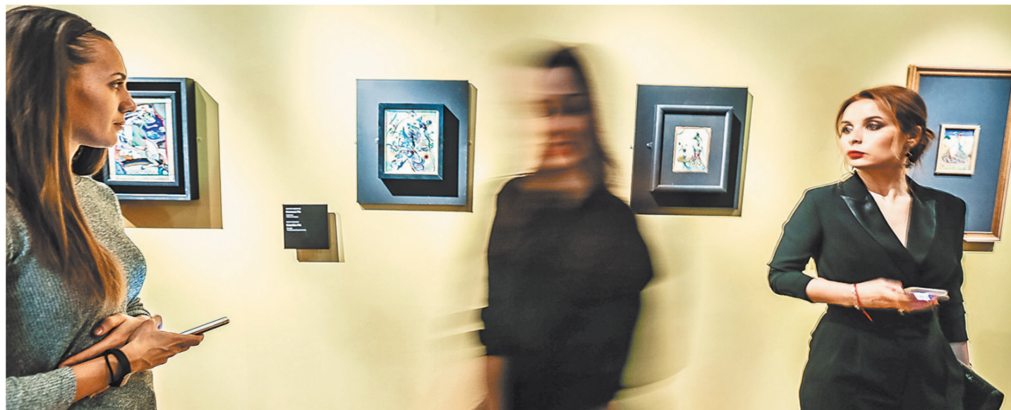
На выставке представлены не легендарные полотна, а камерные, редко показываемые росписи на стекле Кандинского.

Французское словечко bagatelle обычно вспоминают, когда речь заходит о небольших и сложных музыкальных пьесах. Кандинский, для которого музыка и живопись были равно родными стихиями, обозначил так свои работы маслом под стеклом, сделанные в технике немецких народных росписей — Interglasmalerei. В деревнях Южной Германии они выполняли разом роль и назидательного