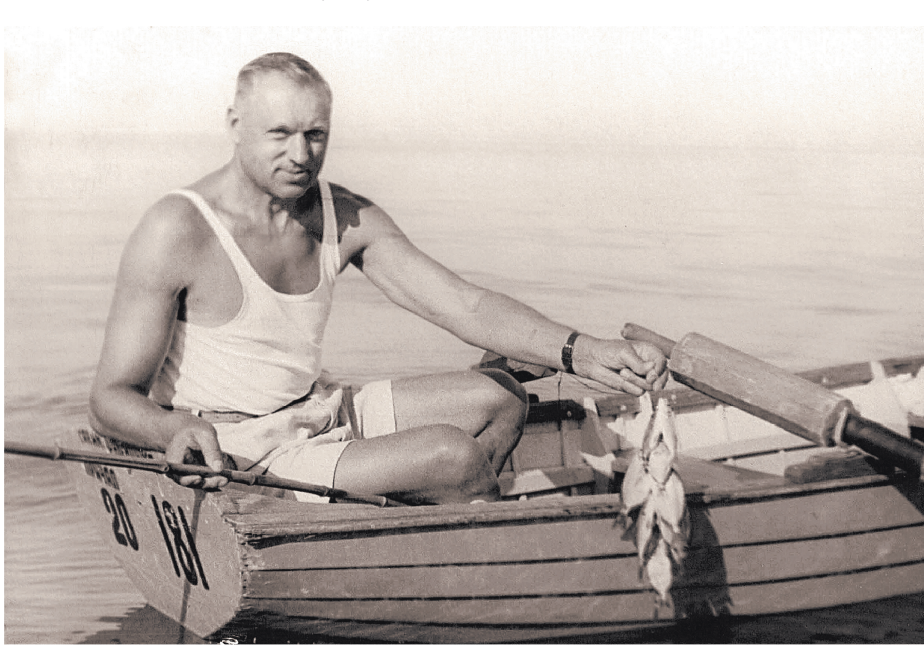
РИА НОВОС / А. К. РОКОССОВСКИЙ