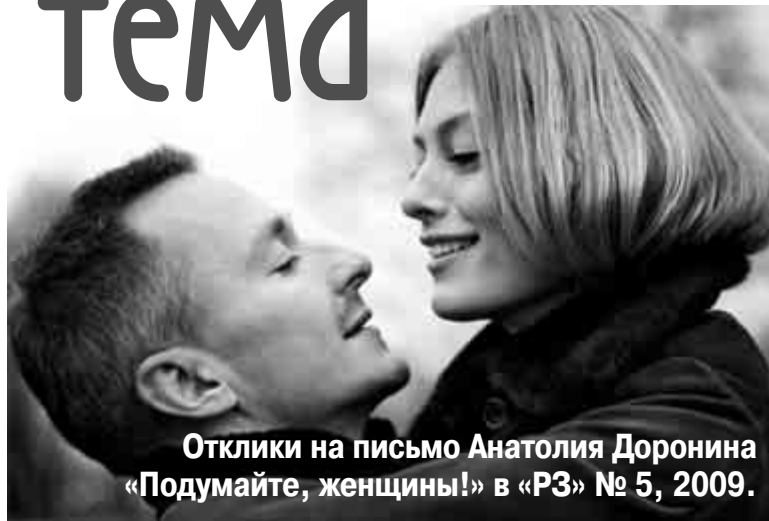
Отклики на письмо Анатолия Доронина «Подумайте, женщины!» в «РЗ» № 5, 2009.