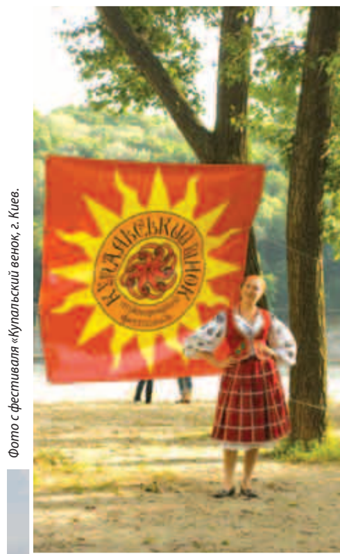
Фото с фестиваля «Купальский венок», г. Киев.