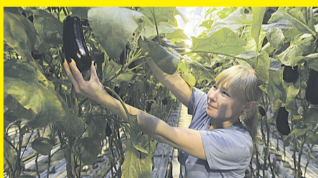
график 2/2, з/п от 35 тыс. руб.