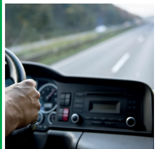
Возможна вахта и проживание

Тел. 8-925-001-63-35 пн-пт с 10.00 до 17.00