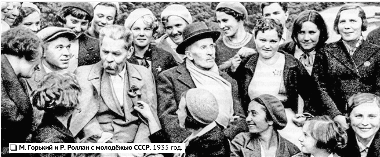
М. Горький и Р. Роллан с молодёжью СССР. 1935 год.

Роллан горячо боролся за освобождение из тюремных застенков деятелей международного рабочего движения: Сакко и Ванцетти, Димитрова, Тельмана, Антонио Грамши. В 1925 году он участвовал в протесте МОПРА против белого террора в Польше, Румынии, Болгарии. В 1926 году вместе с Анри Барбюсом