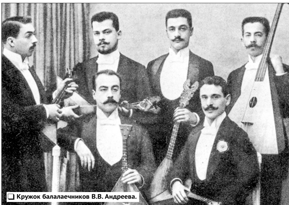
Кружок балалаечников В.В. Андреева.