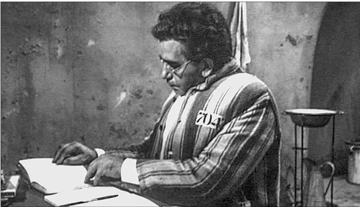
□ В тюремном заключении.

Итальянским коммунистам первым в Европе пришлось вступить в смертельную схватку с фашистской тиранией. Главная историческая за-