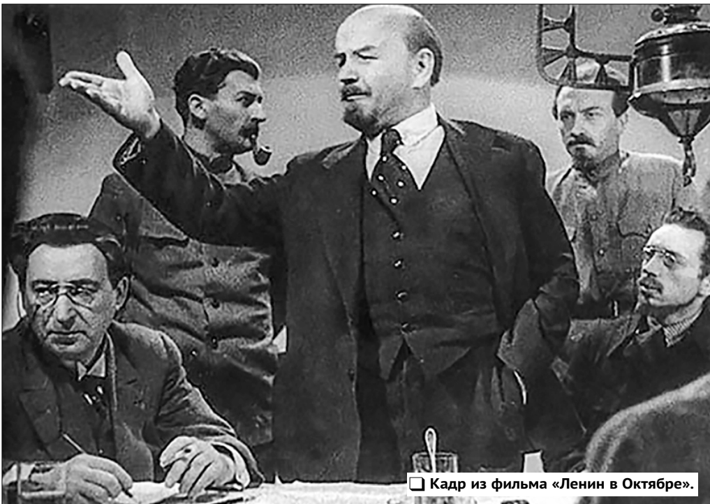
Первые его самостоятельные работы