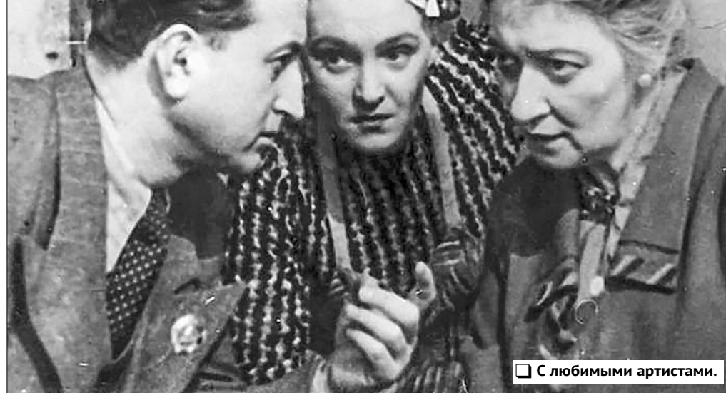
С любимыми артистами.

Ромма мы вспоминаем, конечно, как первопроходца первых фильмов о В.И. Ленине.