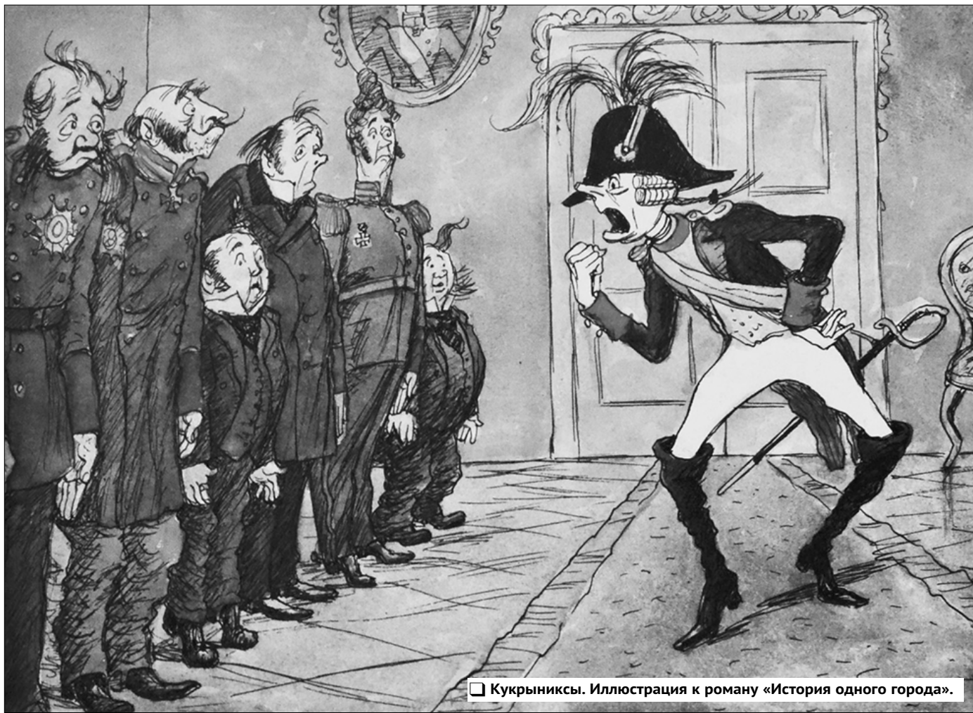
Кукрыныксы. Иллюстрация к роману «История одного города».

Его жизнь пришлась на правление трёх императоров, — Николая I, Александра II и Александра III — двое из которых были однозначными реакционерами, то есть поборниками «стабильности». Первый из этих троих монархов активно занимался строительством того, что позже будут именовать «вертикаль власти». При нём впервые в истории России число чиновников превысило 100 тысяч,