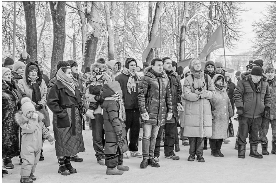
Жители Кольчугино (Владимирская область) опубликовали петицию, призывающую людей голосовать против закрытия родильного отделения местной районной больницы.