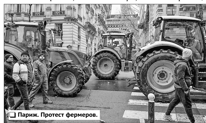
Париж. Протест фермеров.

Скандируя: «Мы против нечестной конкуренции!», «Требуем спасти национальный агросектор!», главные кормильцы