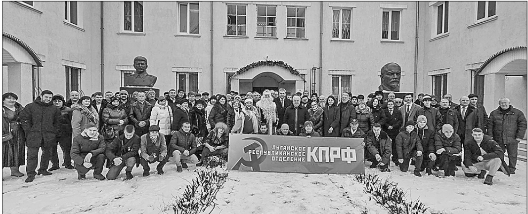
Собрание актива ЛНР.