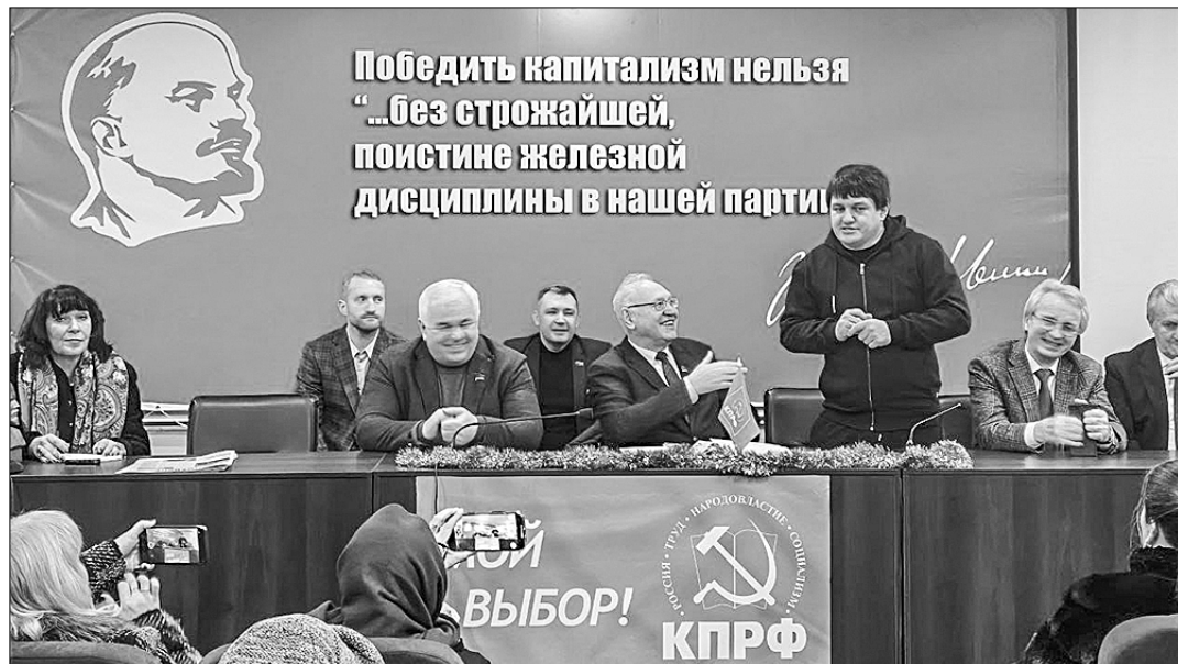
Собрание актива ДНР.

время прятаясь от снарядов в подвалах. В полностью восстановленных шести пятиэтажных домах они располагаются по договорам на временное проживание. Причём, в отличие от многих соседних населённых пунктов, вода благодаря пробуренной скважине подаётся в квартиры 24 часа в сутки, работает канализация. Для отопления помещений в домах установлены промышленные генераторы. Выстроено в Авдеевке и ещё одно новое здание, где располагается администрация и... Дворец бракосочетания. Посреди разрушенной божьи Авдеевки его яркая надпись вызывает некий диссонанс, однако одновременно вселяет уверенность, что жизнь возвращается в искалеченные войной места.