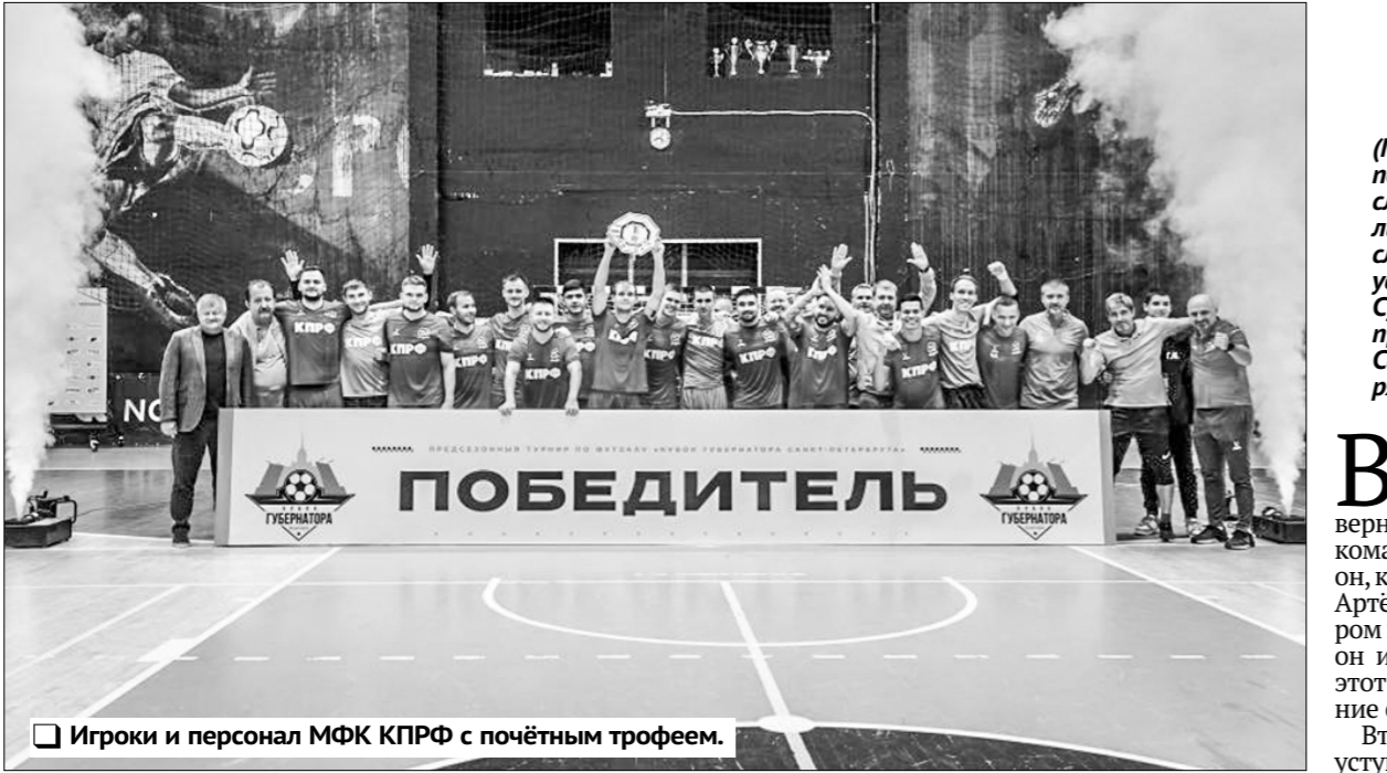
Игроки и персонал МФК КПРФ с почётным трофеем.