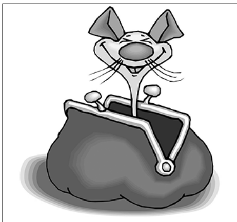
«Нет, это определённо мыши! Я даже готов в это поверить, — всё глубже погружаясь наш герой в мученический образ. — Да полчища этих тварей шибует всё что угодно! И шахту подточат, и плотину сковырнут...»

— Как вам, милый мой, такой поворот темы страшного потопта? — встрепенулся скисший был директор в диалоге с самим собой и с восторгом хлопнул себя по затылку.