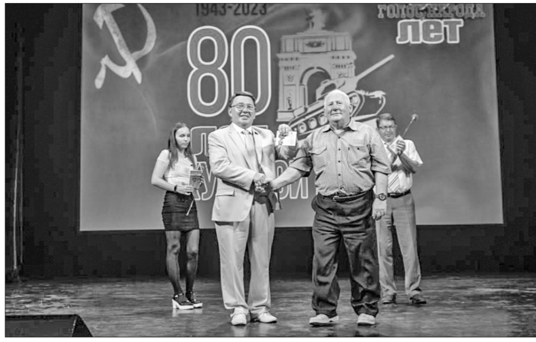
строительство «Мираторга» в деревне Зиборово Золотухинского района. В эти дни отмечается 80-

«Голос народа» — единственная оппозиционная газета в Курской области. Благодаря регулярным и острим публикациям в газете удалось сохранить курскую трамвай, отстоять позицию большинства курян по отдельным пунктам Генерального плана города, закрыть химические чека на «Экотексе», прекратить