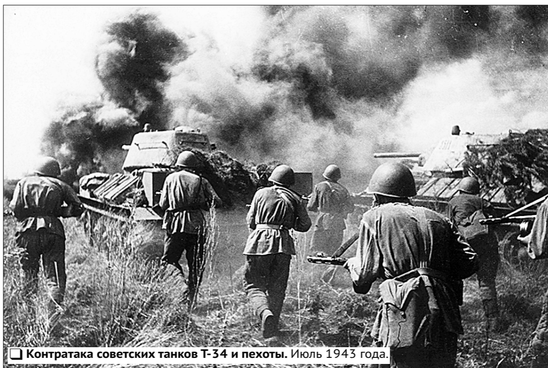
Контратака советских танков Т-34 и пехоты. Июль 1943 года.

Материалы, посвящённые этой теме, — в следующих номерах «Правды».