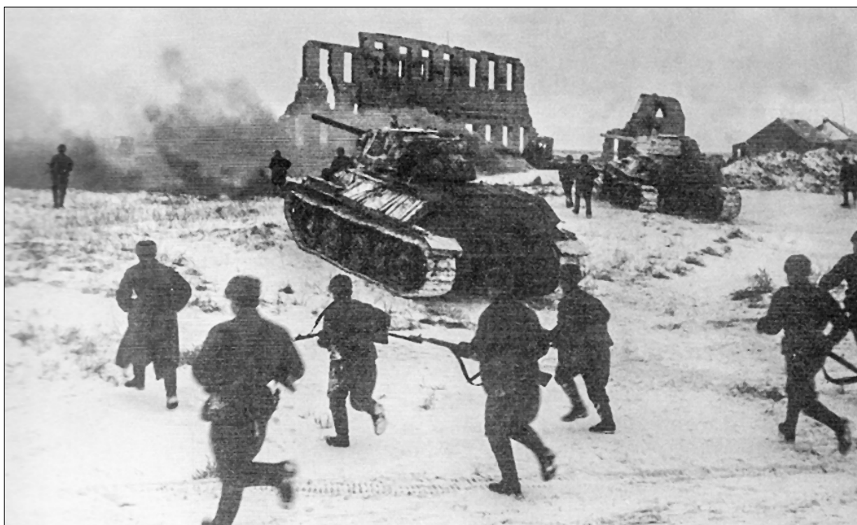
□ Уже 25 ноября 1942 года части 124-й бригады Горохова и соседней дивизии Донского фронта совместно пошли в наступление.

После соединения группы Горохова с войсками 66-й армии Донского фронта 24 ноября 1942 года