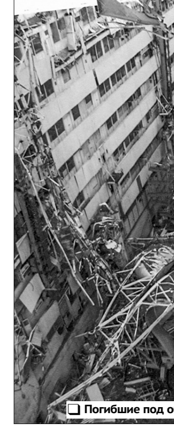
Погибшие под обломками «Буран» и «Энергия».

В ходе производившихся на крыше ремонтных работ произошло обрушение трёх из пяти пролётов МИКА.