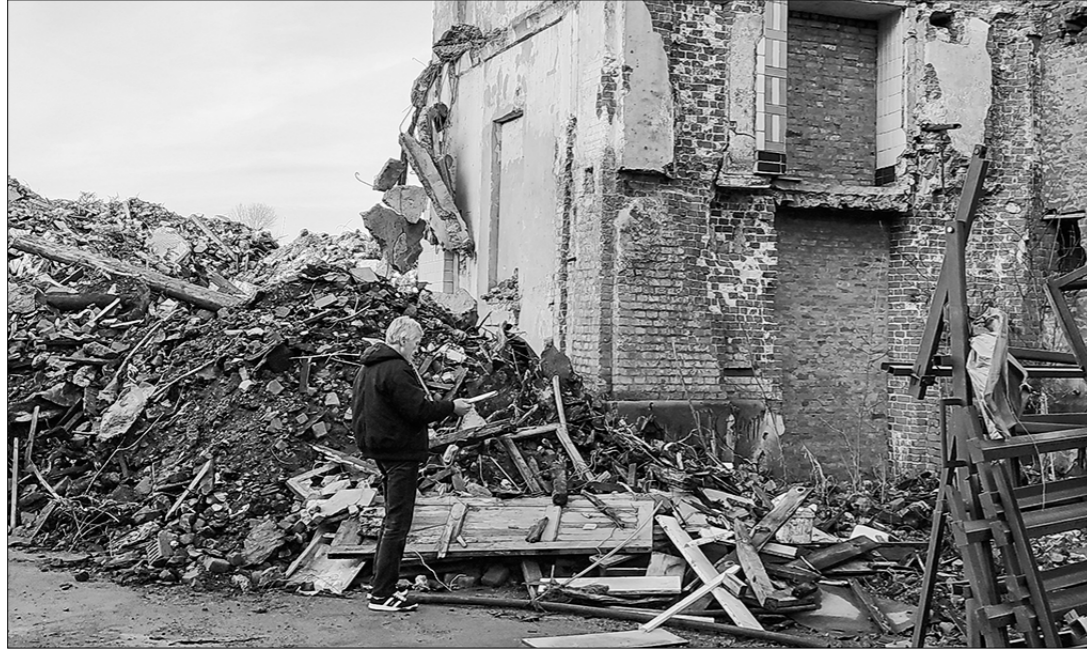
□ Развалины хлопчатобумажного комбината «Рабочий».

А бродило оно в бюрократических мехах долго, о чём «Правда» писала дважды: сначала прошлым летом в заметке «Грибной сезон на пляже» (№79 от 22—25 июля) и в конце минувшего августа в материале, озаглавленном «От дождя спаси, а час не вернули» (№89), где, кроме прочих городских проблем, коротко рассказывалось о том, что уже не первый год вход в тенистый скверик, красиво расположенный вблизи городского Дворца культуры в самом центре Озёр, со всех сторон перекрыт металлической сеткой с грозными табличками, предостерегающими летнюю публику от покушений на его соблазнительный уют и хвойную прохладу. И вот на днях звонок в редакцию от наших подмосковных читателей.