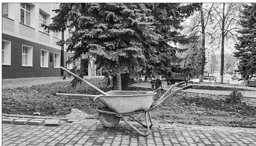
□ Возле скверика.

Представьте, после ваших публикаций не только наш пляж на Оке в порядке привели, а сейчас кладут туда новую пешеходную дорожку, но и закипела работа в том городском скверике! — радостно доложили они. — Убрали наконец-то с глаз долой эти столько лет позорившие лицо города жуткие сетки. Песок, видим, подвели, начали перекадывать бордюры... Приезжайте, посмотрите. И надо бы написать... Непременно! Когда закончат работу. Вот тогда наша самая «деловая» рубрика и пригодится. А ещё сообщили нам озерчане новость, которая, пожалуй, поинтереснее решительного всплеска благоустроительного рвения местных властей. Оказывается, совсем недавно городскому Дворцу культуры вернули прежнее советское название «Текстильщик», отнятое у него буржуазным режимом после того,