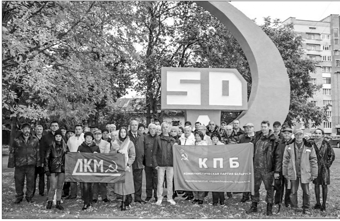
Лезных дел, посвящённых не только сохранению исторической памяти и советского наследия, но и его популяри-

В последние годы состояние композиции оставляло желать лучшего. Поэтому Пинский горком Компартии Беларуси и городское отделение Лиги коммунистической молодежи инициировали и вместе с коммунальным предприятием организовали ремонтно-реставрационные работы памятника.