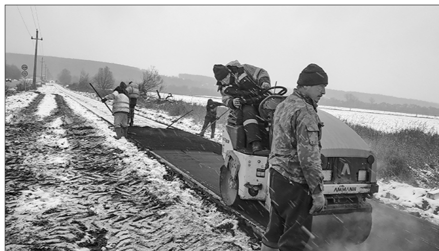
□ Новая велосипедно-пешеходная дорожка на окский пляж.