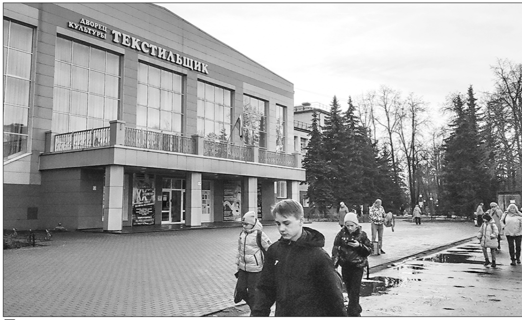
□ ДК «Текстильщик» вернули имя.

И мы, признаться, уже готовы были поставить эту заметку под нашу любимую рубрику «Правда»... «Правда» выступила — что сделано, но в последний момент решили: с таким ответственным шагом стоит повременить. Пока же остаётся констатировать, что дело это, как говаривал великий пролетарский поэт Маяковский, «делается уже»... Пусть оно и небольшое даже в масштабах подмосковных Озёр, о которых сегодня речь, но важное уже тем, что жители этого городка заставили — и, сдаётся, не без помощи нашей газеты — местных деятелей благоустройства зарядить энергией своё ксисшее было вдохновение.