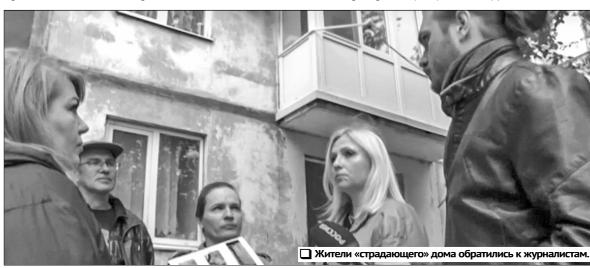
Жители «страдающего» дома обратились к журналистам.