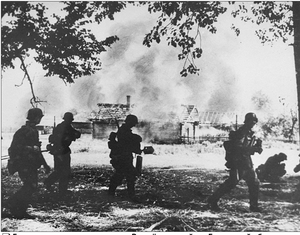
Гитлеровцы сжигают деревню в Рогачёвском районе Гомельской области.