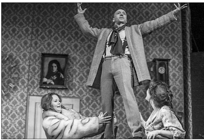
Сцена из спектакля.

Недавно депутатом Липецкого областного совета был представлен доклад о деятельности губернатора Липецкой области Игоря Артамонова за 2021 год. Внимание парламентариев привлекла информация, что министерство культуры РФ выделило грант в размере нескольких миллионов рублей на спектакль Липецкого драматического театра «Горе от ума».