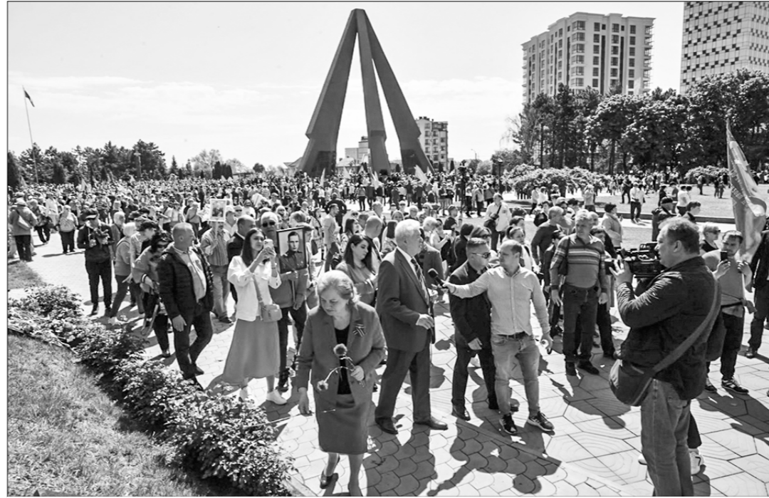
9 Мая в Кишинёве (в первом ряду в центре — В. Воронин).

Нас просто загоняют в информационно-идеологическое гетто. Даже не гетто, а концлагерь, надёжно окружённый колючей проволокой, сквозь которую пропущен ток высокого напряжения в виде санкций, штрафов, возможности закры-