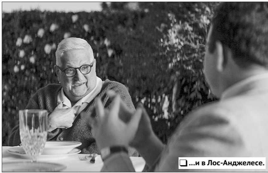
...и в Лос-Анджелесе.

Документальные события в художественном преломлении неизбежно сопряжены с вымыслом. В действительности этот фильм называется проще и определеннее: «Разгром немецких войск под Москвой».