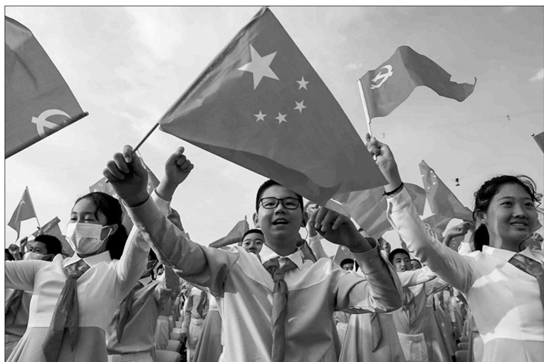
В Пекине открыта выставка, посвящённая истории Коммунистического союза молодёжи Китая (КСМК), возглавляемого Компартией страны, заявили в ЦК КСМК.

В качестве иллюстрации замечательного пути неустанный борьбы и труда поколения молодых китайцев за национальное возрождение и развитие на выставке пред-