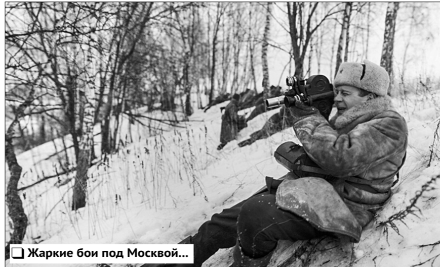
Жаркие бои под Москвой...

Кино в кино — это всегда интересно уже потому, что открывает дверь в творческую лабораторию. Что руководит художником на пути к искусству, на каком материале решает он свою жизненную задачу, из какого сора растут стихи — всё это с особенной ясностью проявляется на экране, когда открывается доступ в профессиональную «кухню».