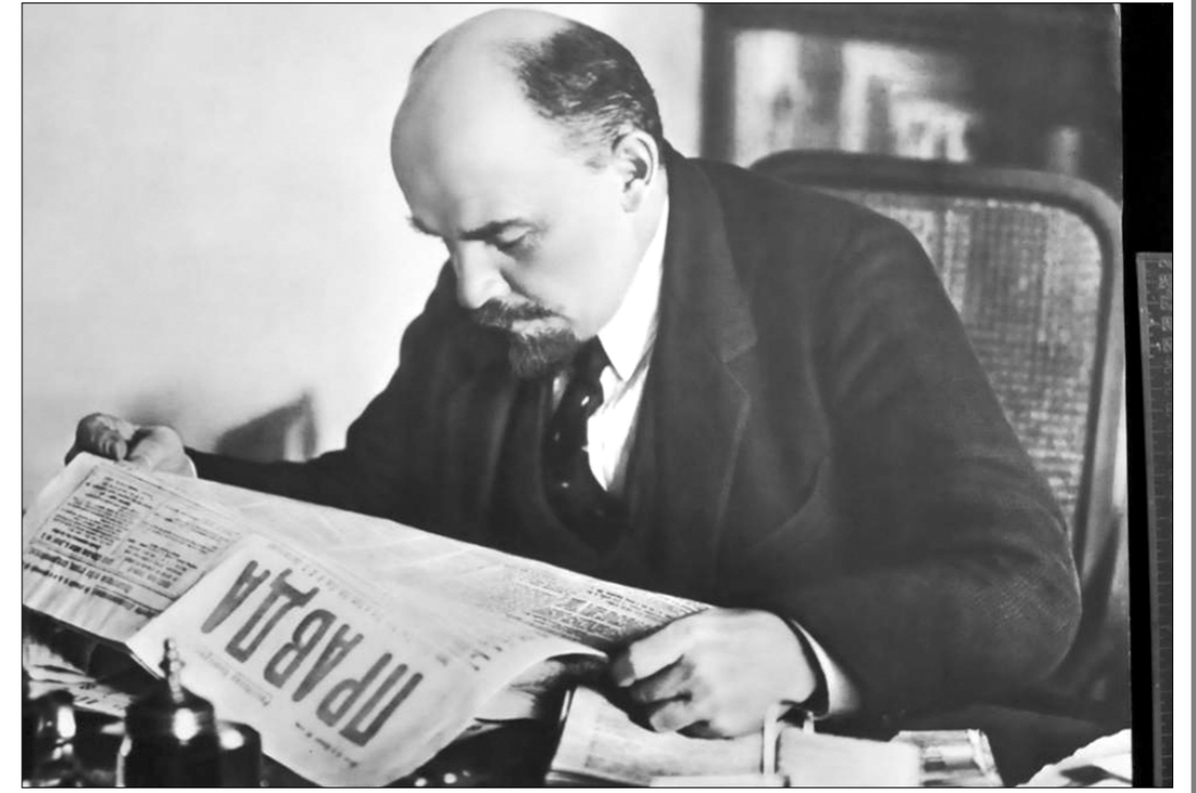
Ленин читает «Правду». 16 октября 1918 г.

Поставив ежедневную рабочую газету, петербургские рабочие совершили крупное, — без преувеличения можно сказать, историческое дело. ...Создание «Правды» остаётся выдающимся доказательством сознательности, энергии и сплочённости русских рабочих, ...Нам нужна газета не только для того, чтобы помочь нашей рабочей борьбе, но для того, чтобы дать образец и светоч всему народу.