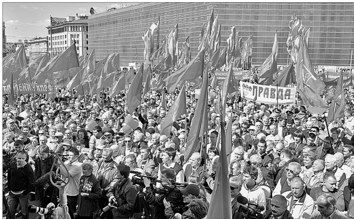
«Правда» всегда вместе с трудовым народом.

через это и многое-многое другое. А ответов, кроме «перестройки альтернативы нет», руководство партии не давало. В обществе стремительно стал падать авторитет Горбачёва и партии в целом. Пал авторитет и «Правды», особенно когда в 1989 году главным редактором вместо В.Г. Афанасьева стал И.Т. Фролов — человек, близкий к Горбачёву. Я ценю именно афанасьевскую «Правду» (1976—1989 годы). Чем закончилась «перестройка», хорошо известно. «Правда» из главной газеты страны, каждое слово которой, по крайней мере до конца 1980-х годов, было законом, превратилась в газету оппозиционную, а временами гонимую. Но она многое сумела сохранить от той, старой советской «Правды», которая была одной из лучших газет не только страны, но и мира. Естественно, после перерегистрации в 1995 году в КПРФ я стал читать «Правду», но не только потому, что она является